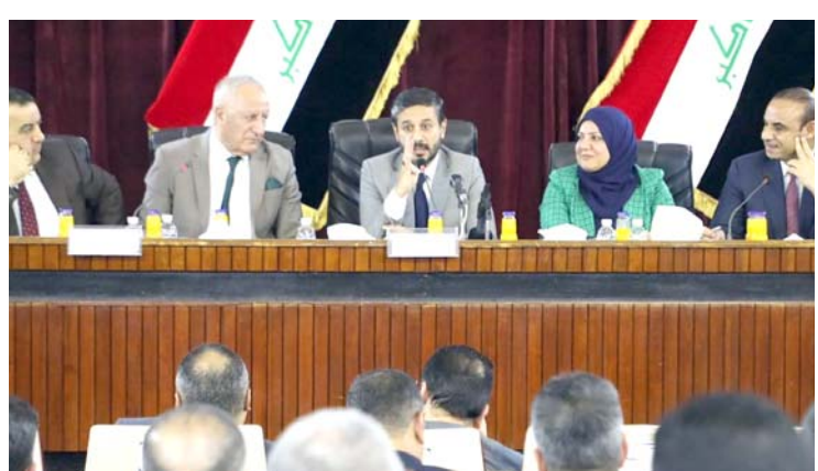
اجتماع: وزير التعليم العالي يراس اجتماعا لهيئة الرأي بحضور عدد من البرلمانيين