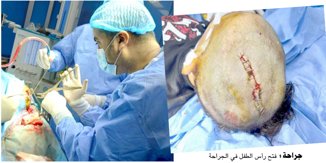
جراحة: فتح رأس الطفل في الجراحة