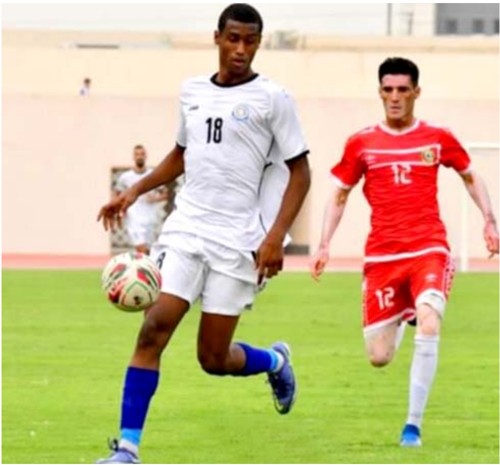
كأس العراق: إحدى مواجهات فريق الميناء في بطولة كأس العراق

الكثير في ان يعكس نفسه في المنافسات من البداية حتى لا تتعطل المهمة التي قد تكون اصعب من الماضي اذا ما لعب بمجموعة قادرة على الدفاع عنه والفريق الذي صال وجال في الممتاز لسنوات وتمتع فيها قبل ان يخفي بسبب ظروف المحافظة الامنية قبل ان يظهر الموسم الماضي لكنه واجه تحديات المنافسة قبل ان يعول على قلب الامور لصالحه هذه المرة وسبق وان لعب بالدوري الممتاز وبقي موسمين قبل ان يتقهقر للدرجة الثانية التي نجح في تداركها الموسم الماضي ليطلع الموسم الحالي في الاولى ويمكن ان يقدم فريق قادر على خوض المنافسة بفضل دعم مؤسساتي للفريق الذي يمتلك ملعب سيخوض مبارياته فيه.