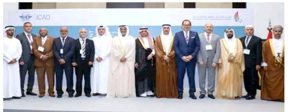
اجتماع: مشاركون في اجتماع اقليم الشرق الاوسط

بغداد - قصي منذر شارك الطيران المدني في الإجماع السادس بإقليم الشرق الأوسط لمنظمة الطيران المدني الدولي الإيكاو المنعقد في مدينة ابو ظبي، بمشاركة 12 دولة في الإقليم وعدد من المنظمات الدولية المعنية بالطيران. وقال بيان تلقته (الزمان) امس ان (الإجماع يعد فرصة لمناقشة مخرجات الإجماع الخامس لمدراء الطيران في الشرق