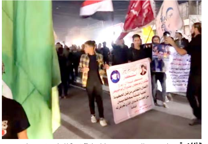
تظاهرة: جانب من تظاهرة ذوي ضحايا حادثة فتحة المجاري في ميسان