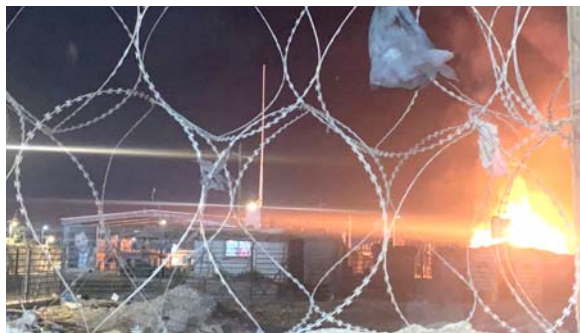
بغداد - قصي منذر

أفاد حرس الحدود العراقي، بيان ضربة جوية نفذتها طائرة مسيرة استهدفت قافلة من شاحنات صهريج محملة بالوقود، قادمة من إيران بعد مرورها عبر العراق وكانت في طريقها إلى لبنان. وقال مصدر ان (22 شاحنة صهريج مرت عبر العراق بعد قدومها من إيران، وكانت في طريقها إلى لبنان)، وأضاف ان (الضربة استهدفت عشر شاحنات بعد دخولها إلى الأراضي السورية)، وأشار إلى ان (أربع شاحنات احترقت تماماً دون الإبلاغ عن غارة، قافلة شاحنات قيل أنها تحمل أسلحة وصهاريج نفط للغايلين في سوريا على الحدود المشتركة مع العراق، مما أدى إلى سقوط 14 قتيلًا كما ذكر المرصد السوري لحقوق الإنسان، ولم تؤكد أي مصادر أخرى حصيلة القتلى، وقال المرصد إن (طيراناً مجهولاً استهدف شاحنات تحمل أسلحة وصهاريج نفط في ريف الموصل)، وأضاف ان (القتل تسبب بسقوط خسائر بشرية