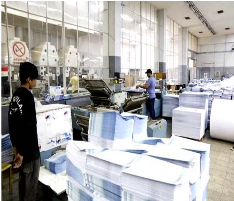
صناعة: احدى المطابع التابعة لوزارة الصناعة