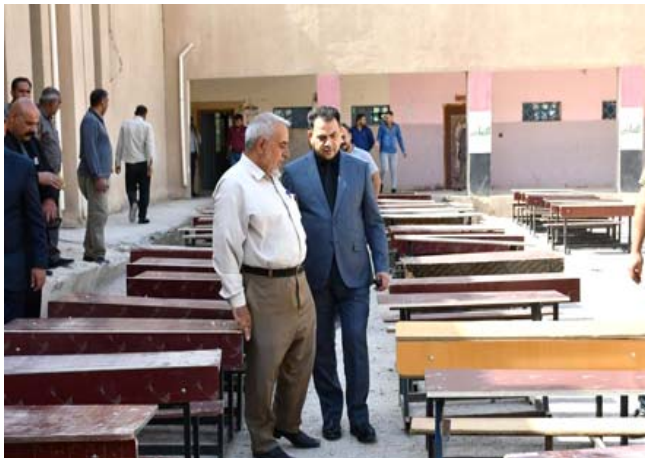
إصلاح : الرحلات الدراسية بعد عملية إصلاحها