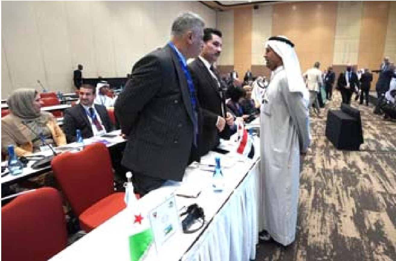
مؤتمراً : نائب رئيس البرلمان خلال مؤتمر البرلمانات الدولي

استمرار تدفقها وبقاء السكان في الأهور، مشيراً إلى ان (المشكلة هي غلاء اعلاف بالجاموس، ويخطب توفير الدعم من قبل وزارة الزراعة، بما يعزّن بقاء السكان).