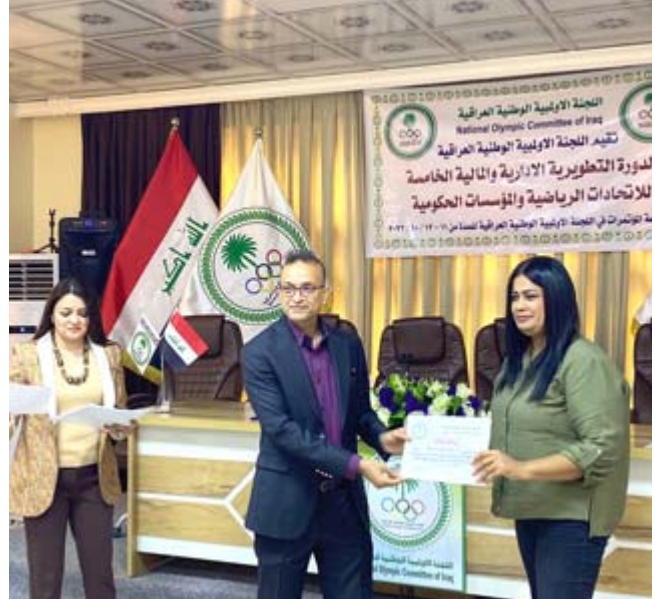
دورات: إحدى الدورات التطويرية القادمة في المجال الرياضي

بالذكر ان المدرب جافيد إبراهيم كان اشرف على تدريب منتخبات الملاكمة العراقية لثلاثة أعوام متتالية لكنه ترك العمل عام 2019 بسبب التظاهرات الشعبية. هذا التدريب لخلق جيل جديد قادر على عودة القبضات العراقية الى سابق عهدها منافساً قوياً عربياً وقارياً. وفي معرض جوابه على سؤال رئيس اتحاد الملاكمة على تكليف اوضح حمودي ان مسألة البنية التحتية هي من اولويات ما تعمل عليه اللجنة الأولبية وان الأشهر القليلة القادمة ستشهد إجراء مفرحاً بهذا الصدد. الجدير