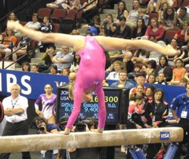
إحدى لاعبات منتخب البرازيل للجمباز

□ ساو باولو- (ا ب ف) - حكّم على مدرب سابق في المنتخب البرازيلي للجمباز بالسجن لأكثر من قرن بتهمة اغتصاب أربع لاعبات، من بينهم قاصرة واحدة على الأقل، وفق ما ذكرت وسائل إعلام محلية الثلاثاء. حكمت محكمة في مدينة ساو برناردو دو كامبو بالقرب من ساو باولو على فرناندو دي كارفاليو لوبيش بالسجن 109 سنوات وثمانية أشهر الأثني، وفقاً لموقع غلوبو إسبورتيفي الذي تمكن من الاطلاع على المحضر الذي تحميه السرية القضائية. وادين بالاعتداء على أربع رياضيات، بينهن قاصرة كانت تبلغ من العمر 13 عاماً في ذلك الوقت، وفقاً لـ غلوبو إسبورتيفي الذي لم يحدد أعمار الرياضيات الأخريات، لا يزال بإمكان كارفاليو على مدرب سابق في المنتخب البرازيلي للجمباز بالسجن لأكثر من قرن بتهمة اغتصاب أربع لاعبات، من بينهم قاصرة واحدة على الأقل، وفق ما ذكرت وسائل إعلام محلية الثلاثاء. حكمت محكمة في مدينة ساو برناردو دو كامبو بالقرب من ساو باولو على فرناندو دي كارفاليو لوبيش بالسجن 109 سنوات وثمانية أشهر الأثني، وفقاً لموقع غلوبو إسبورتيفي الذي تمكن من الاطلاع على المحضر الذي تحميه السرية القضائية. وادين بالاعتداء على أربع رياضيات، بينهن قاصرة كانت تبلغ من العمر 13 عاماً في ذلك الوقت، وفقاً لـ غلوبو إسبورتيفي الذي لم يحدد أعمار الرياضيات الأخريات، لا يزال بإمكان كارفاليو