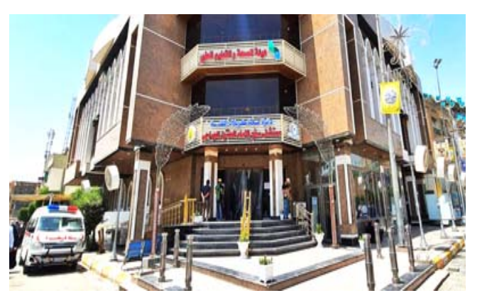
مبنى مستشفى السفير

كشف مدير مستشفى المجر العام رزاق كاظم عداي عن عدد المراجعين لمستشفى المجر خلال شهر أيلول وقال (ل(الزمان) امس ان (المستشفى استقبل 28701 الف مراجع خلال شهر ايلول الماضي قدمت لهم كافة الخدمات الطبية والصحية والعلاجية، مبيناً عدد مراجعي الاستشارة يبلغ 152000 و الطوارئ 13501 مراجع وقدمت لهم كافة الخدمات الطبية والخدمات المخبرية والساندة من الاعمدة والسونار). وأكد (الهيمنة دور ملاكات