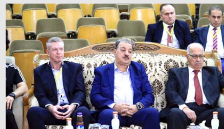
اتحاد: أعضاء اللجنة الاستشارية في اتحاد الكرة