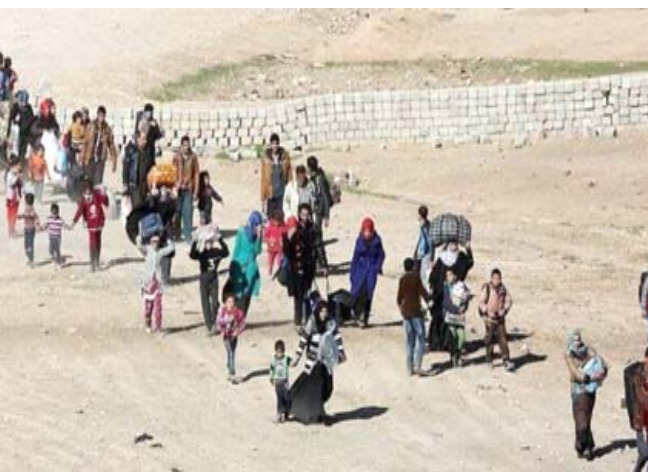
دياره: عوائل مهجرة من ديارها