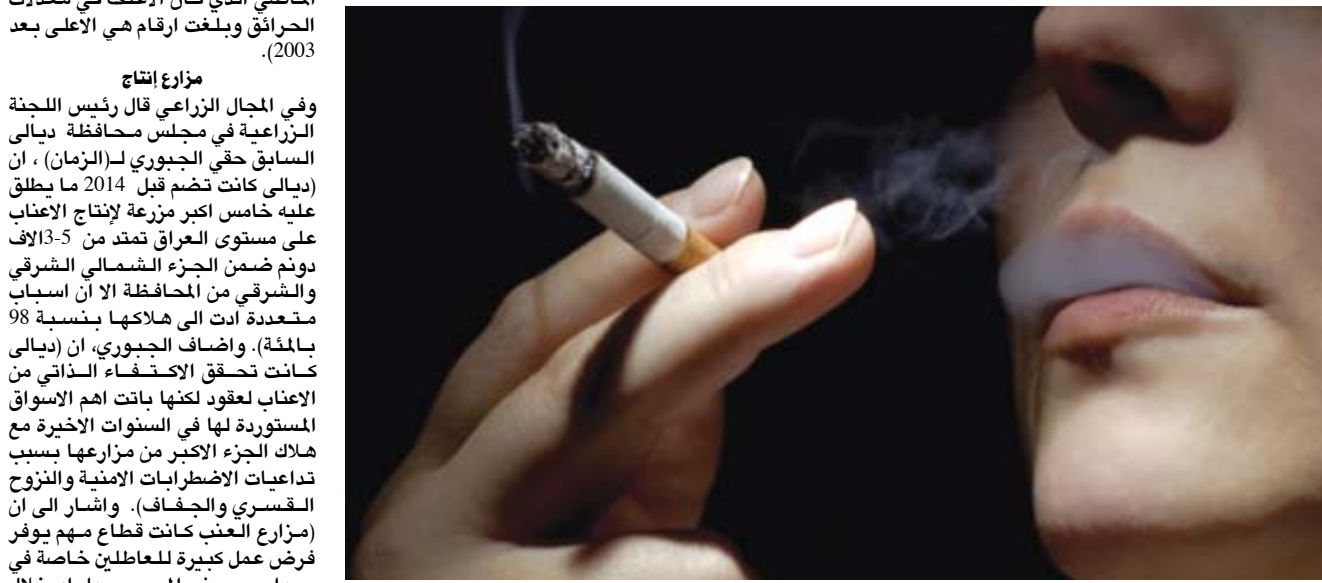
تدخين : ارتفاع نسب المدخات في ديالى