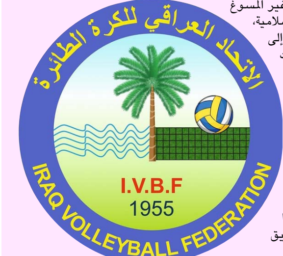
الاتحاد العراقي لكرة الطائرة I.V.B.F 1955

اما الغرامات فهي عادة تعودت عليها اللجنة الأولمبية ، اذ لا تتورع عن دفعها كما حصل في الانسحاب غير المسوغ من دورة التضامن الإسلامية، فالضحايا تحولوا إلى أرقام في نشرات الاخبار المسانحة، والسفارة ماتزال في العمارة! والسفير يزاول أعماله اليومية، والأولمبية الناقصة النصاب تدعي عقد اجتماع طارئ في حين انها بلغت أعضاء مكتبها التنفيذي بقرارها المترجف عن طريق الهاتف!.