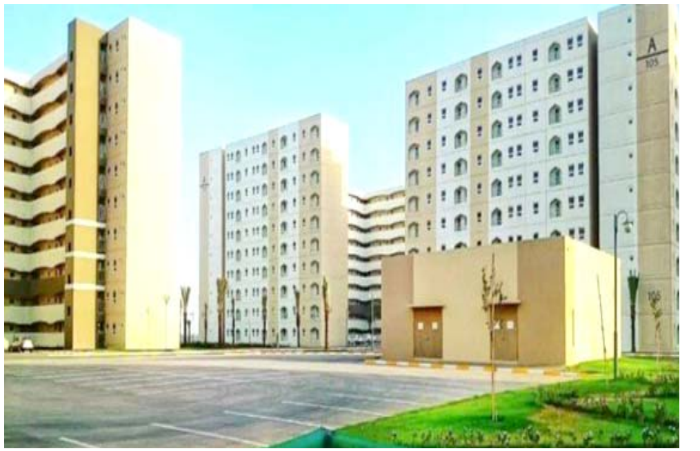
مشروع - جانب من مشروع بسماية السكني

(الزمان) اسس ان (الهيئة طابخت الوزارات والجهات المعنية، بضرورة تفعيل العمل في عدد من البنايات داخل المجمع، منها المراكز الصحية، والمتنديات