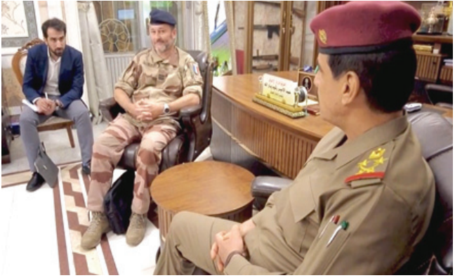
مباحثات: رئيس اركان الجيش خلال مباحثات مع فرنسا

الحفاظات - مراسلو الزمان) ضمن رئيس اركان الجيش الفريق اول قوات خفص البركن عبد الامير رشيد يارالله، دور فرنسا بالوقوف مع العراق في التصدي لعمليات داعش. وتكر بيان لوزارة الدفاع تلقتَه الزمان) امس ان (بارالله استقبل في مكتبه، المحقق العسكري الفرنسي الجديد، والمحقق العسكري السابق في