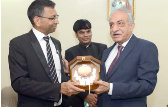
دروع : رئيس تحرير (الزمان) يقدم درعا تكاريا الى السفير الهندي

احتضان جميع الديانات، ومنذ تجري الانتخابات كل خمسة اعوام والجهة المسؤولة لتسهيل وتنظيم هذه العملية الجارية في العراق. ومنذ تجري الانتخابات كل خمسة اعوام والجهة المسؤولة لتسهيل وتنظيم هذه العملية الجارية في العراق. ومنذ تجري الانتخابات كل خمسة اعوام والجهة المسؤولة لتسهيل وتنظيم هذه العملية الجارية في العراق.