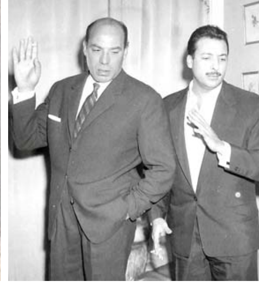
مسيرة: لقطات من مسيرة وحش الشاشة فريد شوقي الفنية