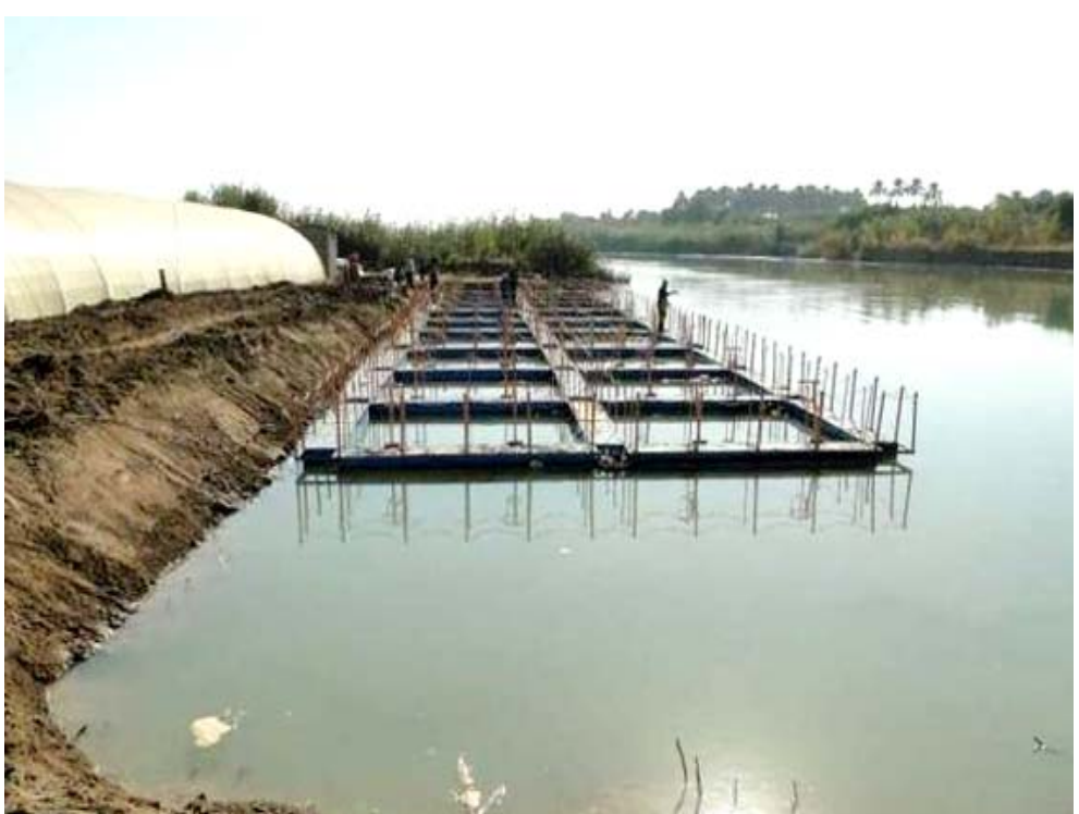
بحيرة - إحدى بحيرات الاسماك في ديالى

وفي الواقع الفلاحي قال رئيس اتحاد الجمعيات الفلاحية في ديالى رعد التميمي لـ ( الزمان ) ، ان (اسعار الفاكهة في ديالى ارتفعت خلال الموسم الحالي) (المشروع يهدف لإنهاء ميذا عسكرية المدن وإعطاء رسائل اطمئنان للبراي العام حول الأجزاء الأمنية) .