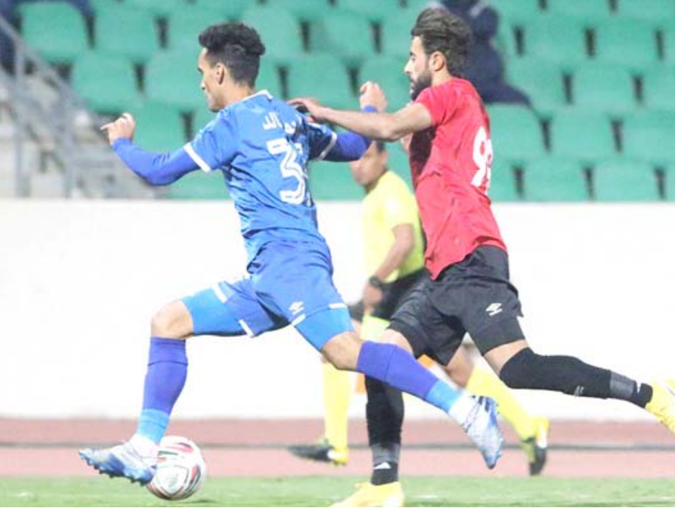
دوري: إحدى مواجهات فريق الميناء في الدوري الممتاز المنصرم

البصرة يحمل اليوم المشاعر السلبية عن مستوى الفريق وترك المقعد الممتاز ولم يتوقعوا أن تذهب الأمور الى هذه النهاية والوزن المشتعل في قلوبهم ولا يمكن هنا الإشارة الى اي لاعب ولاحد المدرب الخمسة والإدارة والكل شاركوا في الضحية والمشكلة التي تكبر يوم بعد يوم لانه الميناء ومن يدري ويعلم كيف يتحضر الفريق ويدخل الموسم القادم بعدما انتقل الى صفوف الدرجة الأولى لانتظر.