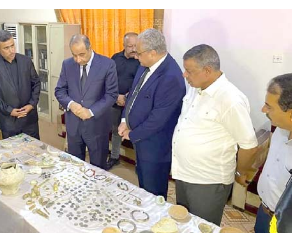
كنز : وزير الثقافة يطلع على كنز أثري اكتشف في تل أسود

الاثري من أجل اكتشاف المزيد من التطور العمراني والبنائي والزجاج عن مليونين، وأضاف ان عصر سومر واكد ويابل واشور من الكسر الفخارية ضمن طبقات الدفن منها المزعج الذي اتصف بجودة الصناعة والوانه الازرق والبنفسجي، وفيه ومنها ذات بريق معدني، وهذه دلائل تعود الى العصر العباسي المتأخر، ومضى الى القول ان (هيئته الآثار والتراث ماضية في تحفيز خططها العملية في حقل التنقيب