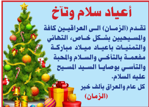
أعياد سلام وتآخ

المستمر الذي تلقاه فلسطين من القيادة العراقية. وقال ان (ارسال العراق الى غزة باخرة مساعدات تحمل عشرة ملايين لتر مشتقات بترول اهمها زيت الغاز الذي تم اعلان الحاجة له بالتنسيق بين الهلال الاحمر الفلسطيني والهلال الاحمر العراقي، يؤكد على اهتمام العراق الشقيق على إيقاف العدوان ورفع الحصار وادخال المساعدات وإنهاء معاناة الشعب الفلسطيني). واستشهد أكثر من 200 فلسطيني خلال الاربعة والعشرين ساعة الماضية جراء قصف الجيش الإسرائيلي المستمر وعملياته البرية في غزة، عدادة صدور قرار من مجلس الأمن الدولي يدعو إلى زيادة المساعدات الإنسانية لكنه لا ينص على وقف إطلاق النار. وبعد نحو ثلاثة اشهر من بدء الحرب بين