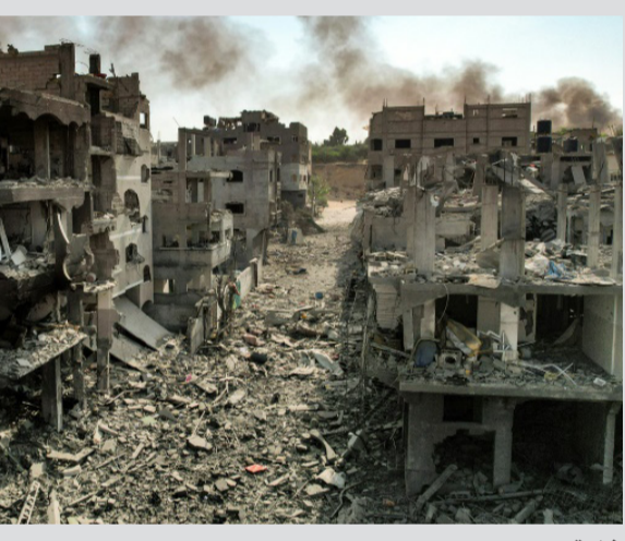
غارة؛ مشهد من الجو لجنابتي غارات جوية إسرائيلية في مخيم جباليا للاجئين في قطاع غزة

عدة مناطق من شمال القطاع إلى جنوبيه، من بينها مخيم النصارى للاجئين (وسط) حيث أسفرت غارة ليلية عن مقتل 18 شخصا. وفي مدينة خان يونس الكبيرة جنوب غزة حيث تصاعدت أعداد الدخان بعد القصف، تم نقل الجثث والجرحى إلى مستشفى ناصر. وحمل رجال امرأة نكي بعد رؤية جثث أحيائها، فيما شوهد رجل يبكي ويضع يده على جثة مكفنة، وفي الخارج أقام آخرون صلاة الجنازة أمام جثمان واتهم المتحدث باسم وزارة الصحة في القطاع أشرف القدرة امس السبت القوات الإسرائيلية بارتكاب عدة "مجازر بشعة" هذا الاسبوع "أسفرت عن سقوط عشرات الشهداء في مخيم جباليا ومنطقة تل الزعتر وفي بلدة جباليا".