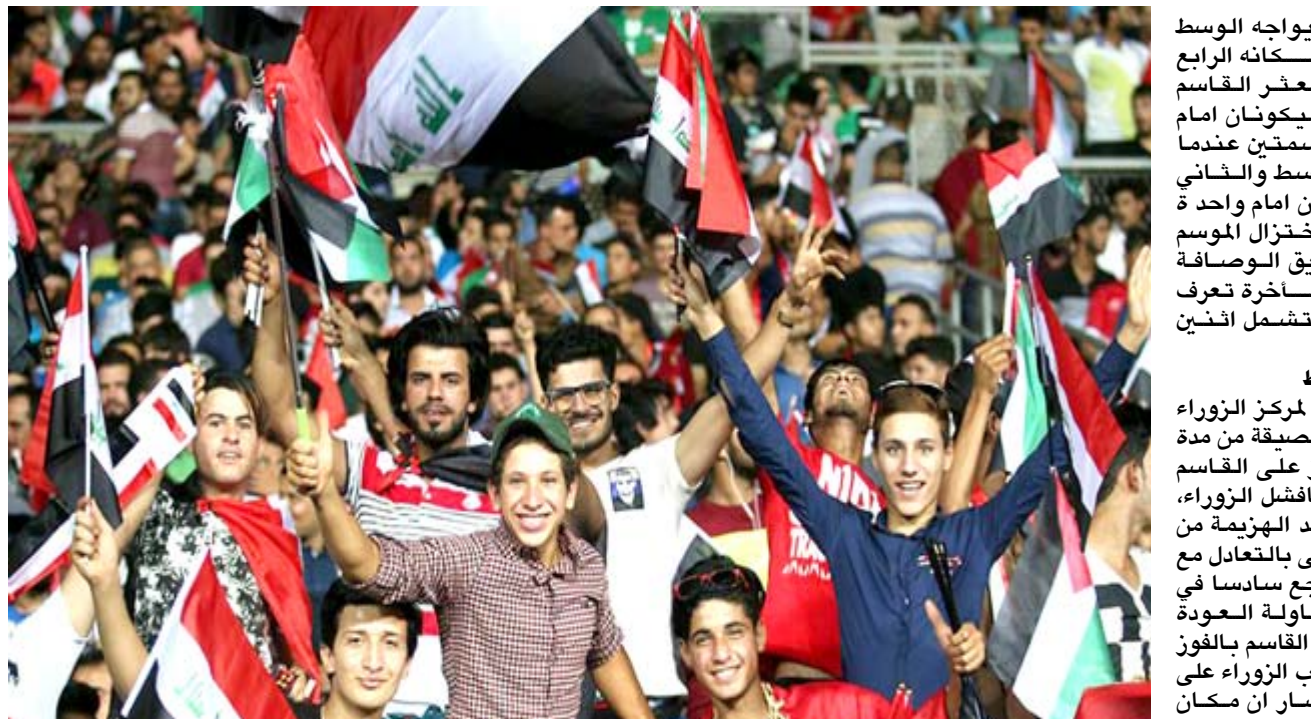
جمهور: مطالبات جماهيرية بنبذ العنف ونشر الروح الرياضية

بثقة في اول مشاركة له نجح فيها وبامتياز وكان اكثر الفرق استفادة من لعائنات الارض بدون خسارة في المرحلة الثانية بالفوز على اربيل والتواجد في المركز الجيد الثامن بعدما تحمل الاعبين المهمة كما يجب وكل ما آزاده اربيل البقاء موسم جديد في البطولة بعدما مشاركة متباينة وان بلغ الاستقرار لكنه سرعان ما يتراجع. الموقع السابع وحقق النجف الموقع الجيد السابع رغم هزراذ نتائجها الاخيرة ومر الفريق في فترات صعبة فبعت الادارة بتغيير حيدر عوفي لكنه انتهى المشاركة كما يجب بعد تعادله مع الشرطة وتوزعت