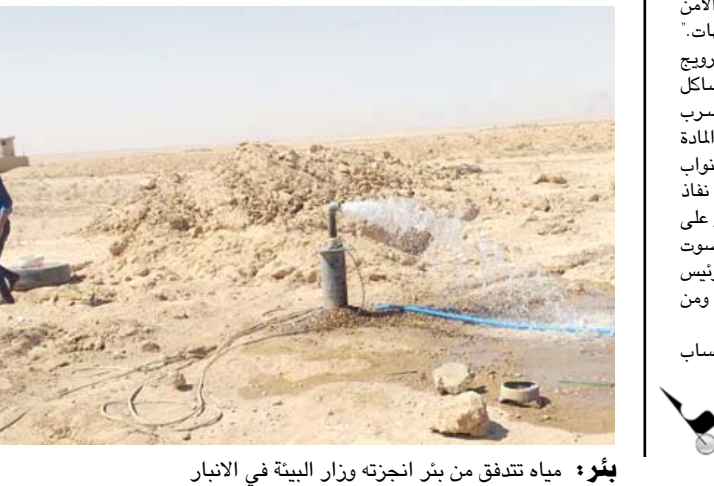
مياه تتدفق من بئر انجزته وزار البيئة في الانبار

بغداد - ابتهاج العربي أكدت وزارة البيئة دعم الأنشطة والجهود التي تشجع على استخدام الطاقات المتجددة. وقال بيان تلقته (الزمان) إن (الوزارة شاركت في إفتتاح