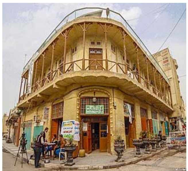
شارع : مقهى الشايندر في شارع المتنبي