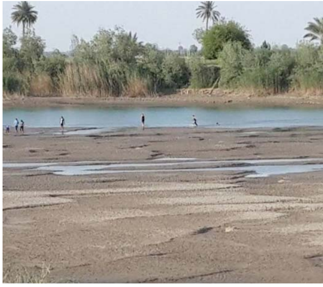
جفاف : نهر ديالى وقد ضربته الجفاف

(3رسائل عاجلة وجهت الى بغداد بالسرزها دعم حوض السوفك ميدانيا على ازمة الجفاف الحادة بالصهاريج لنقل المياه وزيادة خطة حفر الابار ومعالجة التجاوزات واطلاق خطة لكري وتطهير الأنهر والجداول الزراعية لخلق مرونة في