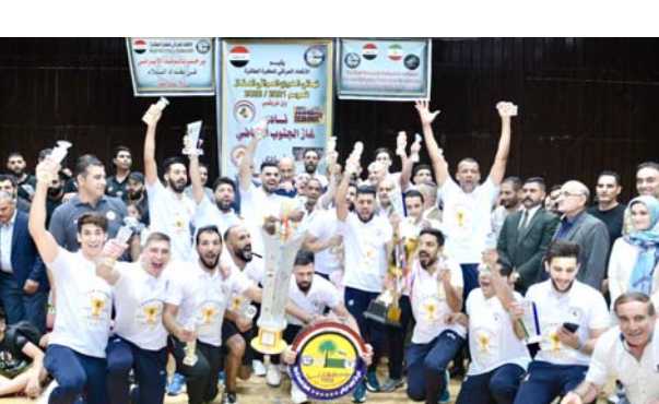
إيران يتقله المنتخب في

بغداد- الزمان توج فريق نادي غاز الجنوب، يوم الاثنين، بلقب دوري الطائرة الممتاز للناشئين 2022 بعد تغلبه على الجيش بثلاثة أشواط دون مقابل بواقع 25-21 و25-25 و25-8. وأقام الاتحاد العراقي للكرة الطائرة حفل ختام دوري الطائرة الممتاز مساء اليوم الاثنين على قاعة الصالات، إلى العاصمة الإيرانية