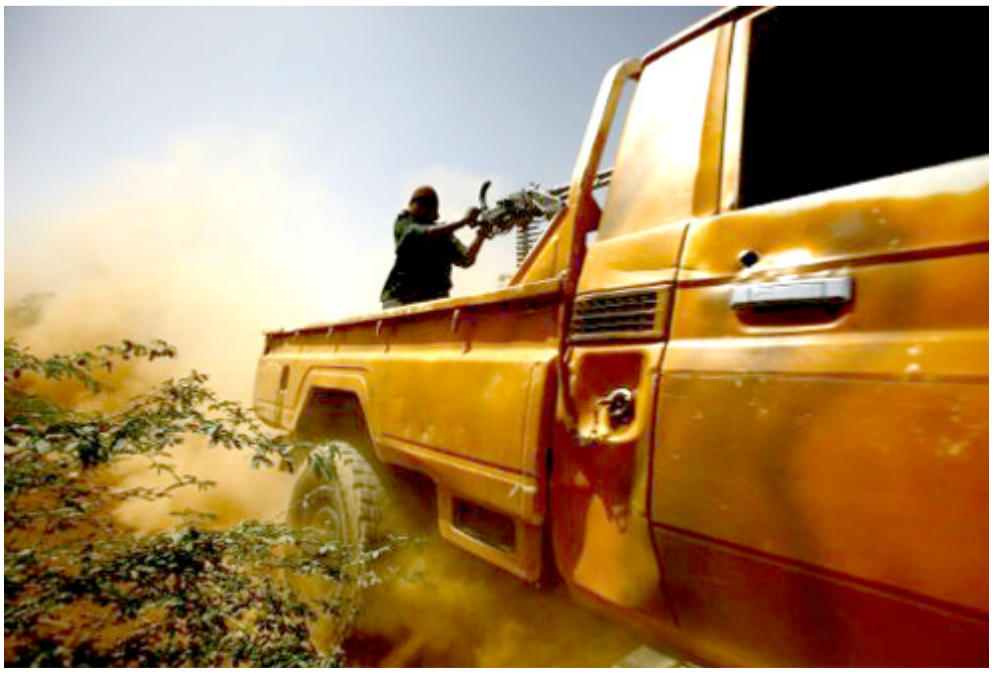
مسلحون على الحدود السودانية يواجهون الشرطة الحكومية

بغداد، (أ ف ب) - رجب العبيد من الأكراد العراقيين بالإعلان الأسبوع الماضي عن إجراء استفتاء على استقلال الإقليم في 14 آب/سبتمبر المقبل، لكن عوائق كثيرة تدفع في طريق إقامة الدولة بعد التصويت المتوقع من تعيم ولا يزال الإقليم الذي يتبع حكم ذاتي في حالة حرب مع تنظيم داعش، ويستضيف أكثر من مليون نازح كما أن اقتصاده الذي كان