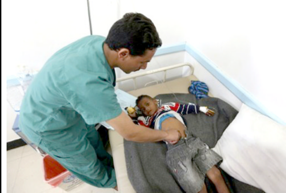
أصابة : طبيب يعالج طفلاً مريضاً مصاباً بالكوليرا