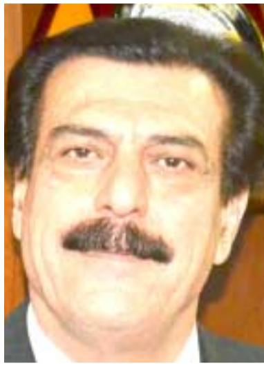
نيزاري معماري أوغلو

بغداد - (ا ف ب) - دبليو . سلام عبد الحمدي تهدت منظمة أمناء الأطفال (سيف ذا تشيلدرن) غير الحكومية البريطانية أمس إلى أن نحو 350 ألف طفل عالقون في القسم الغربي من مدينة الموصل داعية القوات العراقية وحلفائها إلى (بذل كل ما يسوعهم لحماية) وشدد مدير مكتب المنظمة في العراق ماوريتسيو كريفاليريو على (وجوب إقامة مرعات آمنة بأسرع ما يمكن لإجلاء المدنيين). في وقت باشرت القوات العراقية الأحد العمليات العسكرية لاستعادة غرب الموصل من تنظيم داعش بعدما استعادت السيطرة على الشطر الشرقي من المدينة. وكانت منسفة الأمم المتحدة للشؤون الإنسانية في العراق، ليز غراندي قد رجحت أن تسبب عمليات استعادة الساحل الآمن للموصل بنزوح نحو 400 ألف مدني، مؤكدة أن الأمم المتحدة بحثت العديد من الخيارات لضمان وصول الغذاء والدواء والماء إلى 800 ألف مدني يعيشون في الأحياء الغربية من الموصل، واتي التحالف الدولي الذي تقوده الولايات المتحدة ضد المسلحين الأعداء، على دور جميع القوات المشاركة في معركة الموصل من ضمنها الفصائل العراقية التي يتلقى بعضها دعما من إيران، واتي التحالف الجنرال ستيفن تاونسن في بيان، أن (التحالف كامله يرحب ويدعو الله أن يحصي الجنود والشجعان ورجال الشرطة والجماعات المسلحة العراقية، الذين يقاتلون اليوم من