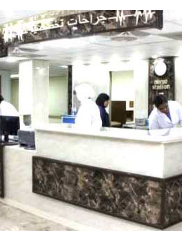
جناح - صورة يظهر فيها جناح خاص لاحدى مستشفيات بغداد.