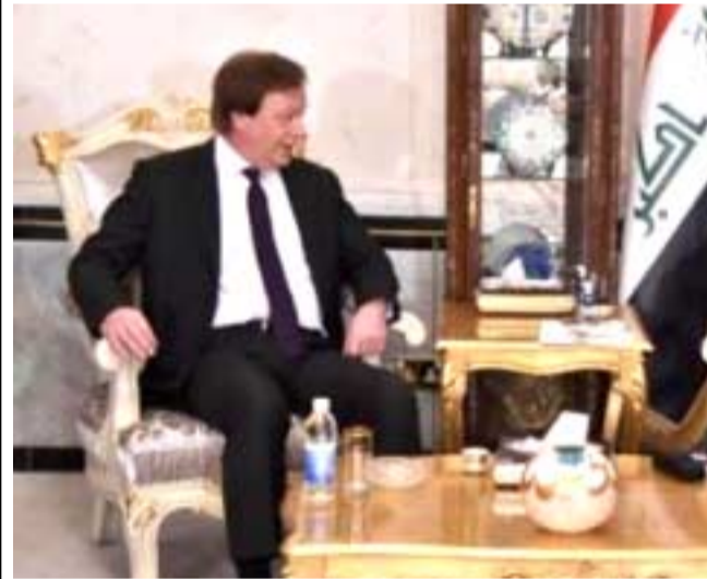
لقاء جانب لقاء الجعفري بالسفير البريطاني امس.

وإضافت ان (ساتيس أكد أنه لا يزال هناك هدفا أساسيا يتمثل في الاستعادة الكلية ليس فقط لمدينة الموصل ولكن بعد ذلك مدينة الرقة السورية أيضاً)، واوضحت بيوتني ان (التحالف يعمل بشكل جيد، حيث يحقق نجاحات عسكرية على الأرض في العراق، وبالتزامن مع عملية تحرير المدن من داعش، فمن الضروري ان يكون هناك تدريب للشرطة المحلية لضمان تجنب وقوع أحداث عنف في تلك المناطق)، وتابعت (العضء الأكثر أهمية وإيجابية هو الاستمرار في نفس استراتيجية التي تبنيها من خلال ائتلاف واسع بين الناتو والدول الأوروبية، والعديد من البلدان الإسلامية)، وأضافت بيوتني ان (حلف شمال الأطلسي استعد، خلال الاجتماع ليكون حاضراً في العراق من خلال أنشطة التدريب الجيش المحلي)، ويذكر ان (