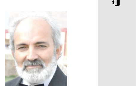
بدل رفو النمسا

يقام المعرض السنوي هذا العام في القصر من 22 أبريل ولغاية 26 أكتوبر وهو معرض نادر وتحت عنوان: الحيوان والاساطير والأساطير والمخوفات والحقائق. معرض هذا العام فريد من نوعه ويعرض العلاقة ما بين الإنسان والحيوانات عبر النيند الفريد من نوعه في القصر وكذلك يضم ملسماً رائعاً وندفقا يجذب الآلاف من الزوار سؤياً إلى الأقليم لكونه من المعالم التاريخية وارث الإمبراطورية الهابسبوركية. بعد القصر نقطة التقاء واحاديث واجتماعات التاريخ الماضي والحاضر وتنوع الثقافات والفنون بين جدران القصر.