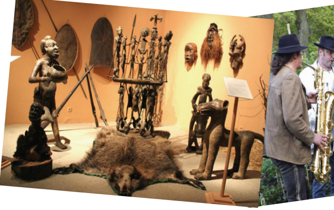
مشاهد من قصر هالب تورن