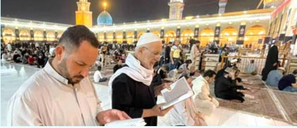
مشاهد من مسجد الكوفة في العشر الاواخر من رمضان