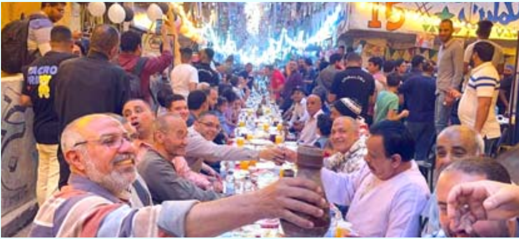
مائدة رمضانية في حي المطرية بالعاصمة المصرية القاهرة