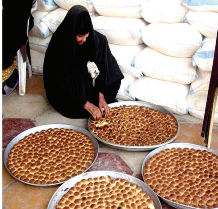
كلية؛ صواني الكلية بعد خروجها من الفرن واطفال في اسواق الملابس