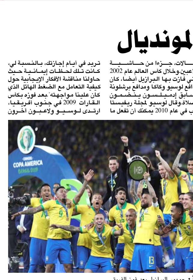
فوز: جمهور البرازيل بعد فوز الفريق

فندق الفريق دون علم المدرب بونغا وكخب النفس على وسائل التواصل الاجتماعي اليوم كانت النساء تحتفل خلال لقاءنا لـ 3 أزواج قبلت يسوع المسيح واتخذت القرار الصحيح. وكان من بين الحاضرين ثنائي ليفرپول اليسون بيكر وفابيانو ومدافع تشيلسي السابق وأرنستل ديفيد لويز ولوكاس سورا لاعب توتنهام. ولم يزدجر الإنجلييون في كرة القدم فقط من حيث العدد والقوة في البرازيل، بل أيضاً في السياسة. فقد فاز الرئيس اليميني المتطرف جايير بولسونارو في انتخابات 2018 بدعم ما يقرب من 70 في المئة من المجتمع الإنجليي، بما في ذلك نجوم كرة القدم مثل نيمار وريفالو. وتعد بولسونارو، الذي ولد لعائلة كاثوليكية وأعيد تعميده لاحقاً في نهر الأرن على يد كنس إنجليي، بتعيين قاضٍ في المحكمة العليا كان البرازيل على يد هولندا في ربع النهائي، كانت هناك ادعاءات بأنه تم استدعاء ممثل أداء ذو خبرة طويلة شخص لديه "خبرة إنجيلية أكثر. تم طرد بضع سنوات في عام 2015 ثم طرد رئيس الأمن من قبل الاتحاد البرازيلي للسماح بإقامة صلاة إنجيلية داخل