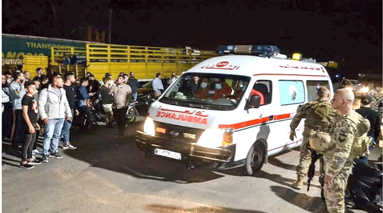
عربة إسعاف تقل ناجين من قارب غرق قبالة سواحل طرابلس

بحذر فيها من أنه غرق في المياه الشديدة البرودة قبالة الساحل الليبي الشرقي لليبان، وقال المركب السياحي الذي كان يقبل 24 راكبا بينهم طفلان واثنان من أفراد الطاقم، إن المياه غمرت القوس، وأرسلت قوة خفر السواحل سبعة قوارب وخمس طائرات للمشاركة في عملية البحث والإنقاذ، وانضمت إليها مروحيات الشرطة والجيش إضافة إلى قوارب صيد محلية. وتعد شبه جزيرة شيرينوكو أحد مواقع التراث العالمي التي اعتمدها اليونسكو في العام 2005 وهي معروفة بحياتها البرية الفريدة، بما في ذلك أسود البحر المهددة بالانقراض والطيور المهاجرة والديسة البنية، وتشتهر رحلات القوارب التي يامل ركابها في رؤية الحيتان والطيور وغيرها من الحيوانات البرية، فضلاً عن الجليد الطافي في الشتاء وما زالت حدود اليابان مغلقة أمام السياح بسبب قيود كوفيد، لذا فإن مشاهدة المعالم السياحية في البلاد تقتصر على السكان والمواطنين اليابانيين، وذكرت وسائل إعلام محلية ان درجة حرارة المياه في المنطقة السبت راوحت بين درجتين وثلاث درجات مئوية، وأن بعض قوارب الصيد عادت إلى الميناء مبكراً بسبب ارتفاع الأمواج والرياح العاتية، وكان المركب المنكوب جنح في مياه ضحلة في جزيران/بونينو العام الماضي وعلى متنه 21 راكبا، واثنان من أفراد الطاقم، بحسب وسائل إعلام يابانية.