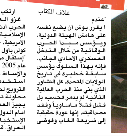
عمر عقيدم لولاك التي حرّضت الهجوم على العراق جون بولتون

بعد هذه التهم، سنذكر إن كيف اعترف مُتهمو العراق بـ (الخطأ)، وبفداخة الجرم المُرتكب، وادعو القراء وطالب الجامعات والدارسين والمتابعة الدائمة وقراءة ودراسة كل ما يمسبغ على