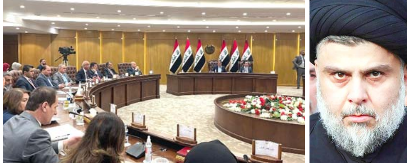
مقتدى الصدر / تضييف: البرلمان في جلسة تشييف

نقط ميسان؛ الانتاجية من حقول ميسان بالتعاون مع الشركات الاجنبية جاء ذلك خلال زيارة مواقع العمل ومحطات عزل الغاز في حقل البرزكان النقطي وعدداً من المواقع النفطية التابعة لحقول ميسان ( البرزكان ، والفكة ، و ابو غرب )، وجرى جولة ميدانية بين اروقها والتقى الكوادر الهندسية والفنية من