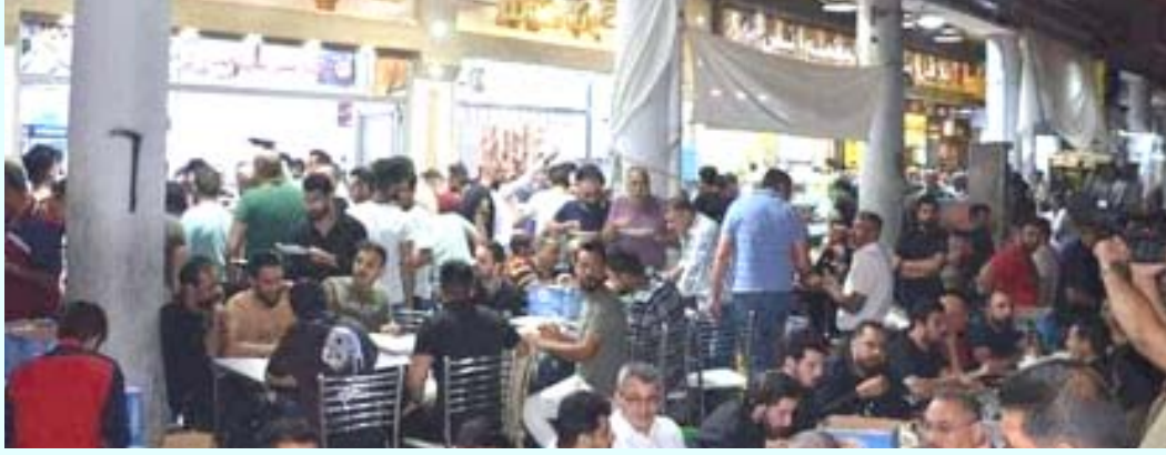
المنات من اهالي بغداد يتناولون سحورهم في منطقة الصدرية