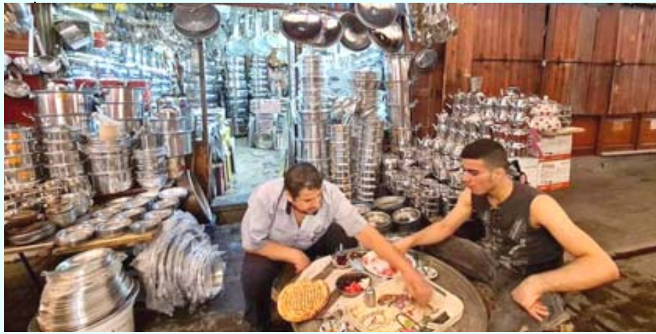
عمال في احد المحال باسطنبول في تركيا يتناولون افطارهم