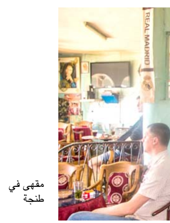
مقهى في طنجة

تجلس رومي شنايدر على اريكة مصنوعة بعناية بطريقة الأرابيسك