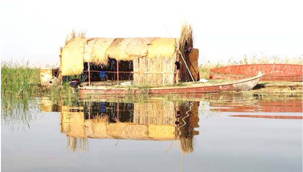
صريفية في الجباش

وهو يقول لرفاقه الذي تسابقوا على شرف الحصول عليها ؛ إنها أمانة الله ورسوله ولا يعطيتها لأحد إلا لاستئذان حين يعود بسلامة من محنته اسبوع فضاضها المعلم في امن القضاء ، واكثر من شهر في مديرية امن الناصرية . وفي كل فصل مناطق الأيواء العلوية فواد وسيد يوسيع والخضر حي الدارين ان صاحبة الصورة ليست روزا لوكسمبورج بل هي الممثلة الألمانية رومي شنايدر لكن لا كاتب التقدير ولا مسؤول المنظمة الحزبية ولا ضابط التحقيق لا حتى مدير امن المحافظة يعرف من هي رومي شنايدر أو روزا لكسمبورج .