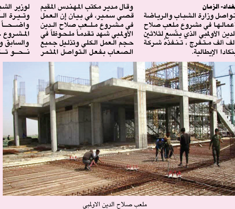
ملعب صلاح الدين الأولي

بغداد - الزمان تواصل وزارة الشباب والرياضة أعمالها في مشروع ملعب صلاح الدين الأولي الذي يتسع لثلاثين ألف متفرج ، مستفذة شركة بنكادا الإيطالية. وأكد البيان أهمية تعديل نظام الدوري و رعاية الأندية الجماهيرية لارتقاء جاداتها الإداري والتسريكيين على تطوير وتحديث معلومات المدرب العراقي، لاسيما المتميزين والشباب منهم عبر مناقشة واقع الكرة العراقية والإستراتيجية المستقبلية، وفق بيان رسمي. وتنوقش خلال الإجتماع بحسب البيان، أبرز التوصيات التي وضعتها اللجنة في الإجتماعين السابقين للنهوض بواقع كرة القدم العراقية وتمثلت بتخصيص ميزانية مستقلة لرعاية الفئات العمرية كونها الأساس لبناء كرة قدم حقيقية عبر وضع إستراتيجية بعيدة المدى. وشدد المجتمعون على ضرورة أن يكون مربو هذه الفئات من الخبراء الأجانب وحملة الشنهادة الاسيوية (A) واصحاب الخبرة في التعامل مع الاعمار ومن يهتمون بسمعة حسنة في المجتمع الرياضي. وتضمن محور النقاش الثاني، وفقاً للبيان التنسيق مع وزارة