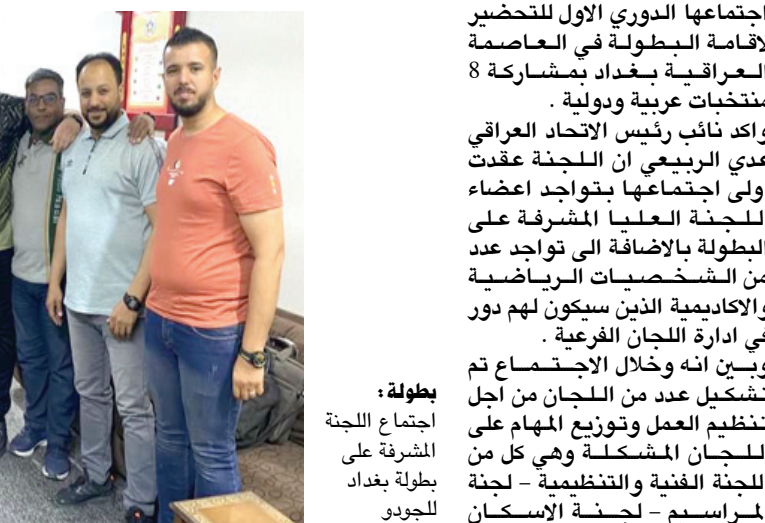
بطولة: إجتماع اللجنة المشرفة على بطولة بغداد للحدود