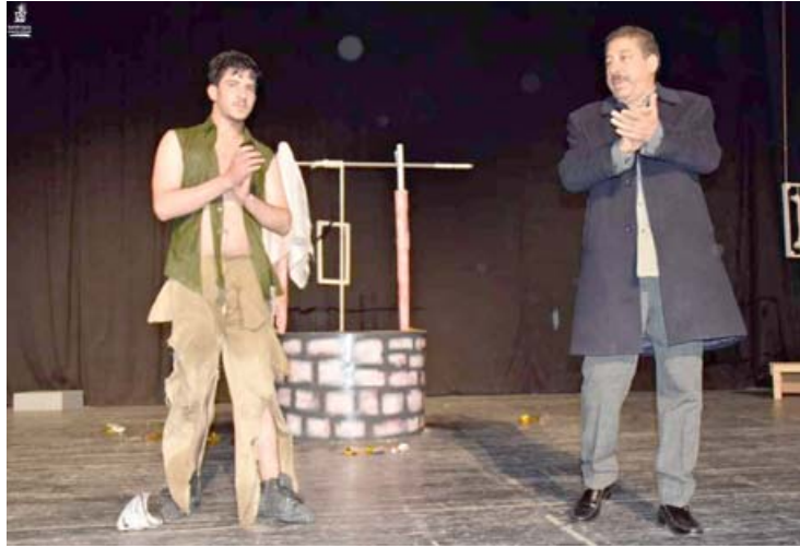
مسرحية: لقطات من مسرحية (سهيل) للمسرح الجاد في الفلوجة