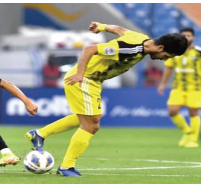
خسارة: نادي الفقة الجوية يخسر مباراته امام مومباي في التصفيات الاسوية

في الفترة الاخيرة ولم يقدر على تفادي الاصور التي زادت من مشكلة المشاركة التي تسير عكس رغبة الإدارة وعصام الحمد المطالب بتغيير احوال الفريق الذي يقف امام حملة الدفاع عن البقاء للابتعاد عن منطقة الهبوط. سامراء والكرخ ويستقبل المتذلل سامراء الكرخ ويامل في تحقيق النتيجة المعنوية بعد 18 خسارة زادت الامور تعقيدا وقد يكون الصحية الاولى اذا لم يتمكن من ايقاف نرغ النسيقات في مشاركة ابتعد عنها منذ البداية واستمر متدهورا من جولة لآخري في وقت يامل الكرخ ان تتعثر الامانة امام الصناعة من اجل ازاحتها من مكانه عندما يخرج لمو اجهة المتذلل سامراء واستغلال حالة الضعف والتفكك التي يمر بها اصحاب الارض لخفض كامل النسيقات على امل مواجهة الاصور ولو من بعيد ولدعم مهمة الخروج في هذه الاوقات قبل ان تتعقد الامور بعد اكثر امام السعد التنازلي للدوري. مباريات الخميس وتواصل مباريات الجولة 27 غد الخميس عندما تقام ثلاث مواجهات وفيها يامل الديوانية تحقيق النتيجة الايجابية الثانية تواليا عندما يضيف النفط المحبط من خسارتين ومتوقع ان يواجه صعوبات بعد تالف المضيف في زاخو ويتطلع القاسم العودة لسكة الانتصارات عندما يستقبل الهناء المرهق جدا لكنه يامل ان يقدم ما يوسع الاستفادة من آخر المو اجهات ويسعى الطلاب للختار من خسارة الذهب في زاخو وتعويض تعادلهم الاخير في البصرة ومحاولة تجنب النتيجة السلبية التي يخطط لها زاخو