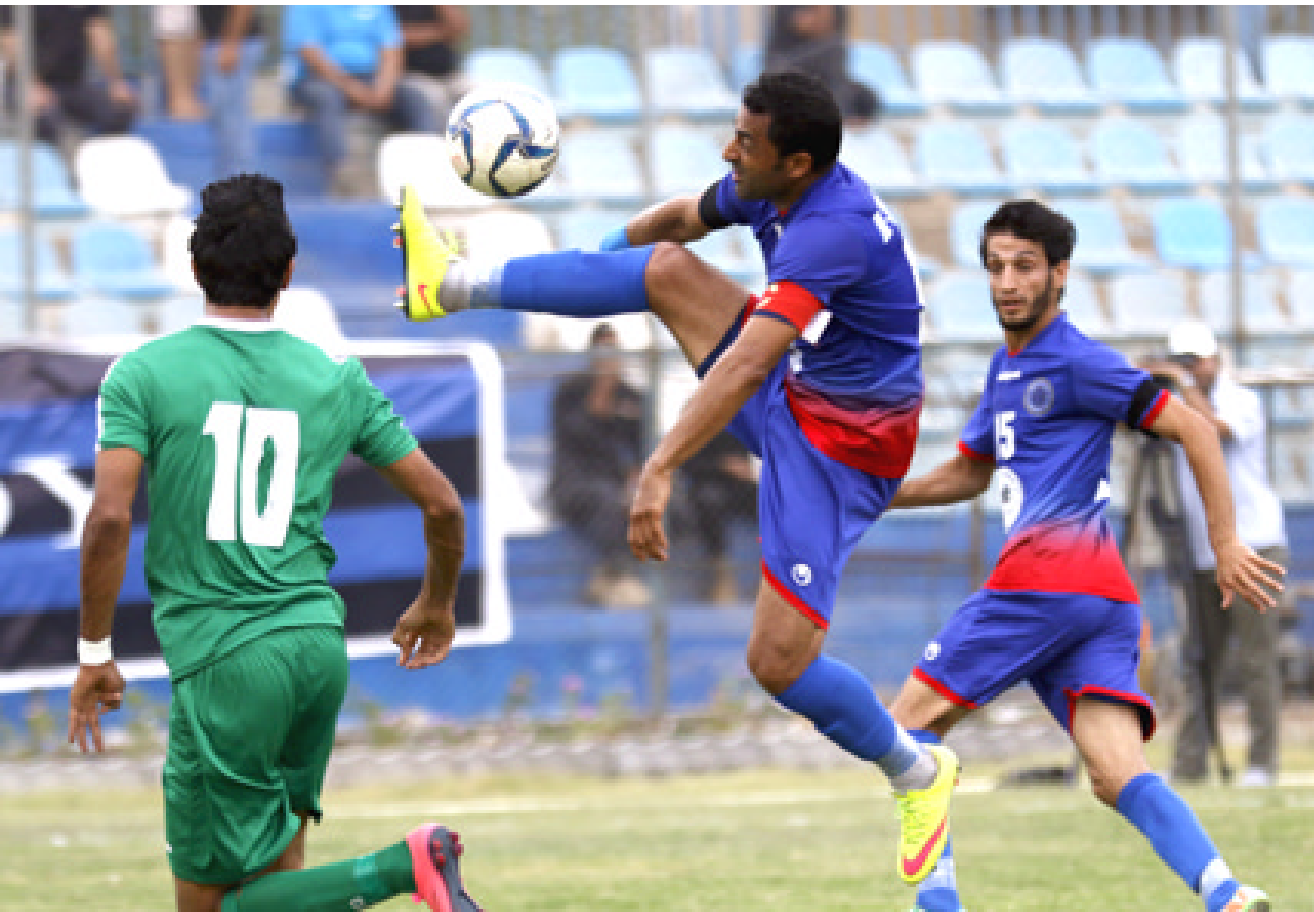
حديث: الدوري الممتاز حديث الشارع الرياضي