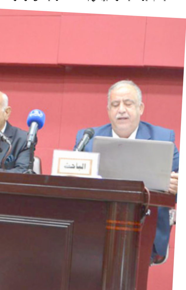
مؤتمر: جانب من المؤتمر الذي عقده بيت الحكمة

تفاصيل هذا الابتاس والى ان جميع من بحث في هذا الموضوع قد توصلوا الى ان الاصولية نزعاً مركبة " فسياسة مجتمعية " ذات اهداف سياسية يمكن ان تقع فيها كل العقائد لتتحول الى ايديولوجيات اقصائية " روجيه جارودي " ويؤكد على ان مواجهتها " يجب ان لا تقتصر على العنصر الأمني وإنما برؤية استراتيجية شاملة مستقلة " لمواجهة خطاب التطرف ومشكلاته واتلاها كيمي من الخاضات المستهلكة " . كما اعلن ملا حسن ، عن تعليمات تشغل المولدات الاهلية المجازة وغير المجازة لشهر مايس ، حيث تم تحديد سعر الامبير بـ 1750