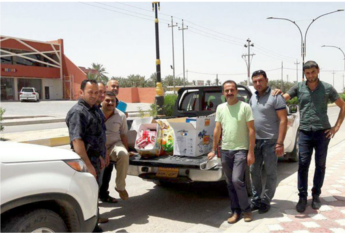
ضبط مواد: قوات أمنية أثناء ضبطها شحنة فاسدة من المواد الغذائية

اجل تقليل الضغط الكبير على البلدية في ملف النظافة من خلال اعطاء دور اكبر للمواطن في مساعدتها عبر الالتزام بالانظمة والارشادات خاصة فيما يخص رمي النفايات في اسماكتها والحفاظ على جمالية البيئة العامة . واكد قائممقام قضاء يعقوبية ، ان الحملة والتي هي الاكبر من نوعها لتوعية المواطنين بالنظافة وسبل التعاون مع مقارن البلدية بالتنسيق مع المنظمات المدنية للمواطن في مساعدتها عبر الالتزام بالانظمة والارشادات خاصة فيما يخص رمي النفايات في اسماكتها والحفاظ على جمالية البيئة العامة . واكد قائممقام قضاء يعقوبية ، ان الحملة والتي هي الاكبر من نوعها لتوعية المواطنين بالنظافة وسبل التعاون مع مقارن البلدية في رمي النفايات في الاساكن المحددة لها وتجاوز الحالات السلبية . واضاف الحيايلى ، ان الحملة والتي تعد نتاج تعاون مع المنظمات المدنية جاءت من