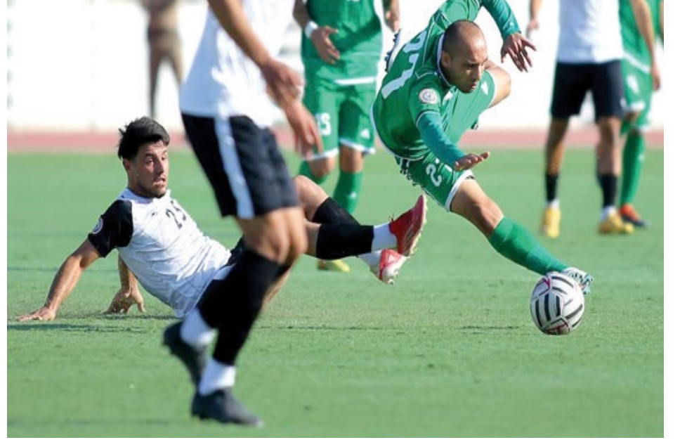
احدى مواجهات الدوري الممتاز

الديوانية وميسان ولزال الديوانية لم يستفد من ميدانه وجمهوره الواسع في تغير واقع النتائج بفوز يتيم لالن وسيكون تحت ضغط محببه عند موجة نفض ميسان المتراجع كثيراً ووضع حد لمسلسل الهزائم الثمانية باربع نقاط في الموقع ما قبل الاخير وكان الضيوف قد تعرضوا للخسارة في عمر الدار امام النجف والسادسة في الدوري ما انار غضب اهل العاصمة قسب ان