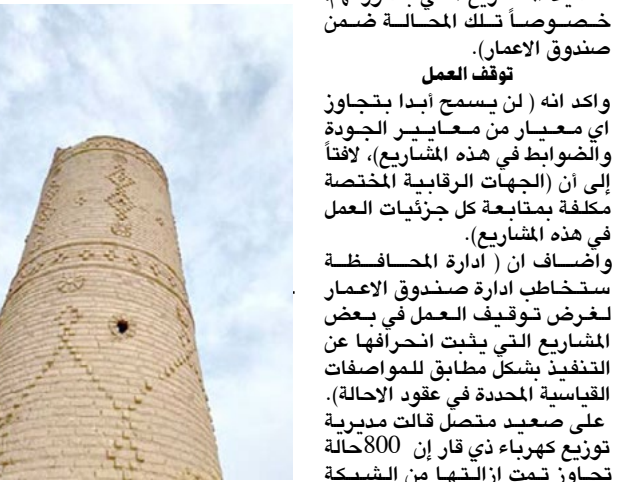
آثار : ابنة اثرية من بقايا امارة الخميسية في الناصرية