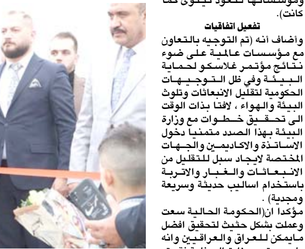
افتتاح : وزير الصناعة خلال افتتاح احد المشاريع في معاينة السمنت الشمالية