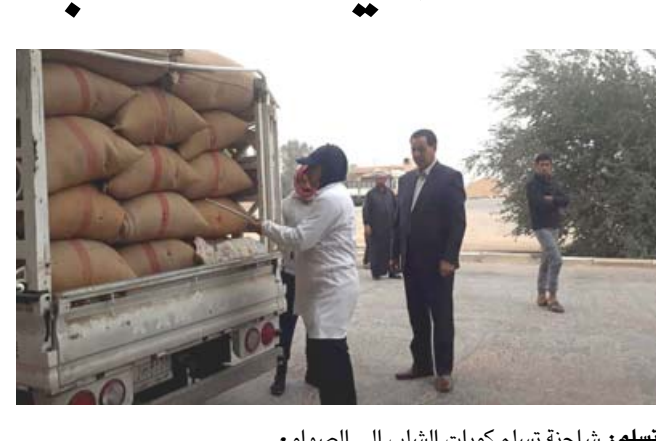
تسلم: شاحنة تسلم كميات الشلب الى الصوامع