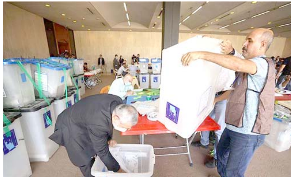
فرز: جانب من اعادة عد وفرز اصوات الناخبين في احد المراكز

قليلون هم أولئك الذين يعلمون ان ماني مؤسس الديانة المناوية قد ولد في بلاد بابل وبقية اراق على مقربة من المدائن وبغداد في زمن تداخل الاقوام على ضفاف دجلة والفرات ، وانه قدم ديانة جديدة حينها ارادها متممة للمسيحية وان بنيت على ثنائية الاصلين .. الخير والنشر المتحدرة من ديانات بلاد النهرين وبلاد فارس القديمة ، وان كتابه المقدس (انجيله) قد كتب باللغة السريانية السائدة حينها . ولعل من المستغرب ان الباحثين العراقيين قد نارا عنه بشكل ملفت ولاسياب غير مفهومة ، فهو طال للمسيحية سابق للاسلام ولاتشكل دراسته فدحا بالاسلام وان شكلت تحفظ لدى المسيحيين لانها تعد خروجا على شرعية المسيح عليه السلام . وديانة ماني مثل كل الديانات القديمة تعبر عن علوم عصره والعلاقة بين المجتمعات والبلدان التي عاش بها وانتشرت بها دياناته قبل سريان الحمى العنصرية في اوطاننا خصوصا بين الامم العريقة فيها . ولذا لاند لنا (ونحن نواجه اسئلة الهوية العراقية من جديد ) من اعادة ماني الى عصره البابلي واعادة الاعتبار له ، والاحتفاء به كونه قد لعب دورا تاريخيا هاما عبر عن عمق بلاد الرافدين وحضارتها ومعطاهما العلمي والفكري المختلف وتاريخها العريق . ولدي محاولة الان وقد قعدت بها شيئا لايس به . لكتابتة عنه ومحاكاته بلغة معاصرة ومفاهيم جديدة وامل ان يقوم بالجدد نفسه باحثون مختصون اخرون في المستقبل القريب وبما يثري الكتابة عن حضارة وادي الرافدين ومجزوا الفكرى والادبي الكبير .