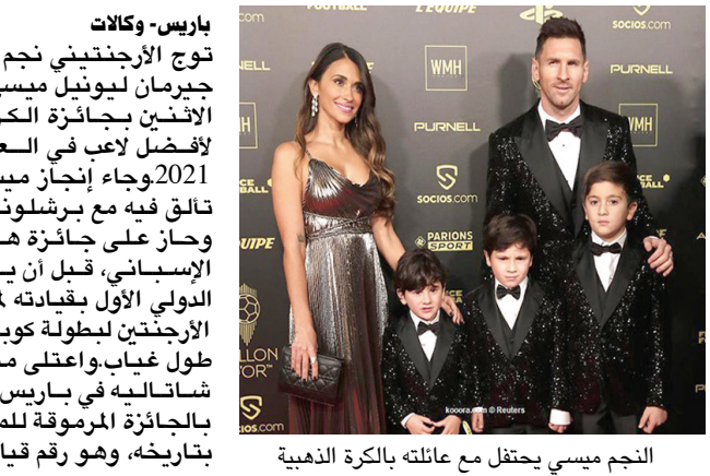
النجم ميسي يحتفل مع عائلته بالكرة الذهبية

باريس - وكالات توج الأرجنتيني نجم باريس سان جيرمان ليونيل ميسي مساء يوم الاثنين بجائزة الكرة الذهبية لأفضل لاعب في العالم لعام 2021 وجاء إنجاز ميسي بعد عام تالق فيه مع برشلونة الإسباني، وحاز على جائزة هدف الدوري الإسباني، قبل أن يحقق لقبه الدولي الأول بفجائه لمنتخب بلاده الأرجنتين لبطولة كوبا امريكا بعد طول غياب، واعتلى ميسي مسرح شاتلaine في باريس، حيث توج بالجائزة المرموقة للمرة السابعة بتاريخه، وهو رقم قياسي تاريخي لم يصل له اي لاعب من قبل.