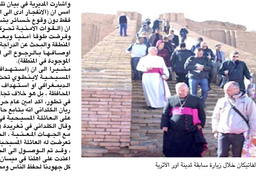
زيارة: وفد من الفايكان خلال زيارة سابقة لمدينة اور الأثرية