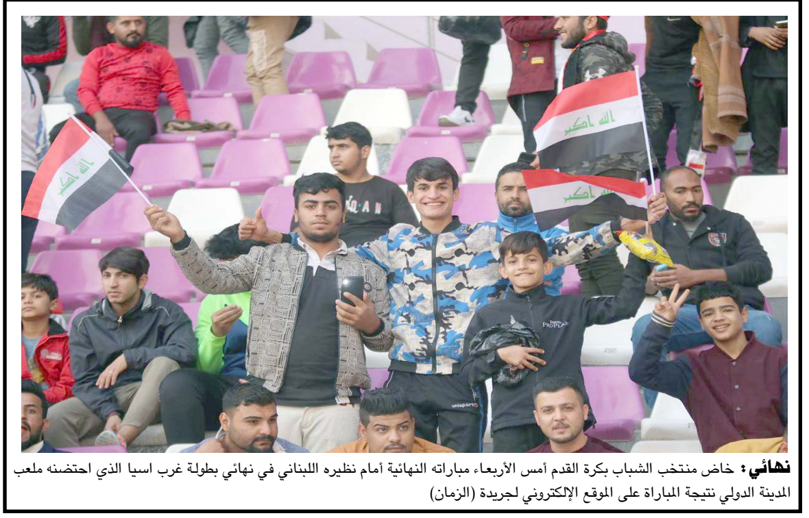
نهادي : خاض منتخب الشباب بكرة القدم أمس الأربعاء مباراته النهائية أمام نظيره اللبناني في نهائي بطولة غرب اسيا الذي احتضنه ملعب المدينة الدولي نتيجة المباراة على الموقع الإلكتروني لجريدة (الزمان)

والسياسي الذي لا يصح بمصلحة اي الأطراف، مؤكداً ان (تشكيل الحكومة يعتمد بالاساس على المعادلة الرقمية، اي من يستطيع جمع اكبر عدد من النواب يمكن من تشكيل الكتلة الأكبر، وبمساهمة فان الجميع يتوافق واحد حتى الان)، ومضى فتيق إلى القول ان (توافق الكتل لا يعني ولادة حكومة مشوهة اذا ابتعدت عن المحاصصة وقدمت مرشحيها من التنكوقراط)، داعياً الاطراف السياسية إلى ان (يكونوا على قدر المسؤولية والاسراع بتشكيل الحكومة الجديدة لان امام البلد ملفات كثيرة، منها تحديات الامن الداخلي وفي مجالات مسيحية