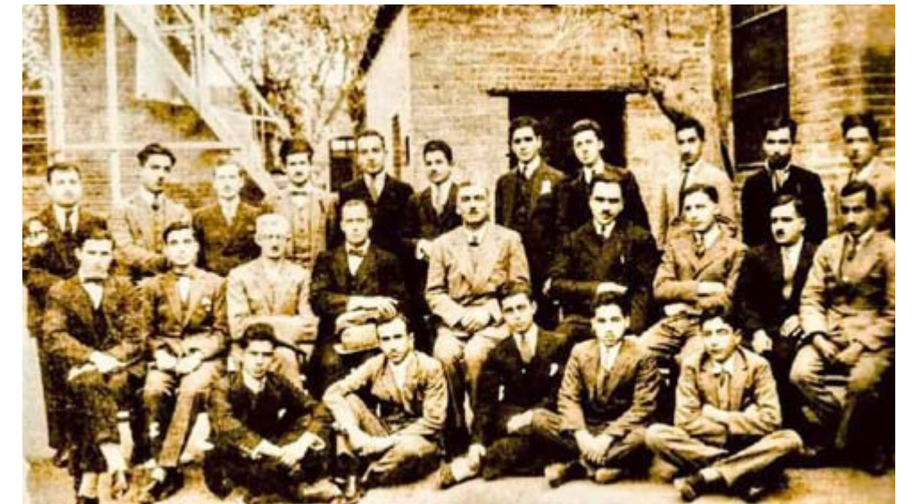
طلبة الكلية الطبية ببغداد في عام تاسيسها 1927 ويظهر في وسط الصورة البروفسور الطبيب