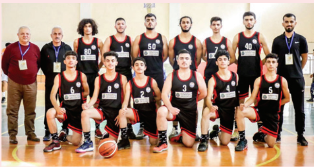
فريق السليمانية بكرة السلة

بغداد - الزمان اختتمت في محافظة كربلاء، يوم الثلاثاء بطولة الجمهورية لكرة السلة بمشاركة واسعة شملت 16 منتخباً يمثلون محافظات العراق. والتقى في المباراة النهائية منتخب السليمانية مع منتخب بغداد، التي أختت فيها لاعبو الفريقين الإمكانات العالية والمهارات الجيدة التي اجتمعت معاً خلال المباراة، لكن كلمة الفصل حسمت للسليمانية بنتيجة 68-56 نقطة. وأنهى منتخب السليمانية، الفترة الأولى لصالحه بنتيجة 31-23 نقطة، بعدما حاول منتخب بغداد جاهداً لنيل نقاط فازت بنتيجة 84-68 نقطة.