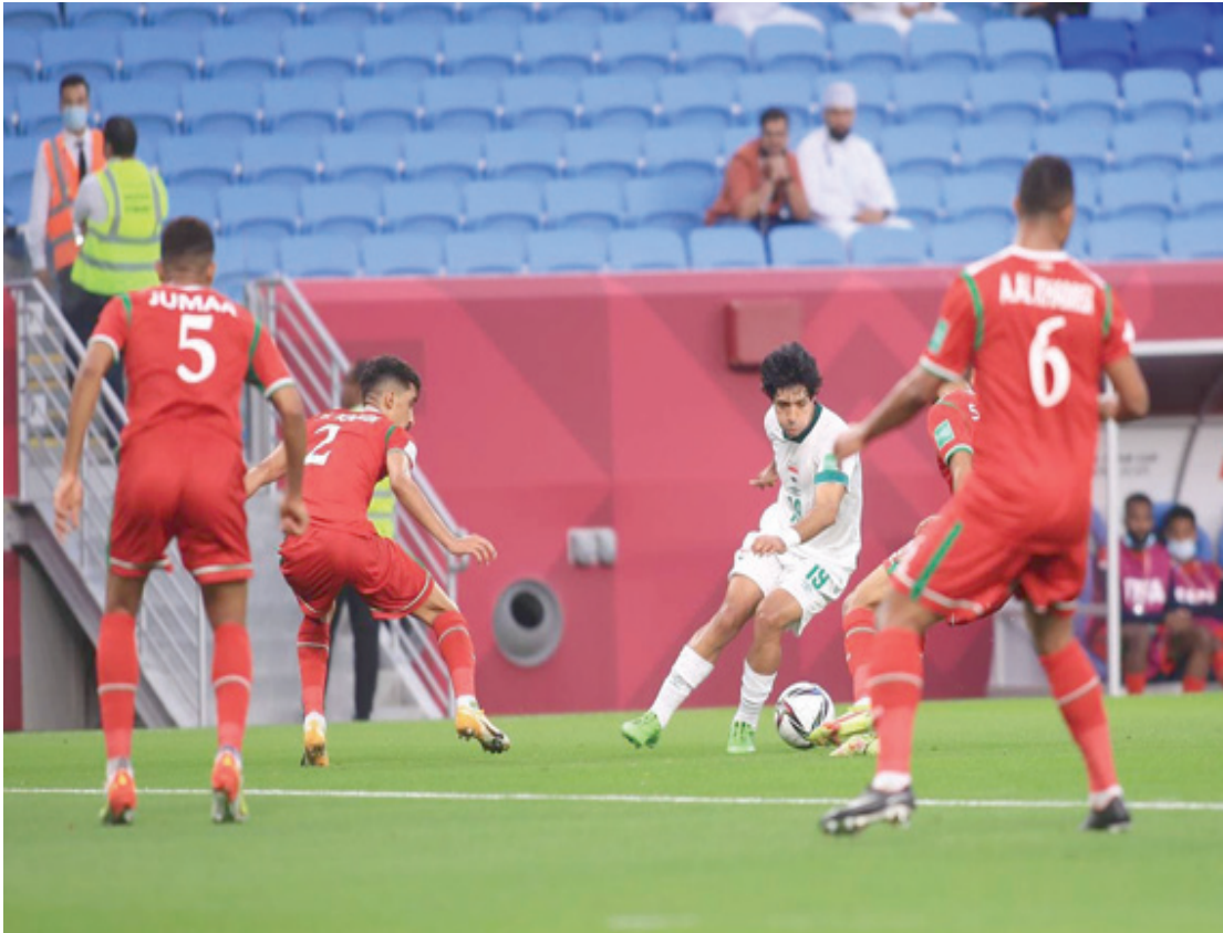
اداء: مازال المنتخب الوطني لايقدم الاداء المطلوب في المواجهات الدولية

صعبه بسبب قوة المقابل الذي قدم اداء جيداً امام قطر ويسعى لدعم نفسه امام الوطني بعد خسارته من قطر الذي عليه تذكار مخاطر اللقاء بقاء افضل من الذي ظهر به امام عمان وبغير نتيجة الفوز قد تتغير حسابات التاهل لدور الثمانية اذا ما علمنا ان اللقاء الثالث سيكون أكثر صعوبة عند مواجهة قطر. فوز قطر