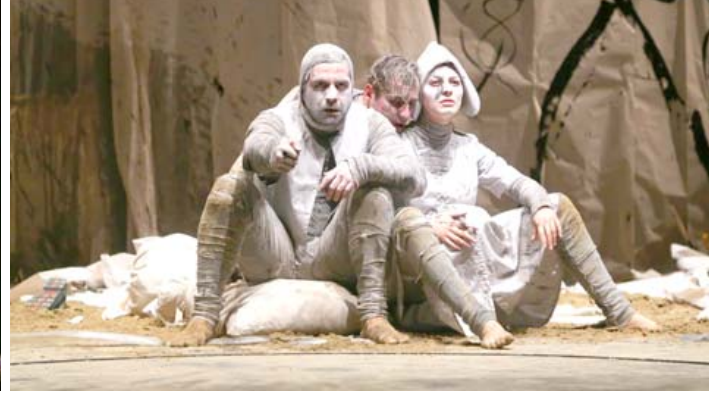
مسرحيات: مشاهد من مسرحية المانية وأخرى تونسية