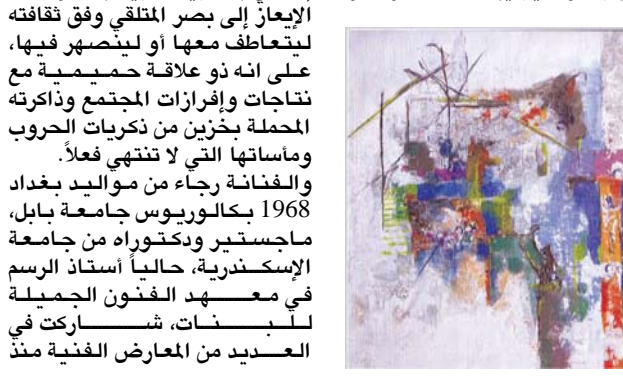
تتوازي مع المفاهيم الفكرية والفنية

في أن واحد، وتواصل عالي (عندما أسد القلم لأخط أشكال لا أعرف بدايتها ولكني أصل معها في رحلة هي هم لا يخلو من جمال وهدف لنصل في النهاية لرؤية عن بيت أو شجرة أو طير يبحث عن ماوى أو