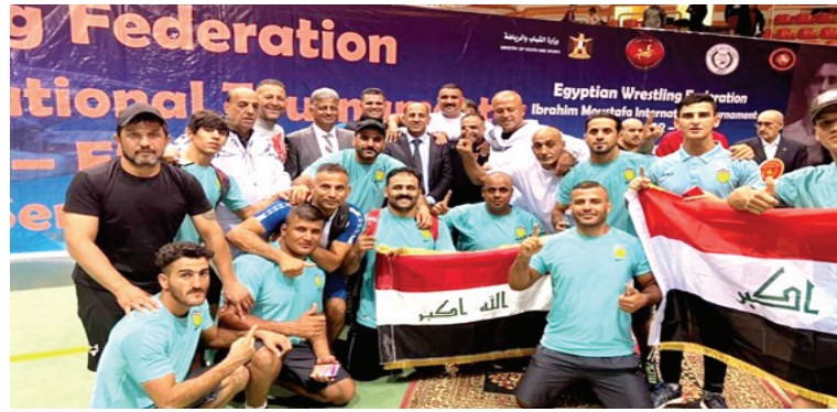
اللاعبين المشاركين في بطولة المصارعة الرومانية

بغداد - الزمان حصد فريق الحدود، المركز الأول في بطولة الأندية العربية المقامة في مصر. وقال المنسق الاعلامي لنادي الحدود زيد الزبيدي في تصريح صحفي ان أبطال الحدود التونسي محمد كمال بو عزيز. الجدير بالذكر ان البطولة تقام سنوياً احياء لذكرى السطل الالبي المصري ابراهيم مصطفى صاحب الميدالية الذهبية الاولى للعرب في المصارعة في الالبياد والتي حصل عليها في الالبياد استردام 1928.