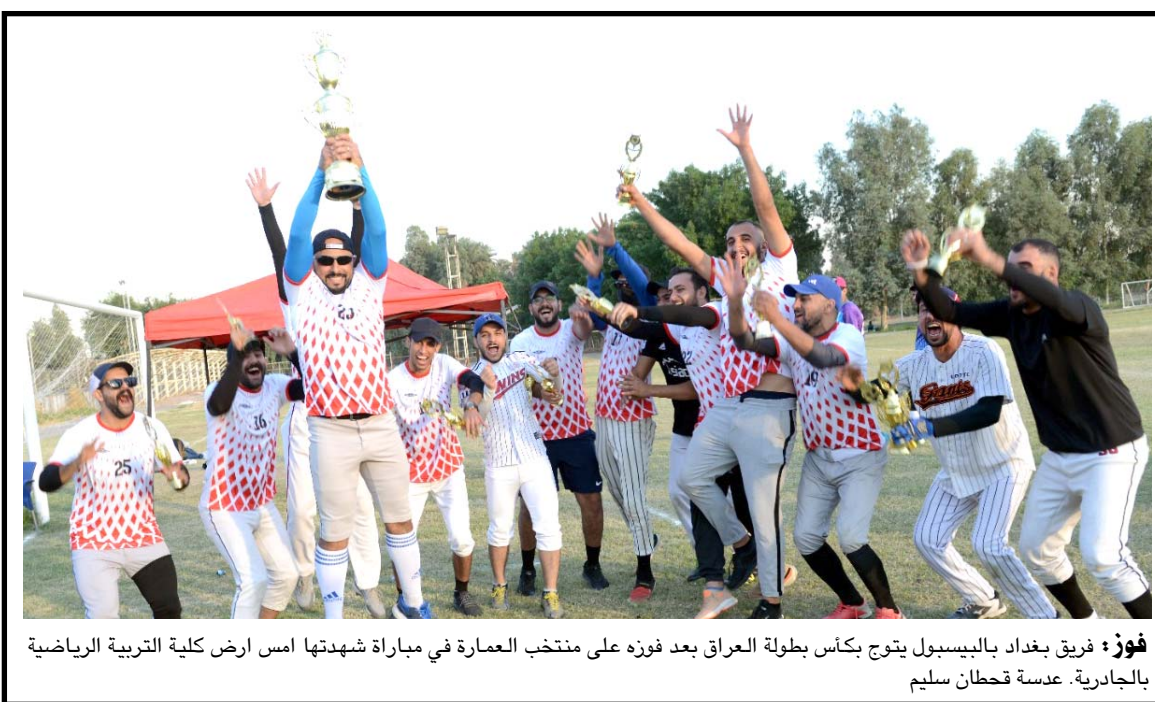
فوز فريق بغداد بالبيسبول يتوج بكأس بطولة العراق بعد فوزه على منتخب العمارة في مباراة شهدتها امس ارض كلية التربية الرياضية بالجابرية. عسة قطان سليم

بينما تعطل 3600 جهاز اثناء اجراء الانتخابات ولم يرسل لبياته المؤيد للنتائج وكان عليه المطالبة بالنظر جديداً في الطعن بشأن حصول تلاعب وتزوير). مجدداً تاكيد ان (الاعتداء على المتظاهرين المحدثين بنتائج الانتخابات مرفوض ويجب كشف من اعطى الامر ومن نفذ كما يجب ان يكون هناك تحقيق شفاف (بإحدى تخبوفاً من تزوير الانتخابات خلال اجتماع سياسي رفيع قبل اجراء الاقتراع) مؤكداً ان (التظاهرات الرافضة لنتائج العملية الانتخابية ، فتحت جسر الجمهورية الذي كفه الستور ولا تستهدف الفنازين وانما بالضد من المفوضية لفشلها في ادارة العملية الانتخابية). لاقا الى ان (اعلان المفوضية لتطبيق الانتخابات انبثقت منذ 6 ايام من شهر، في خطوة تاتي بعد ايام من تعرض رئيس الوزراء لمحاولة اغتيال. وزف