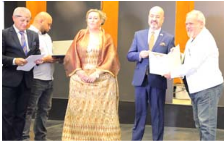
فعاليات: نشاط مسرحي عراقي متميز في مهرجان بصر والأردن