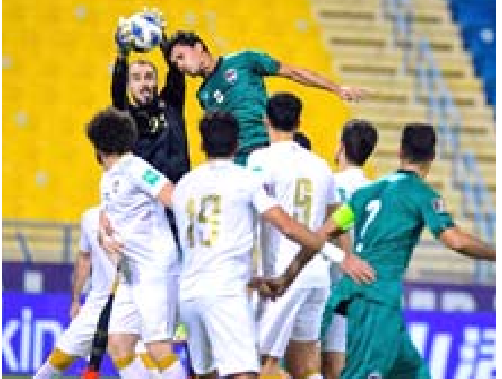
مواجهة المنتخب الوطني امام سوريا التي انتهت بالتعادل

بغداد- الزمان تعدى اللجنة الأولمبية الوطنية العراقية إستغرابها حيال عدم منح وفد الاتحاد العراقي للدراجات تاشيرات الدخول لجمهورية مصر العربية للمشاركة في بطولة العرب باللعبة واجتماع الاتحاد العربي الذي سيقام على هامش البطولة، وفي الوقت الذي تدخل اراضي الشقيقة مصر، ويقام يومين في الاسبوع، العديد من المصاحيب السياحية العراقية الكبيرة، وبعد الأنتفاخ الكبير بين البلدين الشقيقين إثر زيارة الرئيس المصري لبلده العراق، ومشاركته ب مؤتمر بغداد للعاون والشراكة الذي كرس للتحارب والتفاهم العربيين، تبدي اسفنا العالي لتعطل الشباب الرياضي العراقي عن مشاركة اشقائه، في وقت تم منح تاشيرات الدخول ل سبعة عشر وفداً عربياً ومنع ذلك حصل في الجولات الخمس الاخيرة وعندما تحول المنتخب الى حقل تجارب لكن دون جدوى.