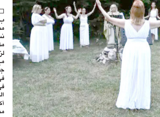
إلى حفلة رجل بلبل بإيقاع منتظم بينما تتقدم خلفه نساء يرتدين الأبيض ويحملن مشاعل مضاءة ويتسندن ترانيم لزيوس. تتكرر هذه المشاهد مع بداية كل صيف عند سفح جبل أوليمبوس، موطن الآلهة في الأساطير اليونانية، وذلك في إطار مهرجان بروميثيوس الذي يستمر أربعة أيام. منذ أكثر من ثلاثين عاما، يتوافد مئات اليونانيين والأجانب