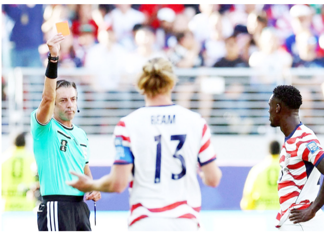
طرده فيفا لغي حالة طرد لاعب أمريكي لكرة القدم

اتخذته حكم المباراة داخل الملعب. فالأولى تدخل ضمن صلاحيات اللجان القضائية التابعة لـ«فيفا»، بينما الثانية تخضع لضوابط أكثر تعقيداً وحساسية، حفاظاً على هيبة القرارات التحكيمية واستقرار المنافسات. ومع ذلك، فإن ما حدث يؤكد أن كرة القدم الحديثة لم تعد تحسم بالأهداف والخطط الفنية فقط بل أصبحت اللوائح القانونية والتفسيرات الانضباطية جزءاً مؤثراً في رسم مصير المنتخبات خلال البطولات الكبرى.