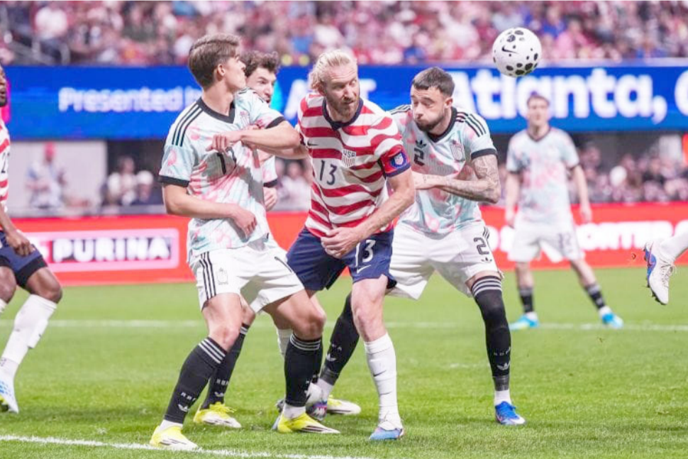
رياضية: منتخب بلجيكا يفوز على الولايات المتحدة والمكسيك برباعية بالونديال

قطع الكرة وإيقاف خطورة الإسبان بعد البداية السريعة الساخنة 6:0 وقد يتهم رونالدو بذلك لأنه لم يقدم شيء في أهم مواجه له والمنتخب الذي خرج خاوي الوفاض وسقط بكاء وحسرة من الأعصاب اغلقت وجوه العشاق بعد الخروج المحبط لفريق متحم باسماء كبيرة تلعب في كبار أندية أوربا قبل أن تخيب المنتخب الإيم والمنتخبين الذين شهدوا في السنوات الأولى وفشلت في مجارة الإسبان الذين كانوا أفضل نسبيًا في الممثل كانت مباراة رتيمة ومملة واداء غير متوقع انطلاقاً من الفريقين الذين فشلوا في رفع ريم اللقاء عندما ظهر واضحا التفكير بالنتيجة فاعتمد التركيز وقل الجهود والخطورة خصوصاً من جانب منتخب البرتغال عندما ظهر على استحياء وترك في ادائه أكثر من علامة استفهام ولم يتعامل اللاعبون بشكل قوي في