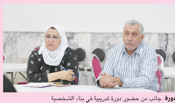
دورة: جانب من حضور دورة تدريبية في بناء الشخصية