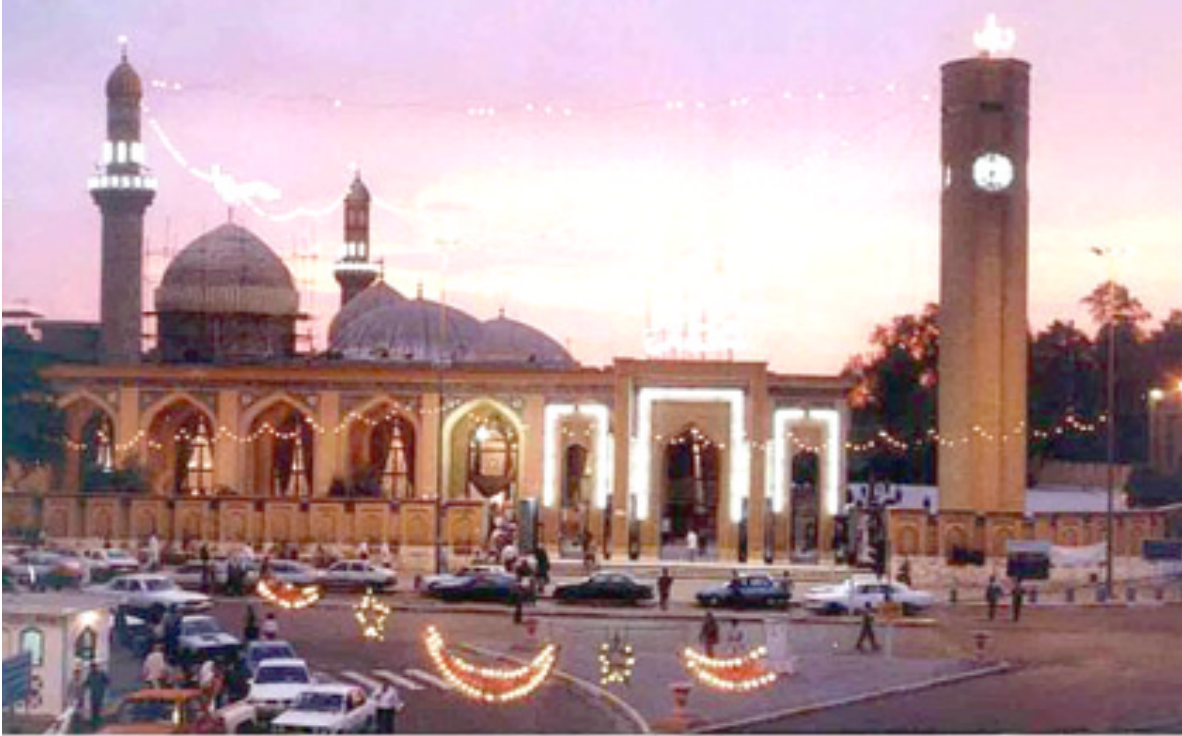
الإمام الأعظم؛ ضريح الإمام أبو حنيفة في ليل بغداد

تحقيق باشر بالعمل في موقع الحادث وتوصل إلى معلومات مهمة عن هوية الانتحاري. لافتا إلى أن نتائج التحقيق ستعلن فور اكتمالها للمراي العام.