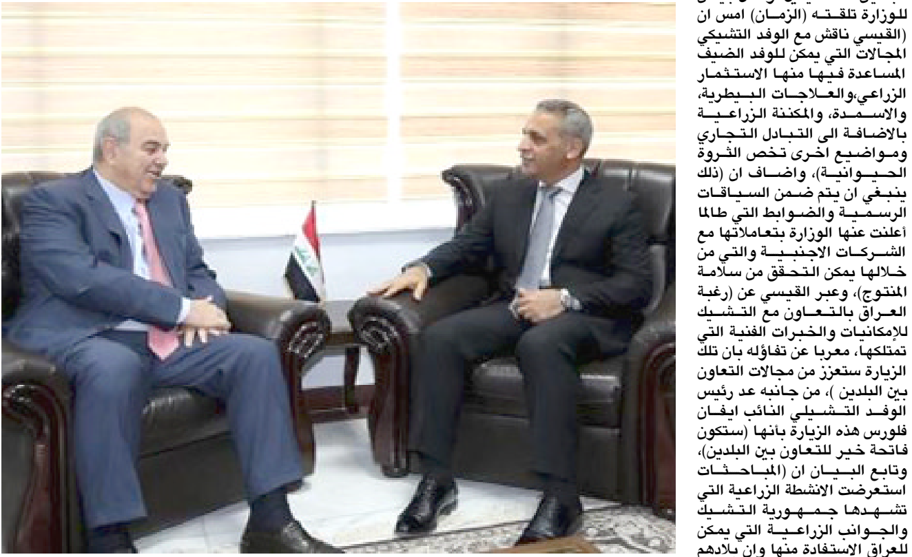
زيارة؛ اياد علاوي خلال زيارته مجلس القضاء الأعلى

مهدى ضد القيسي مع الوفد توقيع مذكرة التفاهم في المجالات الزراعية بشقيها النباتي والحيواني وبما فيه مصلحة البلدين الصديقين. وقال بيان للوزارة تلقته (الزمان) امس ان (القيسي ناقش مع الوفد التشيكي المجالات التي يمكن للوفد الضيف المساعدة فيها منها الاستثمار الزراعي، والعلاجات البيطرية، تطوير العلاقات الاقتصادية بالإضافة الى التبادل التجاري ومواضيع اخرى تخص الضرورة الحيوانية). واضاف ان (ذلك ينبغي ان يتم ضمن السياقات الرسمية والضوابط التي أعلنت عنها الوزارة بالتعاون مع الشركات الاجنبية والتي من خلالها يمكن السوق امام البضائع المنتجة التشيكية). مبيّناً ان (العراق تربطه علاقات ثنائية متحصرة مع بعض دول امريكا الجنوبية والتي من ضمنها ستكون تشيلي والسعي الى التوقيع على مشروع التعاون الاقتصادي والتجاري بين البلدين). واضاف ان (ضرورة تاسيس لجنة عراقية آ تشيلية مشتركة عقب التوقيع على مشروع التعاون الاقتصادي والتجاري لتابعة الامور التجارية وكذلك الدعوة الى المشاركة في المعارض التي تقام في كلا البلدين). فيما بحث الوكيل الفني لوزارة الزراعة