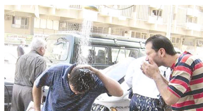
ارتفاع الحرارة؛ شباب يحاولون تقليل اثر الحرارة بالما.

الغظمي إلى 42 درجة مئوية واكدت الهدية في بيان تلقته (الزمان) أمس (استمرار تآثر اجواء العراق بامتداد الغطى المتوقعة في مدينة بغداد 42 درجة والصفري 15 درجة) وأوضح البيان ان (اجواء العراق تتأثر بامتداد مرتفع جوي قادم من البحر المتوسط ليكون الطقس في المناطق كافة صحوا مع بعض العيون ودرجات الحرارة ترتفع قليلا عن اليوم السابق). وتابع انه لا يتوقع حدوث تغير في الحالة الجوية في المناطق كافة الاربعة المقبل عن اليوم السابق عدا انخفاض قليل في درجات الحرارة في المنطقة الجنوبية). ويؤكد اطباء الصحة العامة انه (عند ارتفاع درجة حرارة الجو، يتفاعل جسم الإنسان مع ذلك بضع كميات اكبر من الدم إلى سطح الجلد، وتلك ترفع حرارة الجسم الداخلية التي السطح، وهو ما يؤدي إلى حدوث التعرق ومع تبخر ذلك