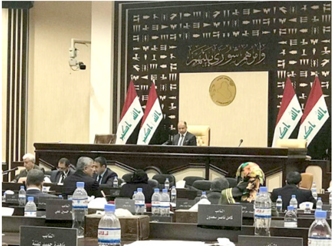
جلسة البرلمان يجتمع في جلسة الاعتيادية