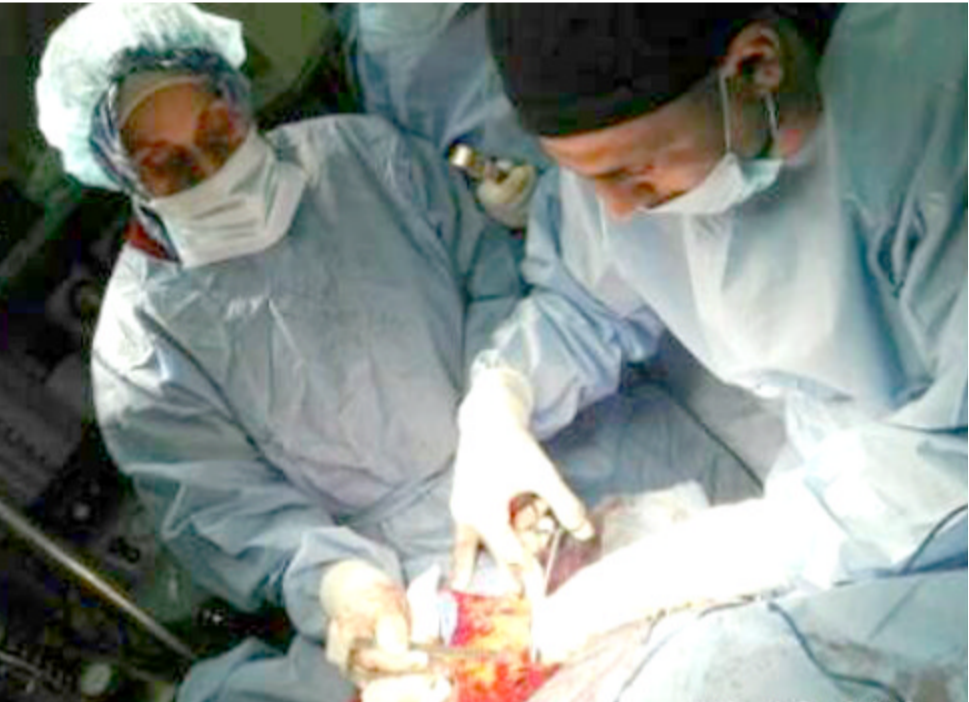
فريق طبي؛ فريق طبي يقوم بإجراء عملية نادرة لمريض

(الفريق قرر إجراء عملية لإستئصال الحنجرة وما يجاورها من الأنسجة إذ تم أيضا إستئصال العقد اللمفاوية من الخنق ورفع سدلة العضلة الصدرية للترقيع). بدوره تمكن فريق طبي في مستشفى النعمان التعليمي التابع لادارة صحة بغداد الرضاة من إجراء عملية جراحية لرفع الثدي مع الغدد اللمفاوية الإبطية. وقال بيان للوزارة تلقته (الزمان) امس ان (رئيسة الجمعية فيرونكا سكفورتسوفوا أعلنت عن استعدادها لتقديم الدعم والإسناد للوزارة تمشيا للجهود المبذولة من قبل الوزيرة عبدة حمود وبورها في تعزيز الخدمات الوقائية والعلاجية وماتقدمه الوزارة من خدمات متميزة رغم الظروف الصعبة التي يمر بها العراق). كما استحدثت الوزارة وحدة شؤون المواطنين في دائرة العيادات الطبية الشعبية. المتابعة والطبات والشكاوى. وتمكن فريق طبي جراحى مشترك في مستشفى الشهيد غازي الحريري للجراحات التخصصية بمدينة الطب من إجراء عملية لمريض يبلغ من العمر 57 عاما يعاني سرطان الحنجرة المتكرر. وقال البيان ان (مريضا يبلغ من العمر 57 عاما يعاني من سرطان الحنجرة المتكرر). وأضاف ان