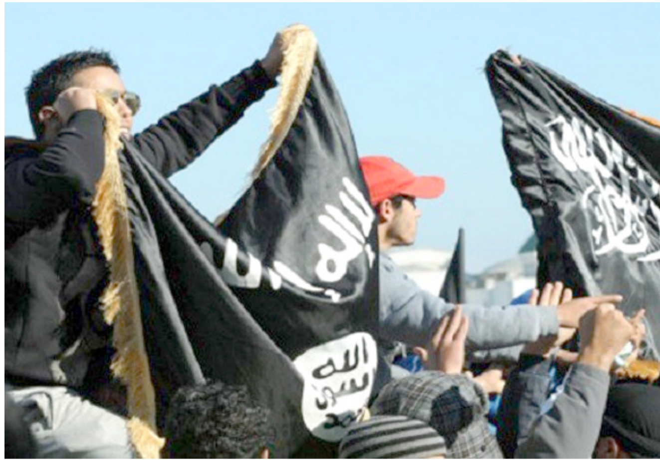
تجمع، عدد من عناصر داعش خلال تجمع لهم

تنظيم الدولة الإسلامية السبب مسؤوليته عن الهجوم وكان تفجيران انتحاريان استهدفا كنيستين الشهر الماضي مما أسفر عن مقتل أكثر من 45 شخصا وأعلن التنظيم مسؤوليته عنهما أيضا. مبكرات الارباب وقال الرئيس المصري عبد الفتاح السيسي في كلمة أذاعها التلفزيون يوم الجمعة بعد الهجوم إنه أمر بتوجيه ضربات إلى معسكرات الإرهاب متوقعا باستهداف اي معسكرات في الداخل او الخارج بتدرب فيها مسلحون لتنفيذ هجمات في مصر. وقال مصدران عسكريان لرويترز إن مصر شنت ثلاث غارات جوية إضافية يوم السبت في منطقة برنة التي تحاول قوات شرق ليبيا بقيادة خليفة حفتر الحلف المقرب لخصر انتزاع السيطرة عليها من إسلاميين و منافسين آخرين. وقال مصدر في الجيش الوطني بقيادة حفتر لرويترز إن الجيش سبق مع الجيش المصري لخصر مخازن الخبيرة التابعة لمجلس شورى مجاهدي برنة وهي جماعة إسلامية شاملة تعارض تنظيم الدولة الإسلامية وقال أحد سكان برنة لرويترز إن طائرات حربية شوهت تقصف منطقة ظهر الأحمر في الجزء الجنوبي من المدينة يوم السبت. وامتنع المتحدث العسكري المصري عن التعليق على الموجة الثانية من الغارات، وأخطرت مصر مجلس الأمن بان الضربات لمواقع الإرهابيين في شرق ليبيا جاءت في إطار الدفاع عن النفس وقال المتحدث الرسمي باسم وزارة الخارجية إن بعثة مصر الدائمة لدى الأمم المتحدة سلمت رسالة إلى