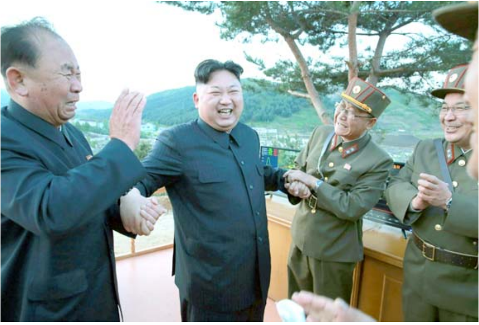
زعيم كوريا الشمالية بيو سغيداً بعد نجاح إطلاق صاروخ جديد مضاد للطائرات

بالبيستي متوسط المدى محققة بعض التقدم الفني. وأضافت الوكالة إن مساعدي كيم العسكريين كانوا بصحبته. وقالت كوريا الشمالية يوم الإثنين إنها اختبرت بنجاح ما وصفته بصاروخ بالبيستي متوسط المدى يفي بكل الشروط الفنية ويمكن الآن إنتاجه بشكل ضخم على الرغم من أن مسؤولين وخبراء خارجيين شككوا في مدى تقدمها. ويوم الثلاثاء قال فينسنت ستوراوت رئيس وكالة مخابرات الدفاع الأمريكية إنه إذا أثرت كوريا الشمالية بلا رادع فإنها تسير في طريق "حتمي" نحو الحصول على صاروخ نووي قادر على ضرب الولايات المتحدة. وامتنع ستوراوت في كلمة أمام مجلس الشيوخ عن تحديد إطار زمني ولكن خبراء غربيين يعتقدون أن كوريا الشمالية مازالت بحاجة لعدة سنوات لصنع مثل هذا السلاح.