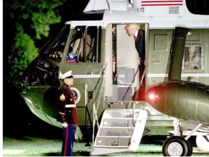
وصول الرئيس الأمريكي دونالد ترامب لدى وصوله واشنطن بعد ختام جولته الشرق اوسطية

واشنطن (أ ف ب) - يستعد دونالد ترامب العودة للوطن والامم من هذا كله تصون سيادة العراق وتحافظ على استقلاله واستقلال قراره السياسي والأمني وتحافظ على حدود العراق البرية والبحرية والنهرية وتضمن دول الجوار من التجاوز عليها وتعدم ما سلب واغتصب منها ومن حولها النقطية الحدودية .