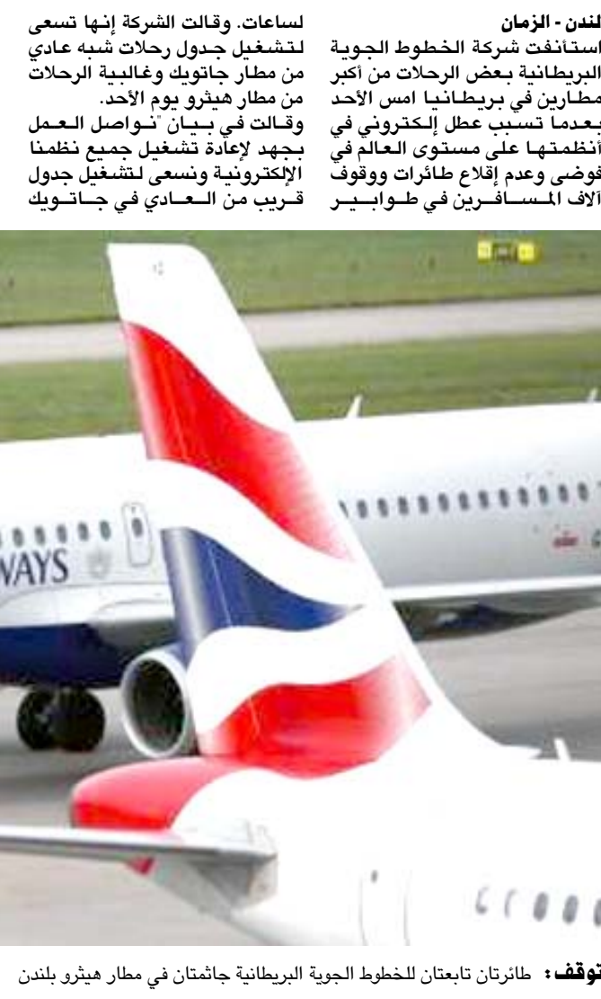
توقف طارتان تابعتان للخطوط الجوية البريطانية جاثمتان في مطار هيثرو بلندن

في تعطيل عملياتها على مستوى العالم وأثرت أيضاً على مراكز خدمة العملاء والموقع الإلكتروني. وقال اليكس كرون، رئيس مجلس الإدارة والرئيس التنفيذي للشركة التابعة لمجموعة أرتناشوسنال إيرلاينز جروب (إي.إيه.جي) أكبر مجموعة طيران في أوروبا، إنه لا وغالبية الخدمات من هيثرو اليوم الأحد. وأضافت "تعتذر بشدة للإزعاج الشديد الذي تعرض له عملائنا". والفتت الخطوط الجوية البريطانية جميع رحلاتها من مطاري هيثرو وجاتويك في لندن يوم السبت بعدما تسببت مشكلة في الكهرباء لساعات. وقالت الشركة إنها تسعى لتشغيل جدول رحلات شبه عادي من مطار جاتويك وغالبية الرحلات من مطار هيثرو يوم الأحد. بعدما تسبب عطل إلكتروني في أنظمتها على مستوى العالم في فوضى وعدم إفلاق طائرات ووقوف آلاف المسافرين في طوابير استأنفت شركة الخطوط الجوية البريطانية بعض الرحلات من أكبر مطارين في بريطانيا أمس الأحد بعدما تسبب عطل إلكتروني في أنظمتها على مستوى العالم في فوضى وعدم إفلاق طائرات ووقوف آلاف المسافرين في طوابير