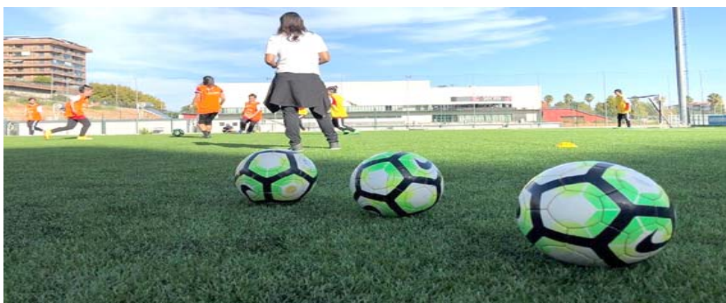
نقل رعاياها من كابل ويأقي المدن إلى خارج البلاد، إلى جانب متعاقدين وأفغان عملوا مع القوات الأجنبية إبان تواجدها على الأراضي الأفغانية.