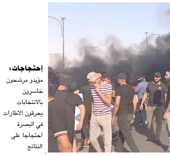
مؤيد مرشحون خاسرون بالانتخابات يحرقون الاطارات في البصرة احتجاجا على النتائج

استمرار تعنت القوى برأيها دون الخروج برؤية موحدة تجمع الفرقاء على حل سياسي غير مشروط لتسريع عملية تشكيل حكومة وطنية قابلة يقع على عاتقها خدمة المواطن الذي تفنى منذ اعوام من هذا الصراع، مؤكدين انه (لا حل في الاق سوي اشارك الجميع بالحكومة المقبلة ، وبالتالي فان هذا التوجه قد يبعث رسائل اطمئنان لجميع