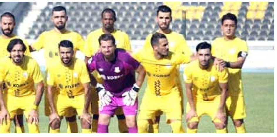
فريق أربيل لكرة القدم