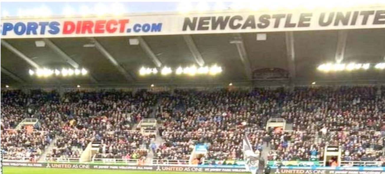
جمهور: ملعب نادي نيوكاسل بدون جمهور

موقعه وسيدبر اللقاء المقبل أمام توتنهام في الدوري الإنجليزي الممتاز يوم الأحد ، وهي مباراته رقم 1000 كمدير فني. وعلق وودغيت على عدم الحديث مع الكبار، مجرد وهم ، وعلبك أن تبني النادي أولاً. التي عومل بها كانت مشيرة للاشمئزاز. إنه مدرب ويخوض مباراته رقم 1000 وهذا دليل الطويل الذي قضاه في هذه اللعبة. مستقبلاً أيضاً تكهنات حول حيث ربطت التقارير بين الصفقة واستقدام مدرّبين آخرين مثل لوسيان فاقر، مدرب بروسيان دورتموند السابق، وستيفن جيرارد مدرب رينجرز، وقائد تشيلسي السابق فرانك لامبارد. وقال بروس يوم الجمعة إنه لم تكن هناك مناقشات بشأن مستقبله حتى الآن، بينما أكدت أماندا ستافيلي، التي اشترت حصة أيضاً في النادي، إن المدرب بروس سوف يظل في