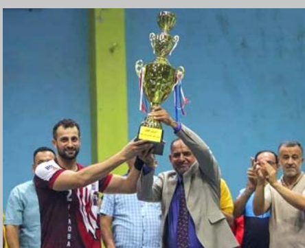
بغداد - الزمان

توج فريق نادي الجيش لكرة اليد بكأس السوبر بعد فوزه على فريق نادي كربلاء بنتيجة 24-30 هدفاً. وقال محمد الأعرجي رئيس اتحاد كرة اليد في تصريح صحفي، إن المباراة أقيمت قبل افتتاح الموسم الجديد بين فريقَي الأول والثاني. وأضاف الأعرجي إن مباراة السوبر جرت في قاعة نادي الكرخ للالعاب الرياضية في بغداد. وشهدت مباراة الختام توزيع الجوائز والدروع التقديرية من قبل رئيس الاتحاد العراقي لكرة اليد محمد هاشم الأعرجي على الفريقين والضيوف.