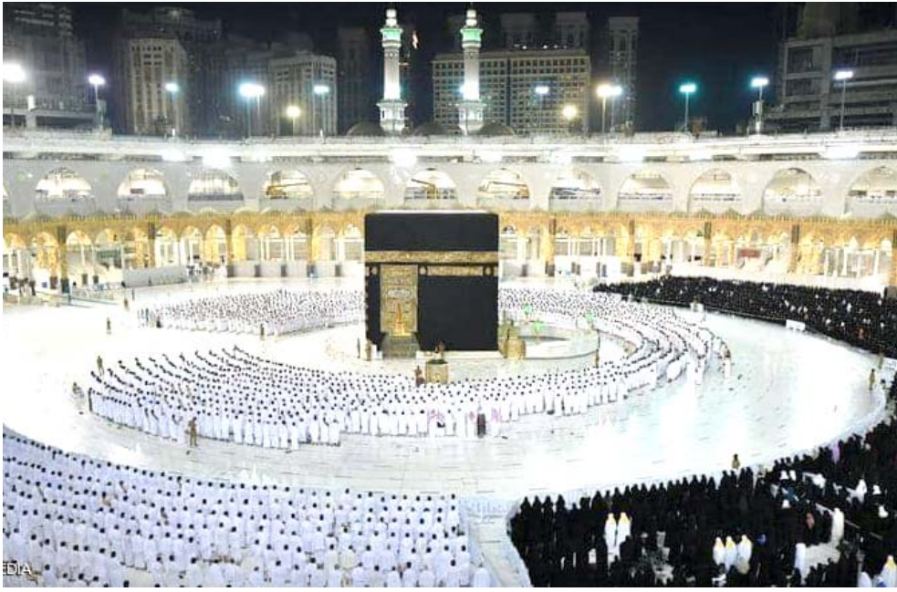
صلاة: المسلمون يؤدون أول صلاة من دون تباعد اجتماعي في الكعبة المشرفة

الكعبة، قبلة المسلمين، ليستقبل المسلمين بكامل طاقته الاستيعابية ومن دون أي تباعد، رغم أن وضع الكعبة لا يزال الرامياً كما أن مس الكعبة في وسط ساحة المسجد فأبروس كورونا قبل نحو عام ونصف، مع بدء تخفيف المملكة لإجراءات المرتبطة بمكافحة الوباء.