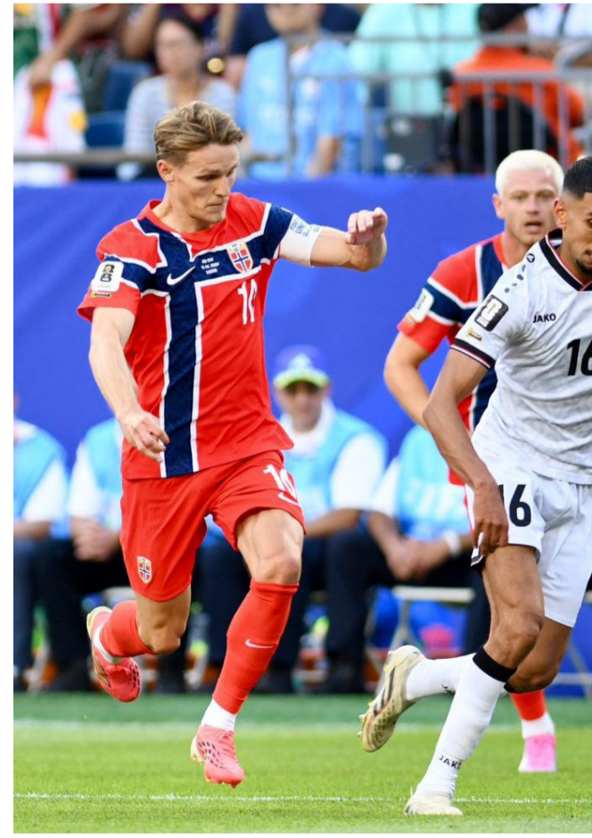
خسارة: المنتخب الوطني يخسر أمام منتخب النرويج في مواجهاته بموندリアル

الكرة ارتطمت بالحارس. شد عصبي وظهر الشد العصبي على لاعبي الوطني وتوسعت المساحات في منطقتهم وتراكم أخطاء الدفاع بشكل أكثر من المتوقع كما افتقد الفريق للحلول وكل ما قام به اللاعبون التراجع دفاعياً للحد من خطورة هجمات النرويج الذي لو تعامل واستغل الفرص بشكل أفضل لخرج بنتيجة أكبر في وقت