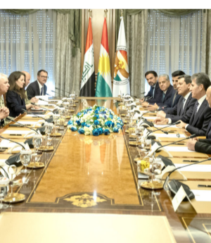
اجتماع : نيجرفان البارزاني وتوم باراك برأسان الاجتماع الثلاثي في أربيل

مسعود البارزاني في وقت سابق، مع باراك والوفد المرافق له، تعزيز استقرار العراق والإقليم. وذكر بيان أمس إن (البارزاني استقبل في صيف صلاح الدين، باراك، الذي أكد إن العراق والمنطقة بحاجة إلى الاستقرار، وإن الإقليم يؤدي دورا مهما وجوهريا في الحاضر والمستقبل). وأعرب باراك عن (عجابه بالتطور والتقدم الذي يشهده الإقليم). واصفا إياه