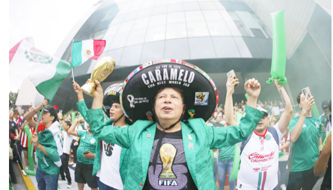
جامير المكسيك خلال الموندリアル

أسم العراق انت الدؤت الأخلاق وأول قانون بالعلم وكتب قبل الأوراق أول حرف للعلم يا أبو الخير والأرزاق أطب أرض بالعلم بقى لربك شتاق مهما أخذنا العلم شارك والعب يا عراق وشل صوتك بالعلم ومهما يكن لعل شاق صبرك يشوفه العالم