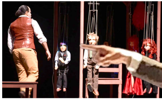
مسرح: انشغال الجمهور ببدايل اسرع واخف يبعدهم عن المسرح