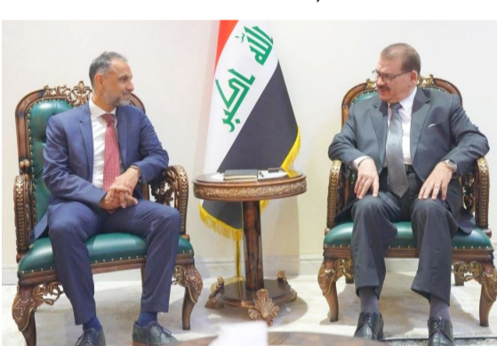
استقبال : وزير التربية يستقبل السفير البريطاني

من 44 ألف متعلم، بينما بلغ عدد المشاركين في الدورات التدريبية ما يزيد على 188 ألف مشاركة، فضلا عن منح أكثر من 154 ألف شهادة معتمدة). وتابع إن (المنصة قدمت 10 دورات تدريبية متخصصة عبر 7 مديريات من الخبراء ويواقع أكثر من مئة مادة فيديوية، تناولت موضوعات البحث العلمي ومسار بولونيا والتعلم الإلكتروني، فضلا عن برامج نفذت بالشراكة الاستراتيجية مع مؤسسة عالمية). مضمنا (التفاعل الذي أبدته الجامعات والكليات العراقية في المؤسسات التعليمية إلى مواصلة تحفيز التدريسيين والباحثين وطلبة الدراسات