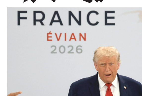
كلمة : الرئيس الأمريكي يلقي كلمة في اجتماع إيفيان

وكانت الحكومة الإيرانية قد أعلنت، رفع الحصار الأمريكي المفروض على الموانئ الإيرانية منذ نحو شهرين، وذلك قبيل توقيع الاتفاق مع الولايات المتحدة. ومن المقرر أن توقع الولايات المتحدة وإيران يوم غد الجمعة في سويسرا، مذكرة تفاهم تهدف إلى إنهاء