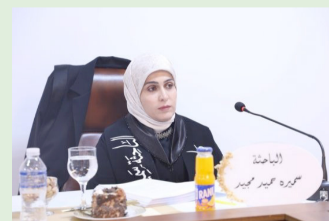
مناقشة : الباحثة خلال المناقشة