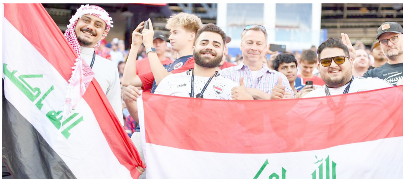
مؤازرة: الجمهور العراقي يؤازر المنتخب الوطني في مواجهات كأس العالم

الرياضية والانضباط الذي ساد العراق قبل المواجهتين الصعبتين أمام فرنسا والسنغال، فالمنذال لا يجسم من مباراة واحدة، وما قدمه العراق في الشوط الأول أمام النرويج يؤكد أن أسود الراقدين قادرون على تقديم صورة أفضل في الجولتين المقبلتين إذا ما تم تلاقي الأخطاء الدفاعية ورفع الجاهزية البدنية للفريق.