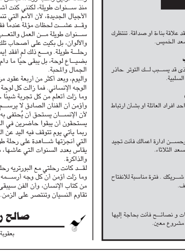
شيرين عبد الوهاب

مواقع التواصل الاجتماعي. ويأتي هذا الظهور بعد فترة من الإخفاء والتراجع عن نشاطها الفني، قبل أن تبدأ باستعادة حضورها تدريجياً من خلال طرح أعمال غنائية جديدة والتضخيم لعدد من الحفلات والمشاركات الفنية المنتظرة خلال الأشهر المقبلة، ما شاع حول وجود خلافات مهنية أو دوافع دينية وراء هذا القرار. واوضحت الحكيم، في مداخلة مع برنامج تلفزيوني أنها اتخذت قرار الاعتزال وهي في قمة عطائها الفني بسبب شعورها بالافتقار والتسبب من العمل الإبداعي، ورفضت الربط بين خطواتها وبين الأفكار التي تحرم الفن، مشيرة إلى أن الفن رسالة سامية وليس محظوراً، ودعت إلى أهمية الوعي والعرفة وتجنب الجهل السائد حول هذه المفاهيم. كما لفتت إلى أن العمر يمر سريعاً وعلى الإنسان استغلال حياته لفهم غايته الحقيقية.