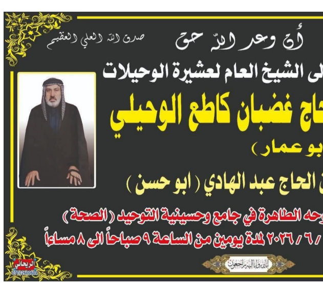
بسم الله الرحمن الرحيم