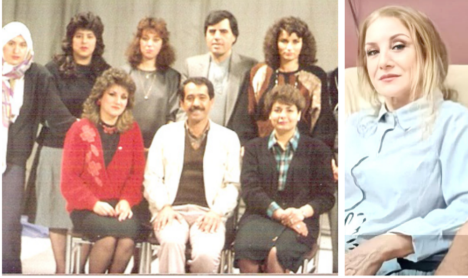
محطات: مسيرة نوال محسن الاعلامية والتلفزيونية غنية بالمحطات المتميزة

بجمهوره عبر ظهوره بظهور وسائل التواصل الاجتماعي؟ العلاقة بين المذيع والمستمع كانت أكثر صدقاً فالصوت ينتظر صوت المذيع في أوقات محددة من اليوم فتكون بينهما لغة المذيع على المتابع والتواصل المستمر. فمئات وسائل التواصل الأساسية هي الاتصالات المستمرة الهادفة والرسائل البريدية. فمئات تلك كلمة يقولها المذيع لها بيوت الناس وصوته جزء من حياتهم مما خلق علاقة احترام متبادل بينهما... □ هل سلبت التكنولوجيا من المذيع شيئاً من حضوره أم أنها منحتة فرصاً جديدة؟ التكنولوجيا ساهمت في حضور المذيع في السابق كان ظهوره محصوراً بين الإذاعة والتلفزيون أما اليوم أصبح قادراً للظهور عبر الفيسبوك واليوتيوب والبلت المباشر لذا منحتهم فرصاً أكثر للتفاعل. ولكن بظل حضوره مرتبطة بقدرة ابداعه المهني والثقافي... البقية على الموقع الالكتروني