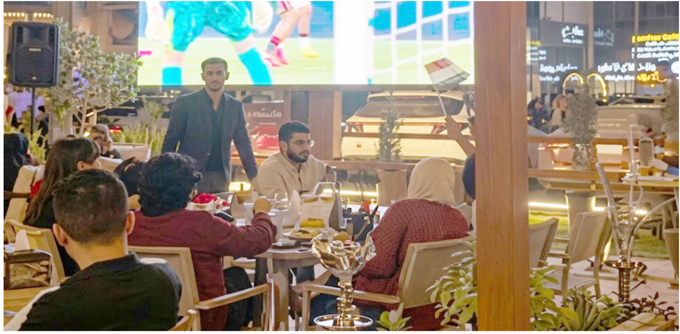
متابعة: رواد المقاهي يتابعون مباريات الموندiales

الموصل - سامر الياس سعيد لطالما شكلت المقاهي والكافيهات محطات لإستقطاب أكبر متابعين للأحداث الرياضية حيث يحلو للكثيرين متابعة المباريات بصورة جماعية والتماهى مع كل حركة او هجمة يؤديها لاعب ضمن المنتخبات ولطالما شكلت تلك الامكنة فرصاً للشباب للاجتماع ومتابعة المباريات وابداء الآراء كصورة مصغرة مؤخرًا وقد ابرزت الاستوديوهات التحليلية فمع كل تجمع صغير في اي مقهى تجد الآراء والأفكار تتقارب او تتباعد بنشان واقع اي منتخب او لاعب يظهر على شاشة التلفاز وفي مدينة الموصل.