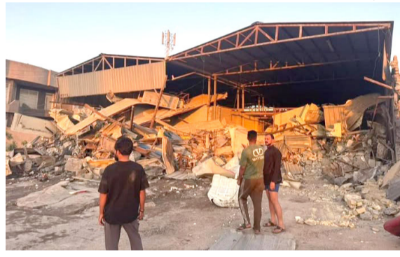
تجاوز : الأماكن المتواجزة التي شملتها الحملة الأمنية البلدية

والتعليمات المعمول بها، مهما كانت أسبابه أو مبرراته، فيما القت قوة من قيادة شرطة بغداد الرصافة، القبض على شاب وفتاة كانا يستقلان دراجة نارية، بعد ضبط مواد مخدرة بحوزتهما في جانب الرصافة. وأكدت القيادة في بيان أمس إن (مفازهما) تمكنت من اعتقال المتهمين خلال ممارسة أمنية نفذتها ضمن قاطع المسؤولية، حيث عثر بحوزتهما على مواد مخدرة من نوع الكريستال، مشيراً إلى إن (المتهمين) أحيلوا إلى مركز الشرطة المختص لاتخاذ الإجراءات القانونية اللازمة بحقهما وفق القانون). وفي كركوك، وجه المحافظ رئيس اللجنة الأمنية العليا في المحافظة محمد سمعان أغا في بيان أمس (بفتح تحقيق في حادثة اعتداء أحد العناصر الأمنية على مواطن داخل إحدى محطات تعبئة الوقود)، على صعيد متصل، أوضحت قيادة شرطة المحافظة، بصحابة متخصصة بسرقة المركبات، وقال بيان أمس إن (مفاز) قسم مكافحة الإجرام، وبإستناد من فوج سوات كركوك، نفذت عملية نوعية، أسفرت عن