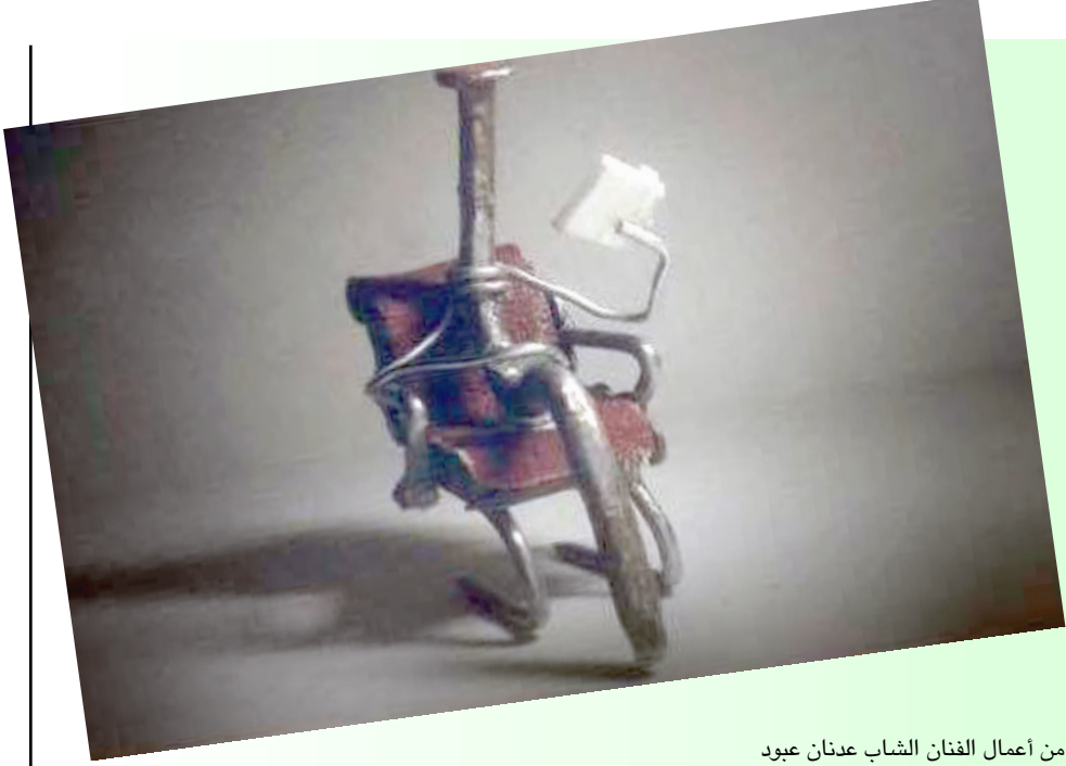
من أعمال الفنان الشاب عدنان عبيد