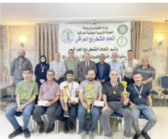
بطولة : الفائزين ببطولة الرافدين الدولية للشطرنج