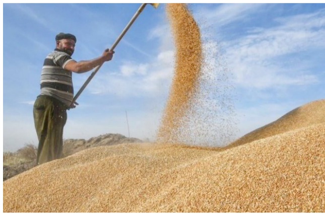
حقن: فلاح في حقل ديالى

ويعد محصول الحنطة من أهم المحاصيل الاستراتيجية في العراق، إذ تعتمد الدولة سنوياً على شراء كميات كبيرة منه لدعم مفردات الطاقة التموينية وتعزيز الأمن الغذائي.