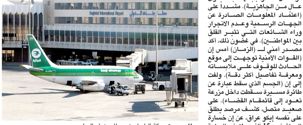
مطار: عودة حركة الطيران في مطار بغداد الدولي

العراقية أمام جميع الرحلات الجوية القادمة والمغادرة والعبارة لمدة 72 ساعة بصورة مؤقتة واحترافية. وأوضح بيان سابق إن (هذا الإجراء يأتي استناداً إلى التقييم المستمر للموقف الأمني في ضوء التطورات والنوثرات الإقليمية الراهنة حفاظاً على سلامة وأمن الطيران المدني). وتابع إن (القرار يخضع للمراجعة وإعادة التقييم بصورة مستمرة وفقاً لما يستجد من معطيات، إلى أن يتم إشعار شركات الطيران والجهات ذات العلاقة بأي مستجدات وتحديثات القرارات بعدة الشان). كما نفى رئيس السلطة بنكين ريكاني، في وقت