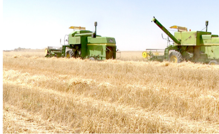
حصاد: اليات تقوم بعملية حصاد الحنطة في إحدى مزارع نينوى

بما يضمن وصولها إلى مستحقيها في جميع المحافظات. دعم الفلاح وأكد السباري عن هذه الخطوة تأتي دعماً للفلاح العراقي وتعزيزاً للأمن الغذائي الوطني، وتجسد التزام الحكومة بحقوق المزارعين ودعم القطاع الزراعي الوطني. منحه (حملة الحصاد) أطلقت في الأراضي الروية التي تبلغ مساحتها نحو 600 ألف دونم، مع وجود مساحات ديمية مزروعة خارج الخطة الزراعية.