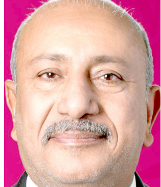
نصيف جاسم الخطابي

وتجنب نشر الشائعات التي تؤدي إلى إثارة القلق وإرباك الرأي العام. من جانبه، أكد محافظ كربلاء نصيف جاسم الخطابي، عدم سقوط طائرة ركاب في صحراء كربلاء. طائرة مسيرة وأوضح الخطابي في تصريح تابعته (الزمان) أمس إن (الجسم المسافر يرجع إن يكون طائرة مسيرة، وإن الحادث لم يسفر عن أي خسائر بشرية أو مادية، بينما تابع الجهات الأمنية المختصة ملاحقات لتخاذل الإجراءات اللازمة، وأشار إلى إن الأجهزة الأمنية والخدمية تواصل أداء واجباتها بمستوى عال من الجاهزية، مشدداً على (اعتماد المعلومات الصادرة عن الجهات الرسمية وعدم الانجرار وراء الشائعات التي تثير القلق بين المواطنين). في غضون ذلك، أكد مصدر أممي لـ (الزمان) أمس إن القوات الأمنية توجهت إلى موقع الحادث للوقوف على ملبساته ومعرفة تفاصيل أكثر دقة. ولفت إلى إن (الجسم الذي سقط عبارة عن طائرة مسيرة سقطت داخل مزرعة تعود إلى قاطن قضاء). على صعيد متصل، كشف مرصد يطلق على نفسه إيكو عراق، عن إن خسائر العراق نحو 15 ألف دولار في الساعة