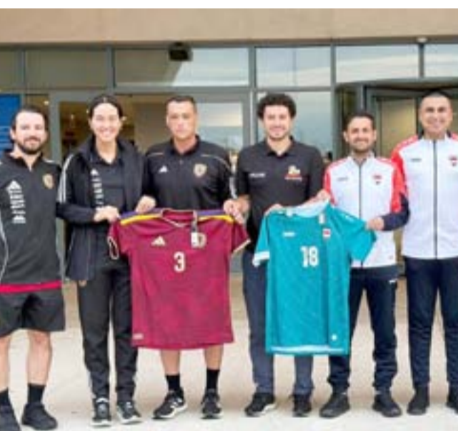
تحديد: فيفا يعلن للباس لمنتخب العراق وفنزويلا في المباراة الودية

اسم الكرخ بهدف لولا قوة دفاع الفريق الأفضل بين الجميع 26 هدفاً لتراجع في الترتيب كما واجه مشكلة انعدام جود المدرب الثابت القادر على قيادة الفريق الذي خاض لاجتهادات اربعة مدربين وافكار مختلفة في واحدة من اهم التحديتات لكن الفريق ظهر متوازناً في المرحلة الأولى وتقدم في البداية وسرعان ما تراجع بعدها واخذ يظهر بمستويات متباينة وسط انتقادات جمهوره بعد تدني المستوى وافقده للقبوة واللعب المطلوب وشهد تراجعها واضحا واكثر من المتوقع وتعثر في 14 مباراة كانت منها مواجهات سهلة داخل ملعبه في مرحلة الحسم لكنه استفاد من مجموع النقاط التي حققها في المرحلة الاولى التي دعمت المركز السادس بعدما شهدت نتائج الفريق تراجعاً في الدوري السبعة التي شاركت في الدوري الممتاز (الحدود،الجيش،الاتصالات الكاظمية، المصافي،الحسين، الحشد الشعبي ونستعرض مشاركة الفريق المشاركة في دوري النجوم حسب ترتيبها الفرقي ويقف في المقدمة فريق اربيل افضل الجميع والاعلى كعباً عندما قدم نفسه بشكل واع من البداية ونجح في السيطرة وحسم مبارياته بمساندة جمهوره وظهر في اجواء لعب مثالية وظل يخوض مبارياته بقوة وتركيز والقدرة الكبيرة على الفوز و اول فريق صع لصدارة واستمر لعدة جولات قبل ان تهتز شبابه بعد تلقي اول خسارة من الزوراء بهدف ثم تراجع للوصافة و اقل قبل ان يستعيد دوره وخطورته وظل يقدم مبارياته بتوازن واضح ونجح كثيراً مع بداية المرحلة الثانية وعزز نجاحاته ونافس الشرطة