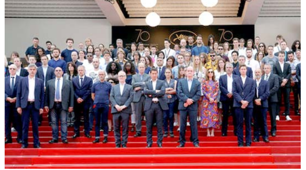
مشاركو مهرجان كان يقفون حدادا على ضحايا مانجستر

وقال قائد الشرطة المحلية بكان إيف داروس في تصريح (سنطبق الإجراءات بحذافيرها دون أن نحيد عنها لضمان أن يكون المهرجان آمنًا).