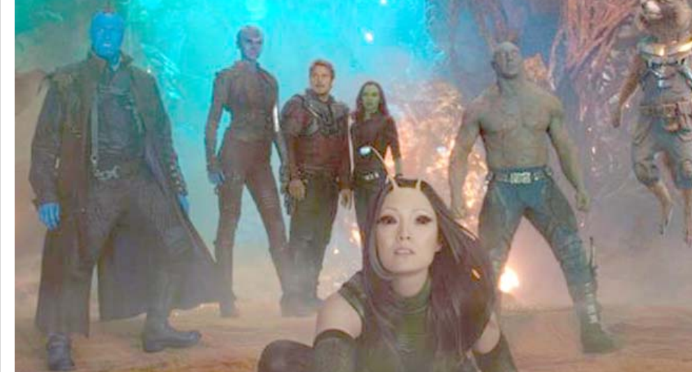
لقطة من الفيلم

وقد اكتسب الجزء الأول من حراس المجرة طابعاً مبهجاً