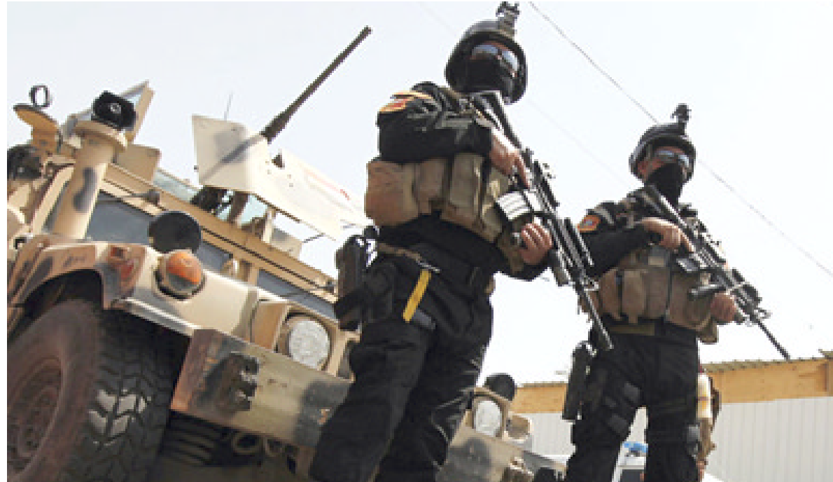
عناصر من القوات الأمنية في الأنبار

وتطبيق فعلي لذكرات القبض الرسمية وإجراء تغييرات جوهرية في القيادات الأمنية، مبيناً أن (المعتصمين قاموا بنصب سرايات وسط حضور شعبي كبير).