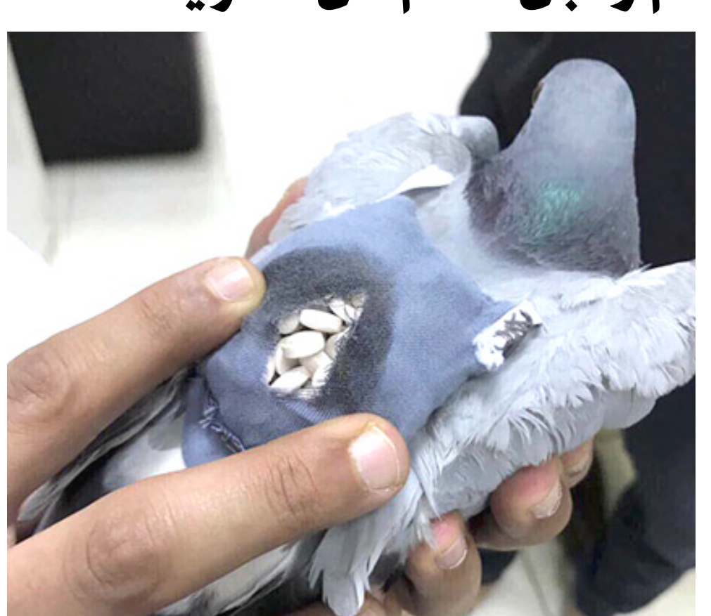
حمام ؛ كيبان من المخدرات تحملها الطيور الزاجلة