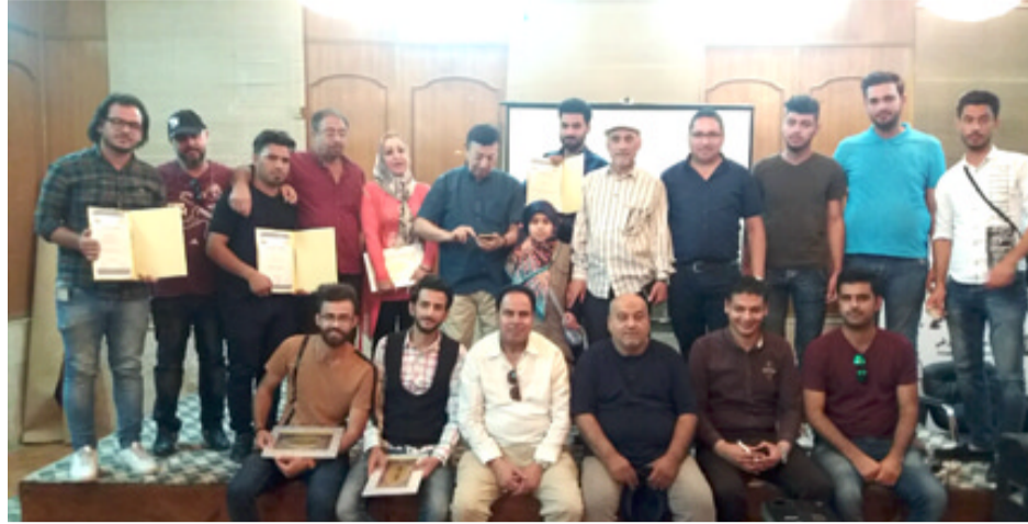
سينما الشباب : منتدى صدى السينما والمسرح يحققي بمخرجين من السماوة (الزمان)