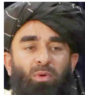
محمد حسن اخوند

اعلنت حركة طالبان امس عن تشكيله حكومتها الجديدة برئاسة محمد حسن اخوند . وقال مرشح امس ان (الحركة اختارت عبد الغني برادر نائباً له فيما اختارت سراج الدين حقاني وزيرا للداخلية ونجل الملا عمر وزيرا للدفاع)