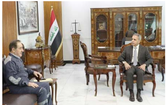
لقاء : رئيس مجلس القضاء ، خلال لقائه وزير الكهرباء ، وكالة