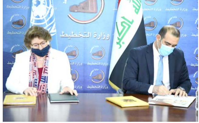
توقيع: وزير التخطيط يوقع شراكة مع الامم المتحدة