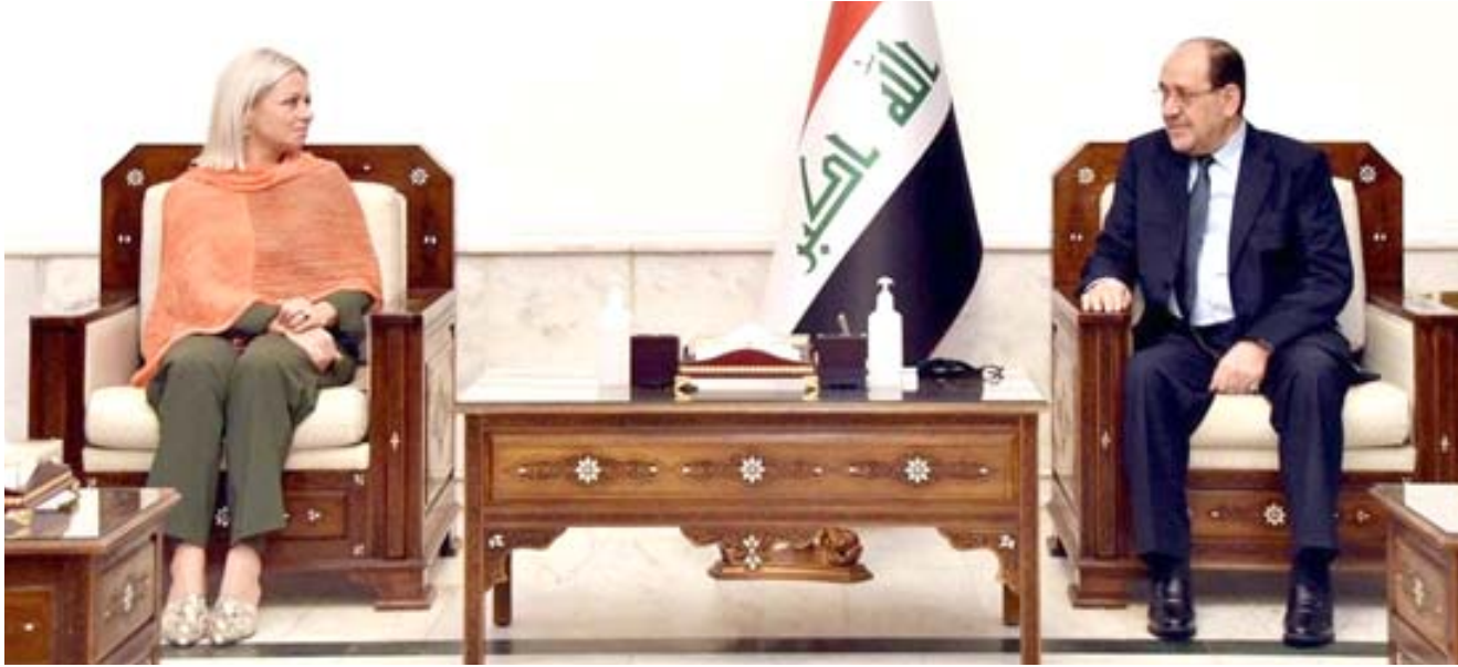
لقاء نوري المالكي يلتقي ممثلة الأمين العام للأمم المتحدة

العراقيينوبما يرسخ إرادتهم الحرة في انتخاب ممثلهم بعيدا عن الضغوط والتزوير والقلاعب)، الاممية وجهودها في دعم العملية الديمقراطية وصيانتها وقابع أن المرحلة الماضية شهد خلالها العراق عمليات اقتراع لم تشوبها عمليات تلاعب او تزوير باستثناء ما حصل في عام 2018)جددا دعوة (الحكومة الى توفير الامن الانتخابي وحماية مراكز الاقتراع من المزورين والمتلاعبين).