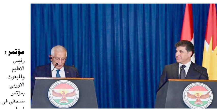
مؤتمر : رئيس الاقليم والبعوث الاوروبي يمتدح صافي في اربيل

الدعم ومساعدة العراق في مختلف المجالات) ، مشيدا بالقدّم الحاصل في العراق وجهوده في القضايا الداخلية ، وكذلك الخارجية المتعلقة بتجنيبه سياسة متوازنة تسعى لتخفيف وتوترات المنطقة. وأكد ان (الهيئة التعاون في حصر مجلس الوزراء مصطفى الكاظمي ، حرص العراق على الافادة من التجربة الأوروبية في تحويل النموذج الى عنصر قوة. وقال بيان تلقته (الزمان) امس ان (الكاظمي استقبل في القصر الحكومي ، المعينون الاوروبي ، واكد ان الحكومة تولي اهتماما كبيرا للعلاقة مع دول الاتحاد كافة في مختلف المجالات، وجرى استعراض العلاقات الثنائية والتعاون بين العراق والاتحاد ، بالإضافة الى ملف المنازحين والانتخابات المبكرة الثنائية المقبلة).