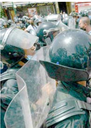
تظاهر: الامن التونسي يتصدى لمظاهرين امام مقر البرلمان في تموز الماضي

زين العابدين بن علي وتلاها فجر ثورات الربيع العربي في بلدان أخرى في المنطقة. ولفظ ناجي الحفيان (26 عاما) أنفاسه الأخيرة