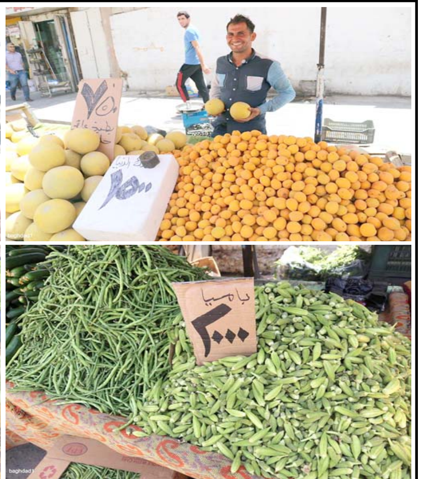
اسعار؛ مع قرب حلول شهر رمضان المبارك ارتفعت اسعار الخضار والفاكهة في الاسواق المحلية

واضاف العزاوي ، ان (دائرة صحة ديالى تقف جنبا الى جنب مع الدوائر