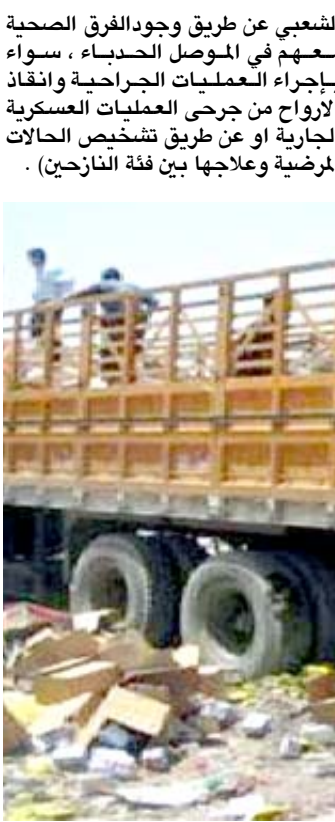
إتلاف؛ صحة ديالى تتلف كميات من المود الغذائية التالفة

واوضح العزاوي ، انه (تم توجيه غرامة مالية على صاحب المخزن لمخالفته الشروط الصحية وحسب قانون الصحة العامة) . مشيراً الى انه (تم التحري خلال