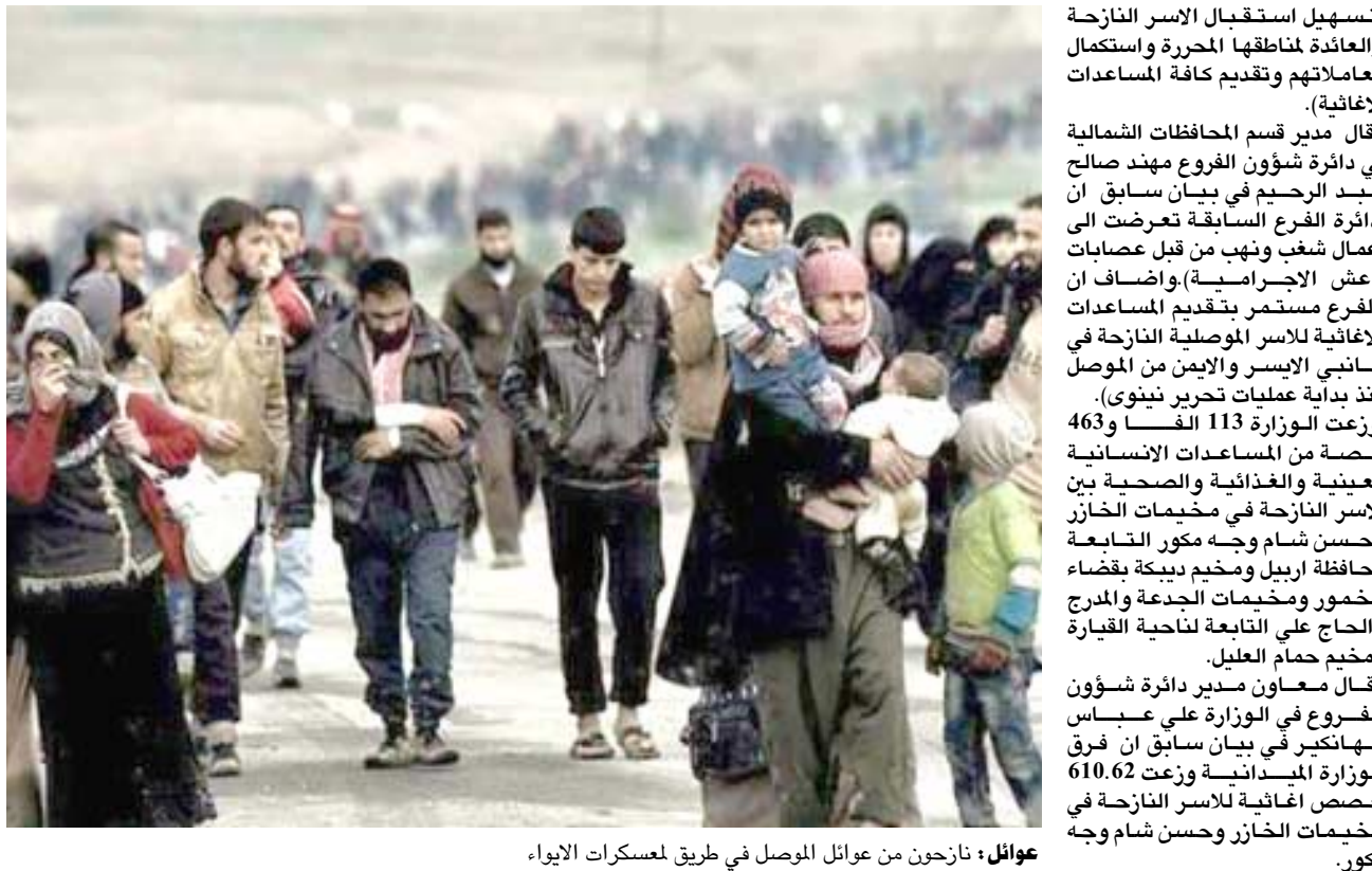
عوائل ، نازحون من عوائل الموصل في طريق المعسكرات الايواء.

فيما اكدت الوزارة ان عدد نازحي الساحل الايمن لمدينة الموصل الي بلغ نحو 526 الف نازح منذ بدء عمليات تحريره في 19 شباط الماضي، وقال الوزير جاسم محمد الجاف الجاف في بيان امس ان (اعداد النازحين من ساحل الموصل الايمن بلغت 526 الفاً و233 نازحاً منذ البدء بعمليات