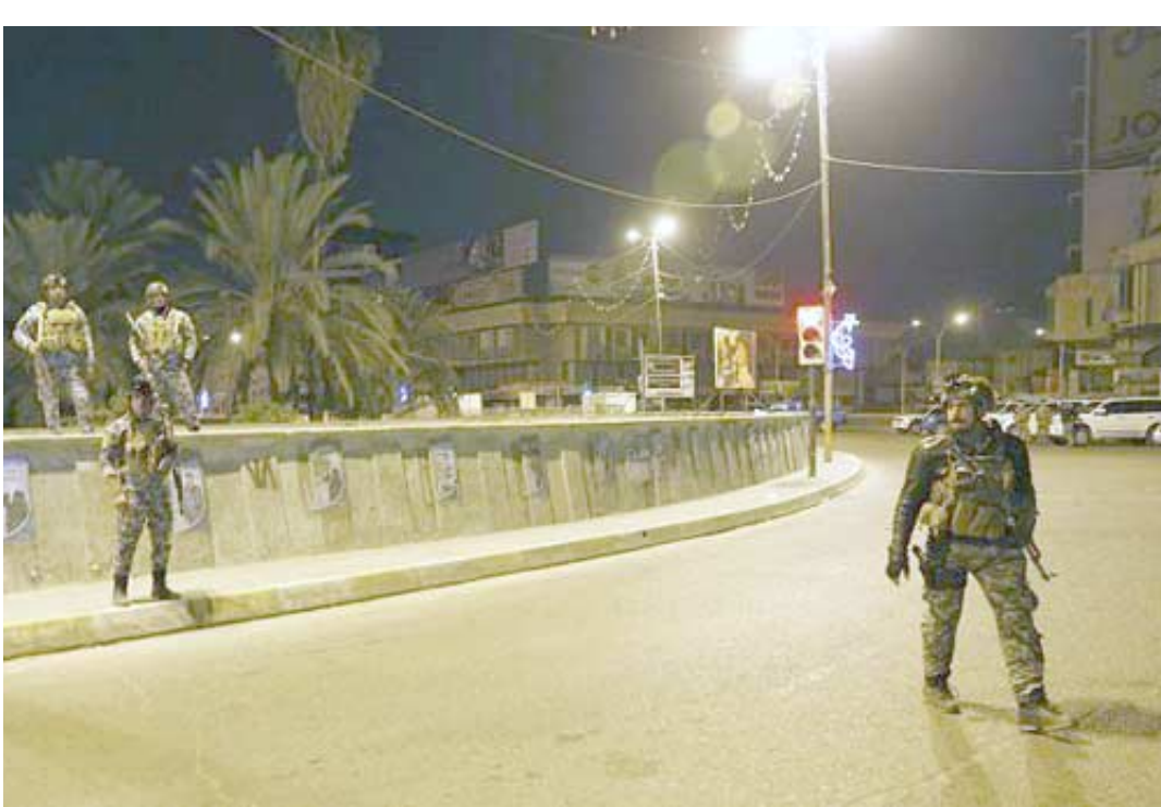
قطع ، عناصر أمن يقطعون الطرق المؤدية إلى شارع فلسطين

المسلحين الذين اشتبكوا مع القوات الامنية في شارع فلسطين شرقي بغداد ، وقوفيها مع فرض القانون وضد من