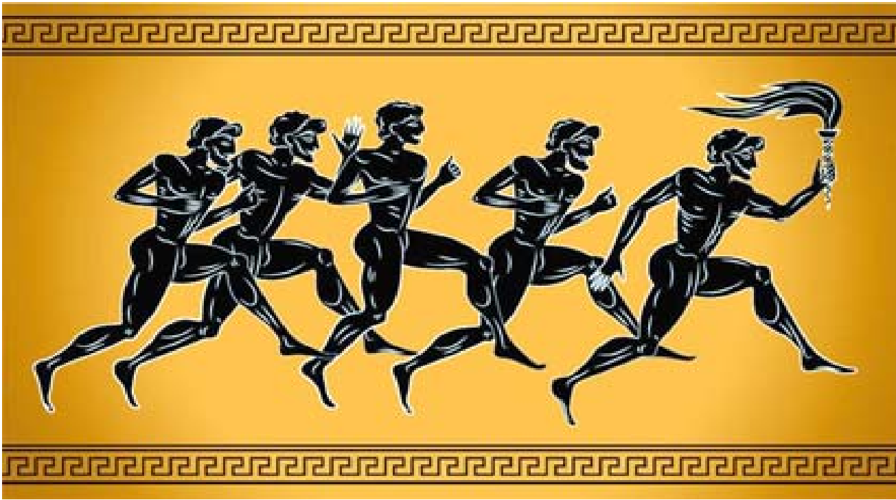
لوحة تمثل شعائر إغريقية

بعد طول انتظار، ورغم الصعوبات الصحية وغيرها، افتتحت في طوكيو دورة الألعاب الأولمبية، بحفلة بسيطة ومهيبة، كانتها طقس ديني عتيق وتحاط الألعاب الأولمبية يوماً بهالة قداسة، وفي افتتاحها واختتامها وتنظيمها والحفاوة والمرافقة لتوزيع ميداليات منصات منسج الطقوس والشعائر