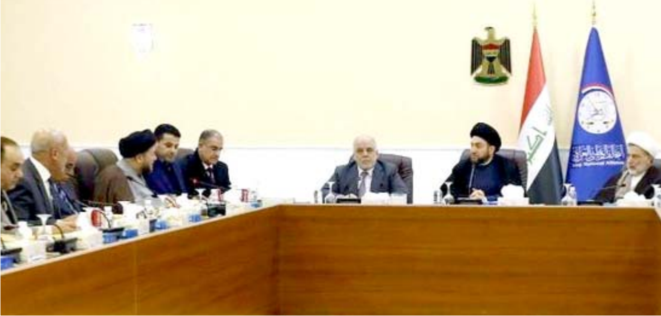
اجتماع : جانب من اجتماع التحالف الوطني بحضور رئيس الوزراء حيدر العبادي

(محكمة الجنج المختصة بقضايا النزاهة والجريمة الاقتصادية وغسيل الأموال - محكمة استئناف بغداد الرصافة الاتحادية حكمت على مديرة التسجيل العقاري السامية في المحافظة المخهمة الهاربة ج.م بالحبس الشديد لثلاثة ايام بسبب ارتكابها مخالفات تتعلق بتبلاع واضافات في السجلات وفي قيود العقارات). لافتسا الى انه (اتضح خلال التحقيق الابتدائي والقضائي المحاكمة الغيابية العلنية ان المتهمه حينما كانت تشغل منصب مدير التسجيل العقاري في المحافظة عام 2005 قامت بمفاتحة مديرة التسجيل العقاري العامة لطلب نسخ صورة للسجلات الدائمة المودعة في المديرية . برغم وجود السجلات الاصلية في الدائرة بحجة فقدانها بسبب الاحداث التي جرت عام 2003). واوضح العكيلي ان (سبب طلب