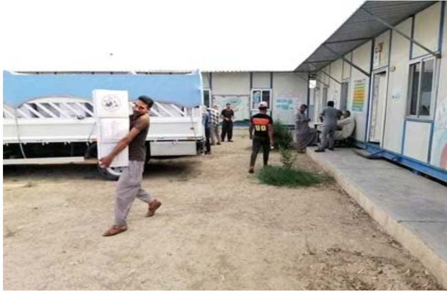
مساعدات : عمل الإغاثة يقدمون مساعدات إنسانية إلى العوائل

تؤدي مهاماً كبيرة رغم الامكانيات البسيطة، وأكد (ضرورة اختيار العناصر الكفوة والنزيهة لتكثيف المواقع الادارية في اقسام المحافظات وعدم الرضوخ لأي ضغوطات سوى