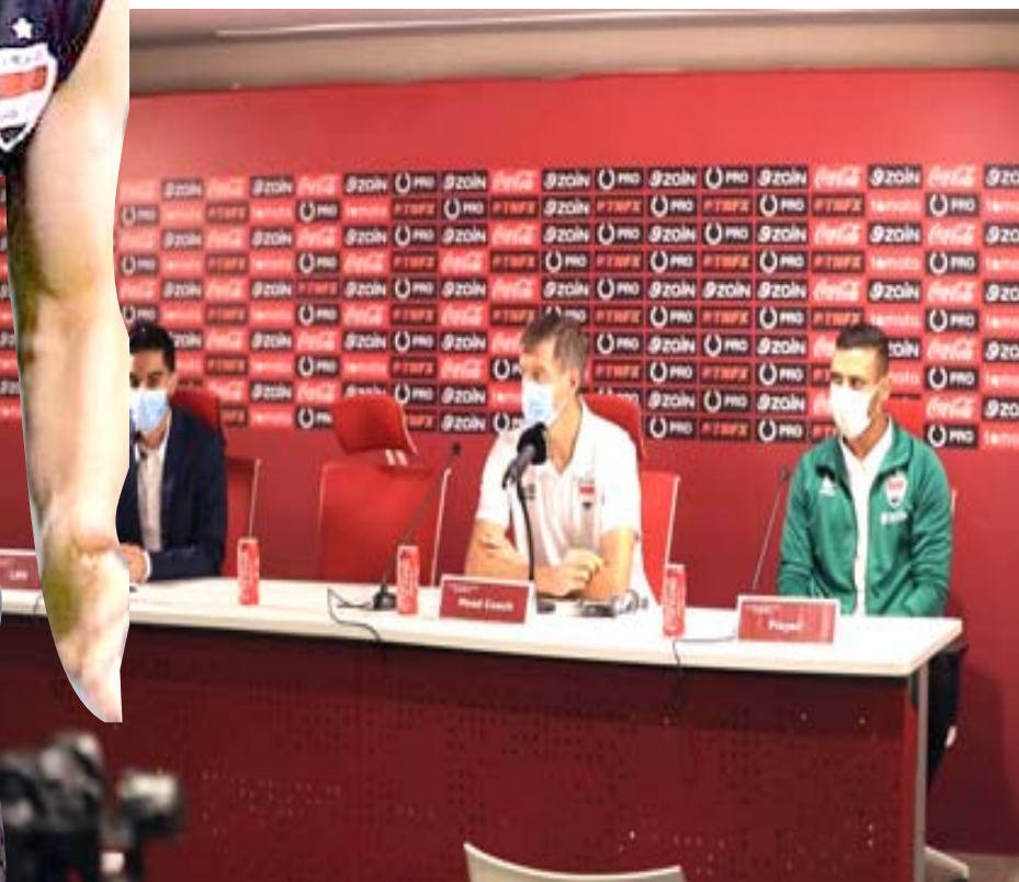
مؤتمر صحفي: كاتانيتش يجري مؤتمراً صحفياً قبل لقاء كمبوديا

بغداد- الزمان أنهى منتخبنا الوطني لكرة القدم حصته التدريبية ما قبل الأخيرة اسبوعاً على ملعب مدينة حمد في العاصمة البحرينية المنامة، وذلك تحضيراً لمواجهة منتخب كمبوديا في المباراة التي ستقام اليوم الإثنين في ملعب المحرق بتمام الساعة الخامسة والنصف مساءً ضمن مباريات المجموعة الثالثة في الدور الثاني من التصفيات الآسيوية المؤهلة لكأس العالم 2022 في قطر وكأس آسيا في الصين. وشهدت الحصّة 2023 التدريبية لمنتخبنا الوطني دخول اللاعب إبراهيم بايش في التدريبات الجماعة مع زملائه اللاعبين، وذلك من أجل التأهيل الأخير من الإصابة التي لحقت به مؤخراً، بينما سيغيب اللاعب علي فائز عن جميع المباريات الثلاث للتصفيات الآسيوية، وذلك بعد تأكد إصابته بفيروس كورونا. وركز مدرب منتخبنا الوطني لكرة القدم، السلفوني ستريشكو كاتانيتش، في الحصّة التدريبية ما قبل الأخيرة على بعض الجوانب الفنية لرسم أسلوب اللعب الذي سيدخل به منتخبنا الوطني أمام منتخب كمبوديا، وكيفية تحقيق النقاط الكاملة التي ستعبد منتخبنا الوطني إلى صدارة المجموعة من جديد قبل مباراتنا هونغ كونغ وإيران. وأقيم، المؤتمر الصحفي