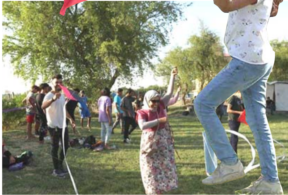
مهرجان : فعاليات متعددة في مهرجان بغداد للطائرات الورقية