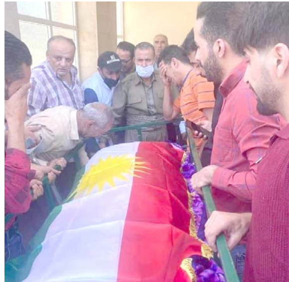
تشيع: ذو احد شهداء البيشمركة يشيعون فقيدهم امس

القليم، تدين بشدة هجوم مسلحي الحزب، ولن تسمح بعد الآن بان تصبح كردستان حديشة للاطفال واقعة قرب مدرسة، في الخيم الذي يضم الاف اللاجئين الكرد القادمين من تركيا). بدوره، أكد مسؤول امني ان (ضربة جوية ادت الى