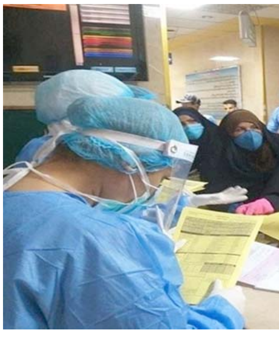
مستشفى: ردة الطوارئ باحد مستشفيات بغداد تكتظ بالمرامجين

حظر التجوال في معابر حاج عمران وبروي خان، فيما لم يعلنوا رفع الحظر عن تلك المعابر. وحذرت الإشارات من أنهما قد تشدد الإجراءات الوقائية مع من لم يتلقوا التطعيم المضاد لكورونا، وذلك في الوقت الذي تمضي فيه حملتها للتطعيم على قدم وساق. وقالت الهيئة الوطنية لإدارة الطوارئ والأزمات والكوارث إن (الإشارات، التي يقطنها تسعة ملايين نسمة ، وسعت حملة التطعيم بحيث تشمل عشرة فصاعداً، إذ قامت بتطعيم نحو 65 بالمئة من السكان المؤهلين لتلقي اللقاح). وسجلت الإشارات أول أمس 1903 إصابات جديدة بكورونا ليصل إجمالي عدد من أصيبوا بالكورونا فيها إلى 500860، توفي منهم 1559.