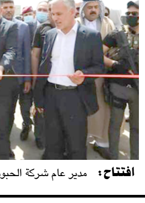
افتتاح: مدير عام شركة الحبوب يفتتح مركزي تسويق البدير وسومر