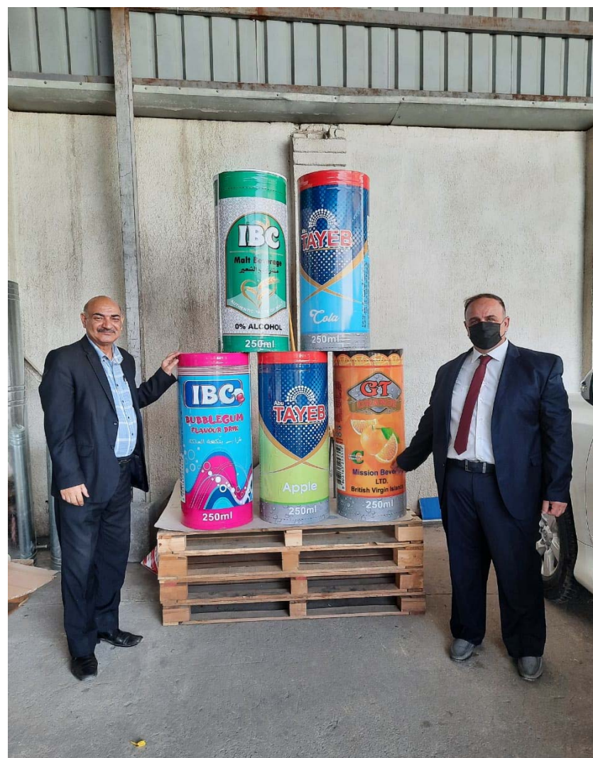
جولة (الزمان) في المصنع