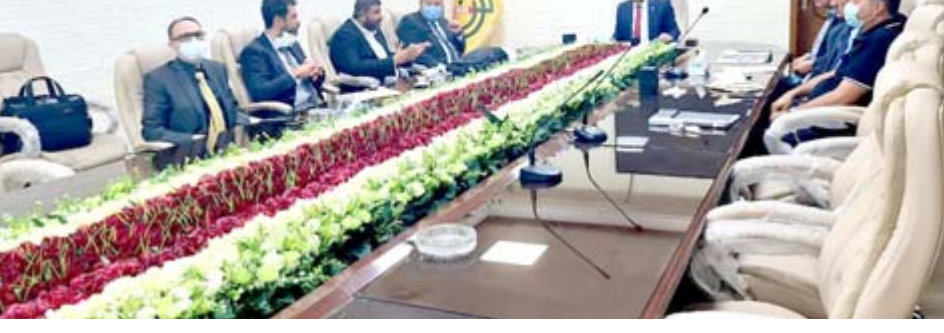
اجتماع: جانب من اجتماع شركة سكك حديد العراق مع شركة يابي التركية