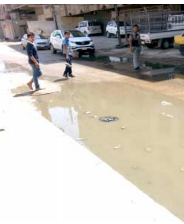
مدرسة : طح مجار أمام مدرسة النظامية للبنين في البتاويين

واوضح البيان ان (ملاكات الدوائر البلدية تستخمر قلة الزخم المروري ومرونة توزيع الجهد الاي بعد نهاية الدوام الرسمي لجمع الدوائر واغلاق الاسواق ليوايها لتنفيذ حملات مسائية لتنظيف الشوارع الى جانب الحملات الليلية التي تستمر حتى الساعة الثانية بعد منتصف الليل ). وتابع ان (الامانة نفذت نسب انجاز متقدمة في اعمال تطوير ساحة ميسلون ضمن قاطع بلدية الغدير في