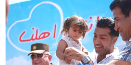
همام إبراهيم يهب أطفال النازحين (الزمان)

يومياً والتي تقام بالتعاون والتنسيق مع شركة ماس سيتي والمنظمة الحكومية لصندوق دعم التعليم (الإيفاد) والرابطة العالمية لزملاء ومندوبي الأمم المتحدة السابعة للمجلس الاقتصادي والاجتماعي للأمم المتحدة، وأشار الموقع الإلكتروني الذي نشر الخبر أنه (وضمن الحملة نفسها ستقوم الفنان همام قبيل عيد الفطر بتوزيع كسوة العجيد على النازحين)، ويزور ابراهيم العراق بعد غياب امتد 16 عاماً.