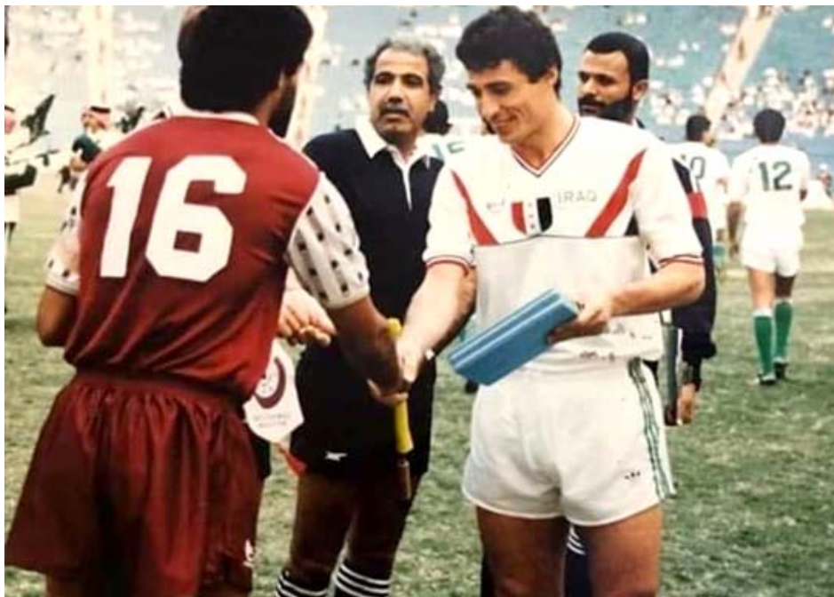
جانب من إحدى مواجهات بطولة الخليج السابقة

بغداد - الزمان أعلن اتحاد كأس الخليج العربي لكرة القدم عدم إقامة بطولة خليجي 25 لكرة القدم في العراق. وأكدت لجنة التقنين التابعة للجنة تقييم ملفات خليجي 25 لكرة القدم، التابعة للاتحاد، في بيان، أنها تؤكد صعوبة إقامة البطولة في العراق، لظروف أمنية، لافتة إلى إلغاء زيارة اللجنة للعراق، والتي كانت مقررة في يناير الماضي لتفقد منشآت البصرة على ضوء بعض الأمور الأمنية التي حدثت قبل الزيارة. وأضاف البيان، أن المكتب التنفيذي لاتحاد كأس الخليج، سيقعد اجتماعاً الأسبوع المقبل لتحديد الدولة المستضيفة للبطولة.