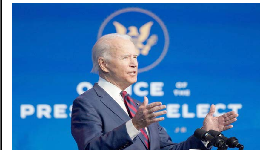
مؤتمراً : بايدن يلقي كلمة خلال مؤتمر صحفي

وقال بايدن الحقيقة هي ان الاتفاق الذي توصل اليه الرئيس السابق لم يتم التفاوض عليه بطريقة صلبة جدا. وأكد ان عدم انتقال السلطة بالشكل التقليدي بين إدارة ترامب وإدارته من تشريين الثاني إلى كانون الثاني منعه من الوصول إلى هذه المعلومات خصوصا في ما يتعلق بمحتوى الاتفاق بين الولايات المتحدة و طالبان. وارتدت الولايات المتحدة عندها سؤاله من المذيع إن كان يعتبر أن الرئيس الروسي قاتل، أجاب جو بايدن نعم اعتقد ذلك. على سعيد متصل قال بايدن إن انسحاب جميع الجنود الأمريكيين من أفغانستان بحلول الأول من أيار كما هو منصوص عليه في الاتفاق مع حركة طالبان، كان ممكنا لكنه صعب. وأوضح في مقابلة بثتها قناة "إيه بي سي" الأمريكية الأربعاء يمكن أن يحدث ذلك، لكنه صعب متقددا الاتفاق الذي توصل إليه سلفه دونالد ترامب مع المتمردين. وأضاف "أنا بصدد اتخاذ قرار لموعد مغادرتهم موضعا أن الإعلان عنه سيكون قريبا بعد التشاور مع حلفاء واشنطن والحكومة الأفغانية.