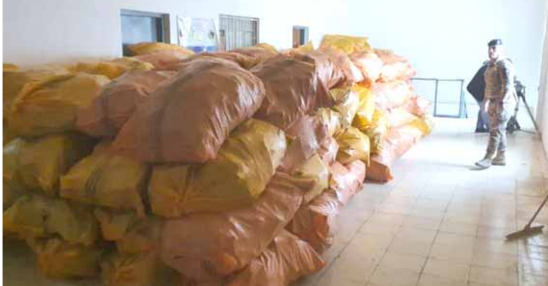
ضبطاً، قوة أمنية تضبط كميات كبيرة من الحبوب المخدرة في كركوك

وكتشف مصدر ثأن في مديرية استخبارات والتحقيقات الاتحادية عن ضبط عدد من شركات السياحة في محافظة كربلاء، تقوم بتزوير ورقة الفحص الطبي الخاصة بالفاروس للمواطنين الذين يرومون بالسفر خارج البلاد، من دون الذهاب إلى مركز فحص المسافرين التابع لوزارة الصحة مقابل مبالغ مالية، حيث أن ورقة الفحص الطبي تحمل ختم وتوقيع مدير الصحة العامة مزيف، إذ تم اتخاذ الإجراءات