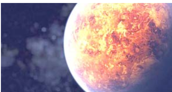
بقية الخبر على موقع الزمان

المركب موجود في الكواكب العملاقة الغازية في المجموعة الشمسية، مثل زحل لكن ليس له أصل جيولوجي أي من المصادر المرتبطة بأشكال الحياة. أما آثار الفوسفين الموجودة في الغلاف الجوي الأرضي فمحصرتها بالأنشطة العضوية أو الجراثومية. كما أن وجود الفوسفين وهو مركب عالي السمية، لا يتعارض مع الغلاف الجوي الخالي من الأكسجين الذي يتناقل الشمس، فهذا الكوكب الذي يتألف