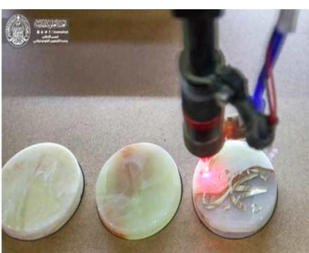
ماكينة حديثة لتصميم النقوش