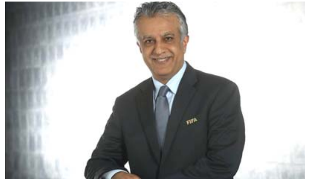
سلمان بن إبراهيم آل خليفة رئيس الإتحاد الآسيوي

أكد سلمان بن إبراهيم آل خليفة رئيس الإتحاد الآسيوي لكرة القدم النائب الأول لرئيس الإتحاد الدولي لكرة القدم أن عودة الحياة لمسابقات الإتحاد الآسيوي من نافذة دوري الإبطال تعد بمثابة رسالة رياضية آسيوية نبيلة في مواجهة الظروف الراهنة التي فرضتها ظروف جائحة فيروس كورونا المستجد كوفيد-19 وأشار معالي الشيخ سلمان بن إبراهيم آل خليفة أن استئناف مسابقة دوري إبطال آسيا في العاصمة القطرية الدوحة يعد بمثابة الهدية للعاملين في الصقوف الامامية والكوادر الطبية في مواجهة الجائحة بمختلف دول القارة الآسيوية والذين يلعبون دور البطولة على امتداد شهور