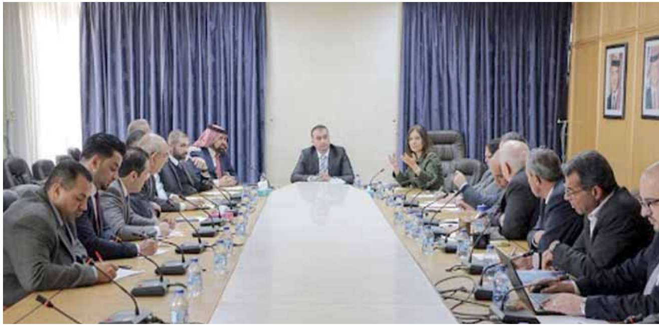
اجتماع: جانب من اجتماع لجنة الطاقة النيابية

والرعاية الاجتماعية وحلت مشكلة المشمولين بقانون الدرج الصحي ( . ويشان موازنة 2021 قال انها ستكون مختلفة وهي في طور الإعداد، حيث سيكون هناك تعاط جديد في الداخلي والخارجي، كما ان العجز في موازنة 2020 كبير، منوهاً الى ان الموازنة آمنت رواتب الموظفين والمتقاعدين (الكاظمي وصف موازنة العام الحالي بأنها بسيطة استثنائية). وأشار الى ان موازنة العام الحالي جاءت من اجل تنظيم عملية الاقتراض الداخلي والخارجي، كما ان العجز في موازنة 2020 كبير، منوهاً الى ان الموازنة آمنت رواتب الموظفين والمتقاعدين