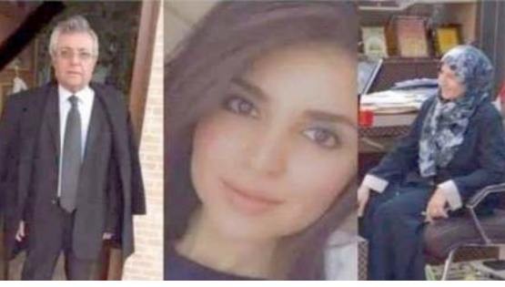
عائلة : الصيدلانية المغرورة مع ابنيها وامها