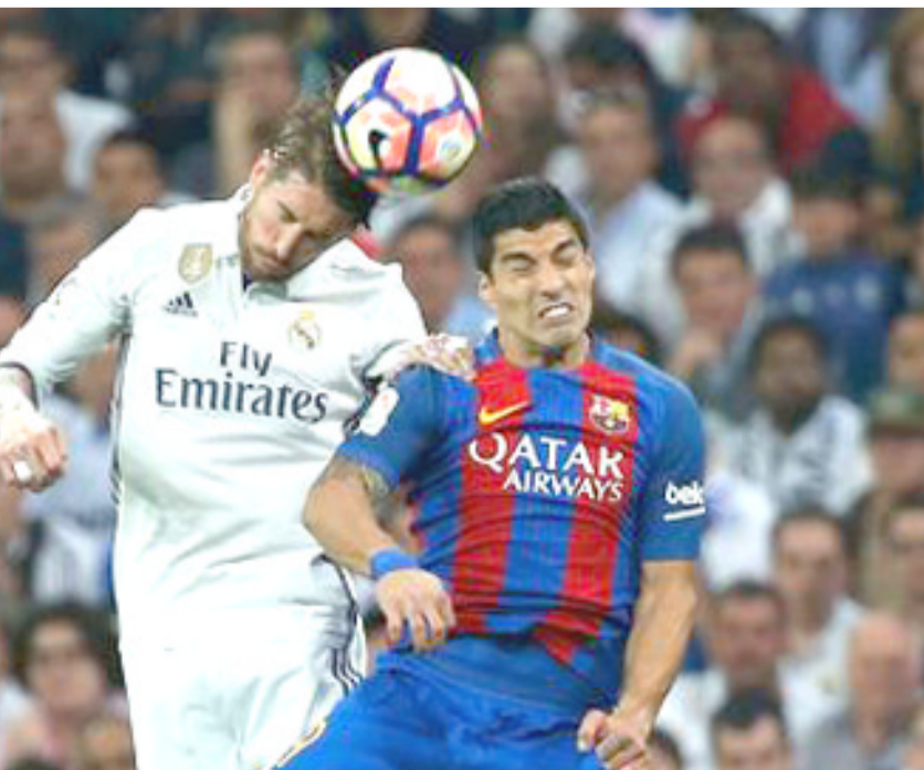
لقطة صراع على الكرة بين سواريز وراموس