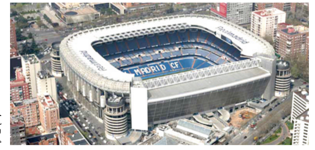
جانب من ملعب سانتياغو برنابو التابع لريال مدريد

□ مدريد - وكالات: أصبح جيرارد بيكيه، مدافع برشلونة، العدو الأول لجماهير ريال مدريد، خاصة بعد التصريحات الأخيرة، التي أطلقها الدولي الإسباني، ضدّها، ويستخسف ريال مدريد، برشلونة في كلاسيكو الأرض، مساء أول أمس الأحد، ضمن الجولة 33 من الليجا. وقالت صحيفة ماركا الإسبانية، إن جماهير ملعب سانتياجو برنابيو، الخاضع بريال مدريد، انفجرت في وجه جيرارد بيكيه، منذ دخوله أرض الميدان، لإجراء العمليات الإحماية، قبل المباراة.