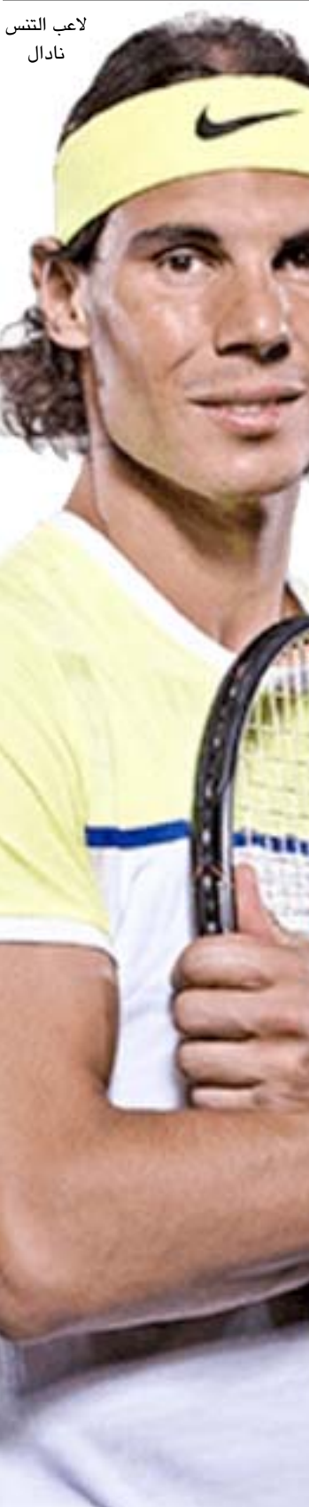
لاعب التنس نادال

□ باريس- وكالات- أبدت لاعبة التنس السابقة، الفرنسية ماريون بارتولي، قلقها من تراجع اللاعبين واللاعبات في المشاركة ببطولة أمريكا المفتوحة، التي ستخطف نهاية أغسطس/ آب المقبل، وقالت بطلة ويمبلدون السابقة، في تصريحات صحفية "الجميع يتحدث الآن عن بطولة أمريكا، إنها واحدة من أهم البطولات في عالم التنس، هناك الكثير من الغموض حول مصير البطولة والمشاركين بسبب كورونا". وتابعت "إجراءات التنقل بين الدول لا زالت تخضع لقواعد صارمة، لم يتم فتح جميع المطارات حتى الآن، وكذلك الإجراءات التي أقرها منظمو البطولة، ستجعل المشاركين غير واثقين من اتخاذ القرار". وأضافت ماريون البطولات الكبرى ستفقد أكبر عدد من المتابعين، وتحظى باهتمام خاص من قبل وسائل الإعلام، لكن عدم مشاركة النجوم يقفدها الكثير من الزخم والاهتمام". وشددت "عدم مشاركة فيدرر والغياب