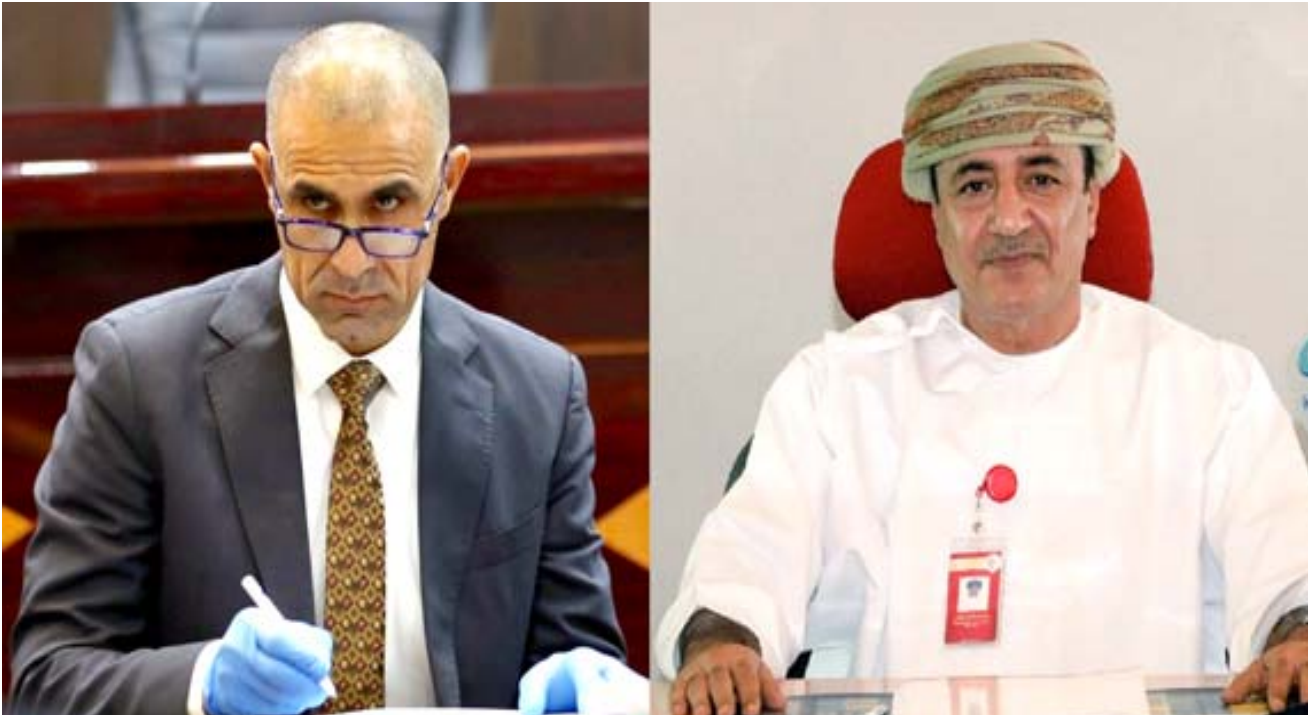
اجتماع: الإتحاد العماني يعلن استعداده الكامل للتعاون مع نظيره العراقي