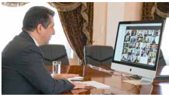
اجتماع : رئيس حكومة الاقليم خلال اجتماع مجلس الوزراء أمس

الاستفسارات التي وجهت إليهم من أعضاء البرلمان وحذك ثمن التشنيق والعمل بروح الفريق الواحد في التشكيلة الوزارية التاسعة للحكومة). وأضاف البيان ان (المجلس شدد على ضرورة استمرار الخطط الرامية لتخطي الأزمة الاقتصادية الراهنة مع تركيز الجهود لتأمين المستحقات المالية والبروتاب وهي اولوية بالنسبة للحكومة). ولفت البيان إلى أن (الإجتماع سلط الضوء على آخر تطورات المحادثات بين بغداد واربيل، حيث ابدت حكومة الاقليم استعدادها للإيفاء بما عليها من التزامات ستورية مقابل الحقوق والمستحقات الدستورية ولا سيما أن هناك عدداً من المقترحات التي تهدف إلى التوصل لاتفاق مشترك، وتابع أن (الجلسة شهدت مناقشة الإجراءات الوقائية والتعليمات الصحية الخاصة بمكافحة جائحة فايروس كورونا وبالأخص خلال أيام عيد