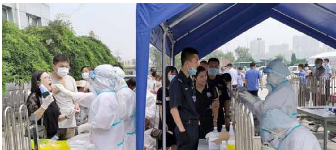
فحص: مجموعة من الملاك الطبي الصيني يفحصون المواطنين لمعرفة اصابتهم بكورونا

إصابات عالية كان في نيسان/أبريل حين تم تأكيد إصابة أشخاص. معظمهم أشخاص 108 قادمين من الخارج. وصبت السلطات تركيزها على بؤرة ظهرت للإسبوع الماضي في مصنع محلي لتجهيز ثمار البحر في داليان، المدينة الساحلية في مقاطعة لياونينغ بشمال شرق البلاد. وتم تأكيد إصابة 52 شخصاً في المدينة الساحلية المهمة الأسبوع الماضي، بينهم 30 موظفاً في مصنع. في مواجهة هذا الخطر، أعلنتت سلطات داليان الأحد عن فحوصات مكثفة للسكان وصلت إلى ثلاث ملايين عينة اختبار. وقال مدير لجنة الصحة في المدينة المغلقة، بما في ذلك المختبرات وصالات الألعاب الرياضية والحدائق والمتاحف والمطاعم والأندية الصحية سيم إغلاقها. ذكرت وكالة شينخوا للأخبار الخلفاء أن نائب رئيس الوزراء الصيني سون تشونلان حضر، خلال