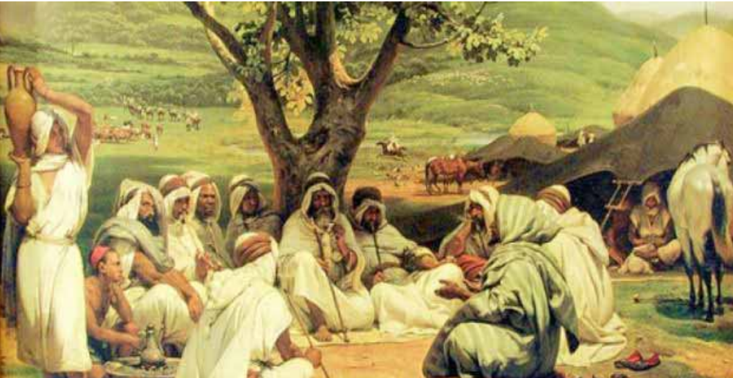
احدى القبائل العربية في العصر الاسلامي