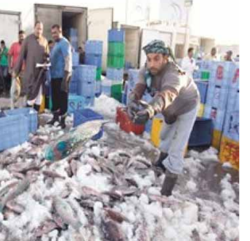
عامل في احد محلات بيع الاسماك

نصيب في صحتها وبدات اسال عن اسماء وانواع وجبتها الشبيهة..وبدخلت اجري بحث مسدى مصداقية علامها بان صحتها من اعلى صحوح بالعالم وهنا المفاجئة فعلا انها من ضمن الاطياف لانها تحتوي على انواع من الحيوانات القابلة للنقراض بالله سوف تاكل وجية بعد سنوات ليس لها وجود كما سعيده هي وعائلتها بهذا الانجاز..نعم هذا حال معظم الحيوانات لاادراك لمدى جرائمنا بحق التوازن البيئي ولا استئتمني الحية في البيئة بطريقة معقدة دخلت المطبخ لعداد وجبت الغداء وكانت تحضير وجية سمك وانا اقوم بغسلها فتفاجى بكثرة البيض في احشائها انها بالمئات بدون مبالغة