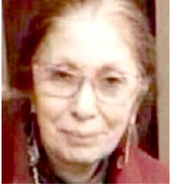
القاهرة - الزمان

بعد غياب لـ 18 عاماً وابتعادها عن الأصدقاء منذ إعلان اعتزالها عام 2002 والتزامها منزلها طيلة السنوات الماضية مع رفضها التام الظهور في أي وسيلة إعلامية، إطلالة مفاجئة للمطربة المصرية نجاة الصغيرة، إذ تمكن المارة من التقاط صور لها وهي متخفية وذلك بعد أن وقع حادث في وزارة النفط لتعيد لمسارح بغداد المبنى الذي تسكنه بمنطقة الزمناك. الحادث الذي وقع بمحل سكن الصغيرة عبارة عن تصدع بالمبنى، ومعه تحرك المسؤولين فأتبنت التقارير أن هبوطاً أرضياً وقع في فيه، وهو كائن بشوارع عزيز أنباطة في الزمناك، بسبب تشييد مشروع مترو الأنفاق الجديد، الأمر الذي اتخذ معه المسؤولين قراراً بإخلاء العقار تماماً من السكان. وظهرت الصغيرة في الصور وهي تحاول التخفي وتجلس على كرسي واضعة قدماً فوق الأخرى وقيل إنها الفنانة نجاة الصغيرة.