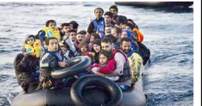
مهاجرون: قارب ينقل مهاجرين من قبرص إلى ألمانيا

وأعلن المكتب أن عملية إعادة التوطين الأولى شملت 83 شخصا من اسر لديها أطفال مرضى بشدة من اليونان إلى ألمانيا في 24 تموز/يوليو. وهي جزء من خطة جارية لالاتحاد الأوروبي لإعادة توطين 1600 قاصر في عدة دول أوروبية. وفي خطوة منفصلة ليست جزءا