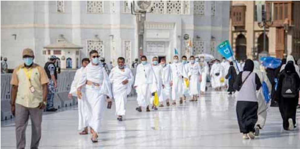
مناسك : حجاج يؤدون المناسك في ظروف الوباء الاستثنائية

الرياض - الزمان أعلنت وزارة الحج والعمرة السعودية عن أداء 10 آلاف حاج لمناسك الحج في ظروف استثنائية وفي ظل إجراءات وقائية غير مسبوقة بسبب وباء كورونا. وذكرت الوزارة أنها (قامت العديد من مكة المكرمة والصحية والعبادات المتنقلة وجّهت سيارات الإسعاف لتلبية احتياجات الحجاج الذين سيكونون ملزمين بالتقيد بإجراءات الوقاية وأهمها التباعد الاجتماعي). وبدأ الحجاج المسلمون في مكة المكرمة مناسك حج في ظروف استثنائية وفي ظل إجراءات وقائية غير مسبوقة. وتناقلت مواقع التواصل الاجتماعي صوراً تظهر مغادرة حجاج بيت الله الحرام العزل الصحي المؤسسي والتوجه إلى ميقات (السيل) لبدء مناسك الحج ويشترك نحو 10 آلاف مقيم في المناسك التي تتواصل على مدى خمسة أيام مقارنة بنحو 2,5 مليون مسلم حضروا العام الماضي، بعد عملية اختيار قامت بها السلطات عمداً البعض مهمة. إذ شهدت قبول طلبات ورفض أعداد كثيرة أخرى.