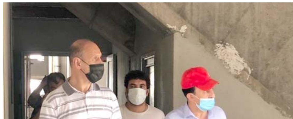
درجال يتفقد ملعب الزوراء

بغداد - الزمان رجح وزير الشباب والرياضة عدنان درجال عودة العمل في مشروع ملعب الزوراء خلال الأسبوع المقبل.