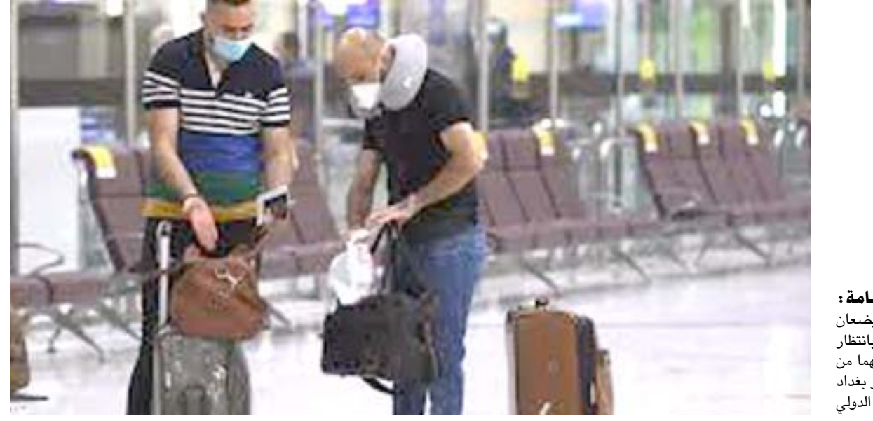
ركابا يمشان كاماة بانتظار رحلتهم من مطار بغداد الدولي

بغداد - الزمان بيروت ووجدان شبارو استأنفت رحلات الطيران المدني العراقية لسبب الهبوط الإضطراري في غالبية مطاراتها، بعد أربعة أشهر من الإغلاق بسبب وباء كورونا، حيث يعتبر رفع الحجر أساسياً لدعم الاقتصاد الذي يشهد أسوأ أزمة. وأعلنت صباح الخميس طائرات عدة من مطار بغداد الدولي إلى لبنان وتركيا، وكان الموظفون الذي يضعون كمامات وفحازات يتناقدون من فحوصات الركاب التي يجب ان تثبت خلوهم من الفيروس لتتمكن من السفر. وأعاد مطار البصرة والنجف في فتح أبوابهما للسياح أيضاً، فيما سمدت إيريل والسليمانية الإغلاق حتى الأول من آب، بحسب ما أشارت سلطات إقليم كردستان.