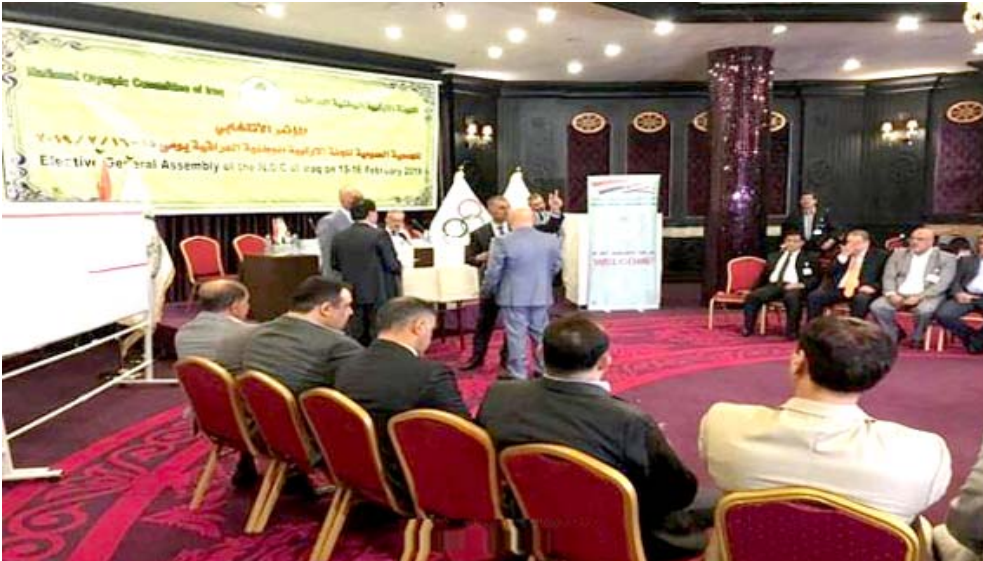
جانب من اجتماع اللجنة الأولمبية

بغداد - الزمان الوزراء من الأسباب الواسع. وأكد أن الإتحادات شكلت كتلة من الهيئة العامة رفعت شعار إعادة ترتيب البيت الأولمبي بعد أن تعطلت الرياضة جراء الخلاف بين المكتب التنفيذي السابق والقضاء العراقي بعد حل الأولمبية، ومن ثم دعت الإتحادات ضمناً كبيراً في الفترة الماضية.