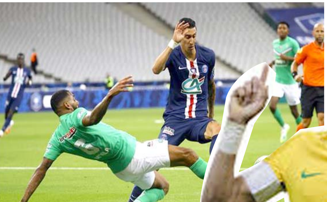
فوز حق فريق باريس جيرمان فوزاً صعباً في الدور الاسباني

لضم نجمه، خلال مفاوضات النادييين حول ليروي ساني. أشاد بيب جوارديولا، المدير الفني لمانشستر سيتي، بالمشويات الرائعة التي قدمها النجم الإسباني، ديفيد سيلفا، مع النادي الإنجليزي.