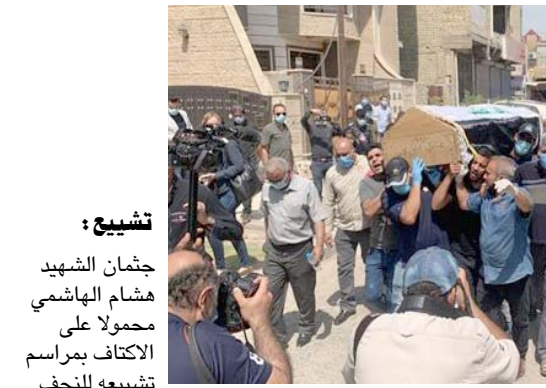
تشيع : جثمان الشهيد هشام الهاشمي محمولاً على الكاتف براسم تشييعه للنجف

التنافس الحزبي بالطائفي) ونفى الهاشمي في آذار الماضي صحة خبر باعتماله بعد تداوله عبر مواقع التواصل الاجتماعي وكفى حينها في تفريسة (شكرنا للجنس الأوجه والأخوات الذين تواصلوا معي ومع مسؤولي لاطمئناننا على سلامتي.. عظيم التقدير لكم ومحباتي لكم ، والخير مزيد تنسر على صفحة غير رسمية ومزيفة) .