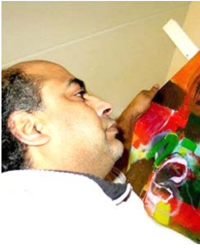
مشهد من (ياسين يغني)

لقاهرة -الزمان ما تزال حالة من الحزن تسود الوسط الفني المصري منذ الإعلان الأحد الماضي، عن رحيل الفنانة رجاء الجداوي عن عمر ناهز الـ 82 عاماً بعد إصابتها بفايروس كورونا ومنهم الفنان عادل إمام الذي قال في تصريحات تلفزيونية أن (رجاء الجداوي كانت تمتلك ثقافة عالية جداً، وتجد أكثر من لغة وراقية في شكلها وتعاملها وأخلاقها) وأشار إلى (أنها أعظم نموذج للسيدة المصرية)، وكان أيضاً الفنان يحيى الفخراني قد تقدم بالتعازي في وفاة رجاء الجداوي، وقال في مداخلة هاتفية (كلنا راحين.. بس متبقى السيرة، وسيرة رجاء الطيبة ستظل موجودة، الله يرحمها ويحسن إليها ويجعل مثواها الجنة) كما تقدم أيضاً الفنان هاني شاكر بالتعازي وقال (كم الحب والعطاء الكبير الذي تمنحه لن حولها، مهما تحدثت عنها لن أستطيع أن أوفيقها حقها)، وأضاف قائلاً: ( قلبي مقبوض منذ سماع الخبر، وكنت متوقفاً سماع خبر جيد عن تحسن حالتها واستقرارها).