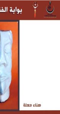
ملصق ترويجي لمعرضي علي شريف وهناء معلقة