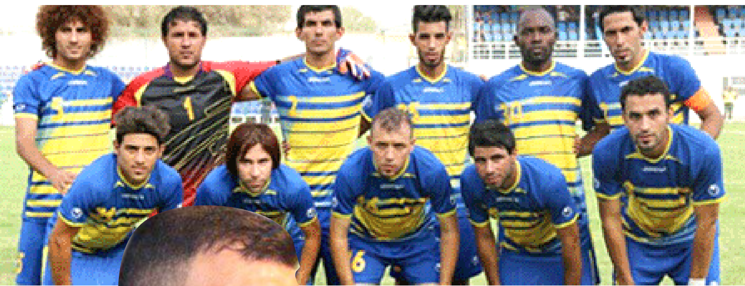
تحضيرات: فريق الحدود يستعد من جديد للدفاع عن اسمه في الممتاز

تيمور: الأندية غير المؤسساتية تستحق الدعم والمدة الحالية ليست ملائمة لتشكيل رابطة الممتاز