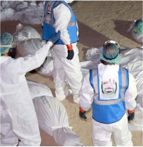
النجف - سعدون الجابري بغداد - قصي منذر

عناصر متطوعة من الحشد تهيئ جثامين مصابة بـكورونا للدفن السلام بمحافظة النجف) ، وأضاف أن الخوف من ميمنة الإصحاء وكان قد دخل العراق لزيارة العجيات الهندسية قبل انتشار الجائحة وتعرض لوعكة صحية داخل أحد المستشفيات وعالج وبدمها وأصيب بفيروس كورونا المستجد ، ثم توفي الله إثر هذه الإصابة) . وكانت جامعة جونز هوبكنز الأمريكية قد سجلت إصابة أكثر من 167 ألف شخص خلال اليوم الماضي عبر العالم بـفايروس كورونا لتصبح الحصيلة العالمية 11 مليوناً وأكثر من 620 ألف إصابة ، وأظهر عداد الجامعة صباح أمس الثلاثاء أن إجمالي الوفيات الناجمة عن مرض كورونا في العالم تخطى 538 ألفاً ، بينما تماثل للشفاة ما يزيد عن 6 ملايين و302 ألف شخص حتى الآن) ، وفي الولايات المتحدة بلغ عدد الإصابات بالمرض 936 ألف حالة ، وفي البرازيل مليون و632.2 ألف وفي الهند 719.6 ألف ، وفي روسيا نحو 687 ألفاً ، فيما تخطى مجموع عدد الإصابات 305.7 ألف حالة قاتمة الدول