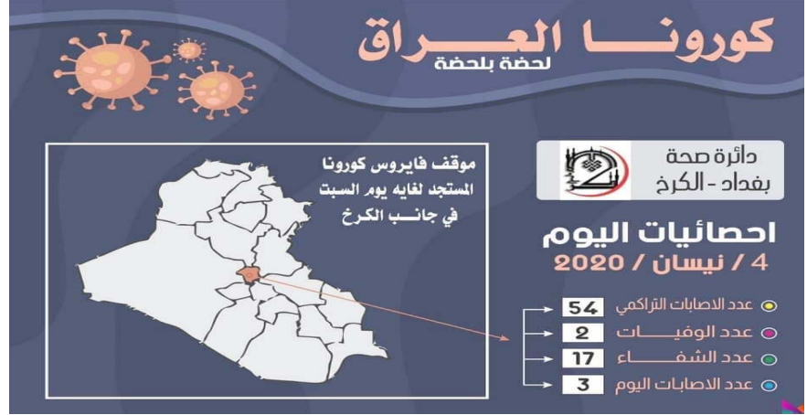
مخطط لموقع كورونا في جانب الكرخ ببغداد

عليهم خلال الساعات الماضية (الى 56 شخصاً)، وتابع انه (تم إجراء 528 فحصاً منها 342 في اربيل و 122 في كركوك و 70 في دهوك)، لافتاً الى ان (النتائج الاجمالية كانت تسجل إصابة 10 اشخاص جدد بـكورونا، 6 منها في اربيل بينهم 4 نساء وطفلان احمدين بضع عمرة 3 اشهر والثاني عمره 13 عاماً، وجميعهم من الملامسين لأشخاص مصابين في مجلس عزاء في حي كاربزان)، مؤكداً (تسجيل حالة واحدة في السليمانية وهو ملامس لمصاب سابق فضلاً عن تسجيل حالات اصابة جديدة في حلجة لرجلين وطفل وهم ملامسون لمصابين سابقين)، وافاد المتحدث باسم وزارة الخارجية احمد الصحاف بتسجيل اصابات جديدة بـفايروس كورونا في الجاليات العراقية في الخارج توزعت بين 37 إصابة في النرويج و 35 في لوس أنجلس و 22 حالة في السويد وحالتين في كندا و 4 حالات وفاة منها حالتان في ألمانيا و بريطانيا .