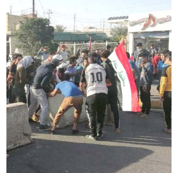
حظر : محاولات لكسر حظر التجوال في الناصرية

حظر التجوال بذريعة انه ادى الى قطع رزق الكسبية تقايهاير دعوات تحذر من ذلك وتحدثت عن مؤامرة خارجية تدفع بهذا الاجتاه بهدف تفشي وباء كورونا