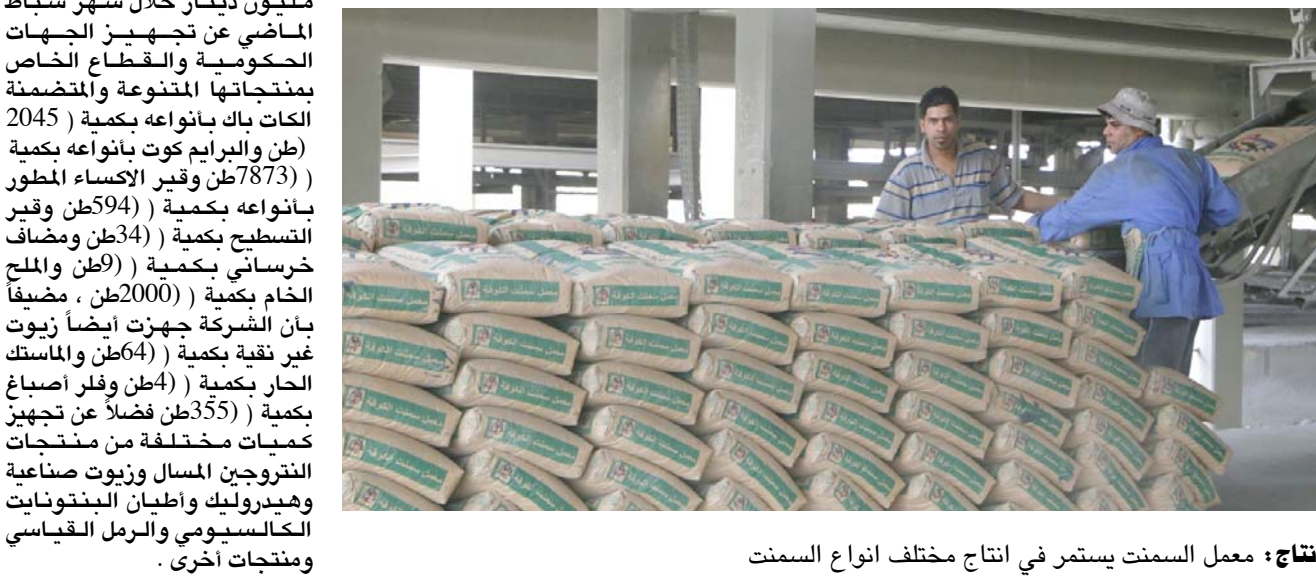
إنتاج : معمل السمنت يستمر في إنتاج مختلف أنواع السمنت