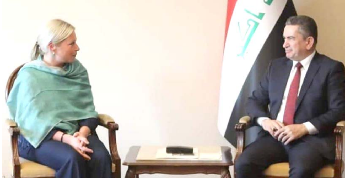
لقاء : رئيس الوزراء المكلف عدنان الزرفي يستقبل الممثلة الخاصة للأمين العام للأمم المتحدة في العراق .